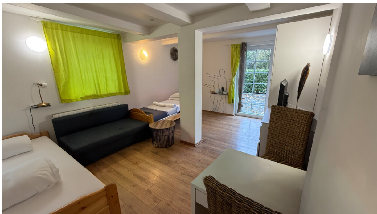
Zimmervermietung - Gästezimmer 2