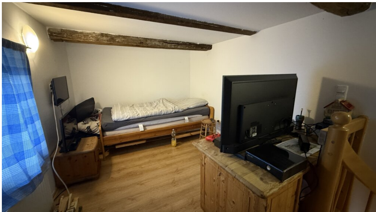
Appartment - 1. OG