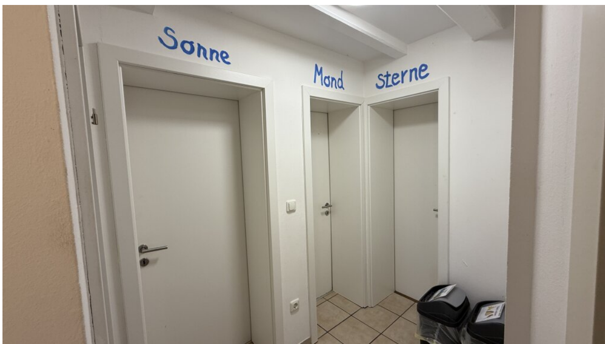
Zimmervermietung - Gästezimmer - Diele - EG