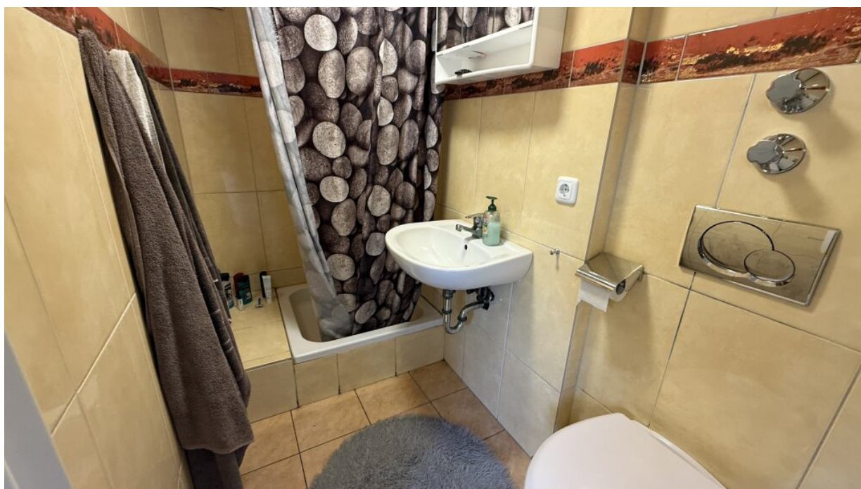
Appartment - Bad-WC