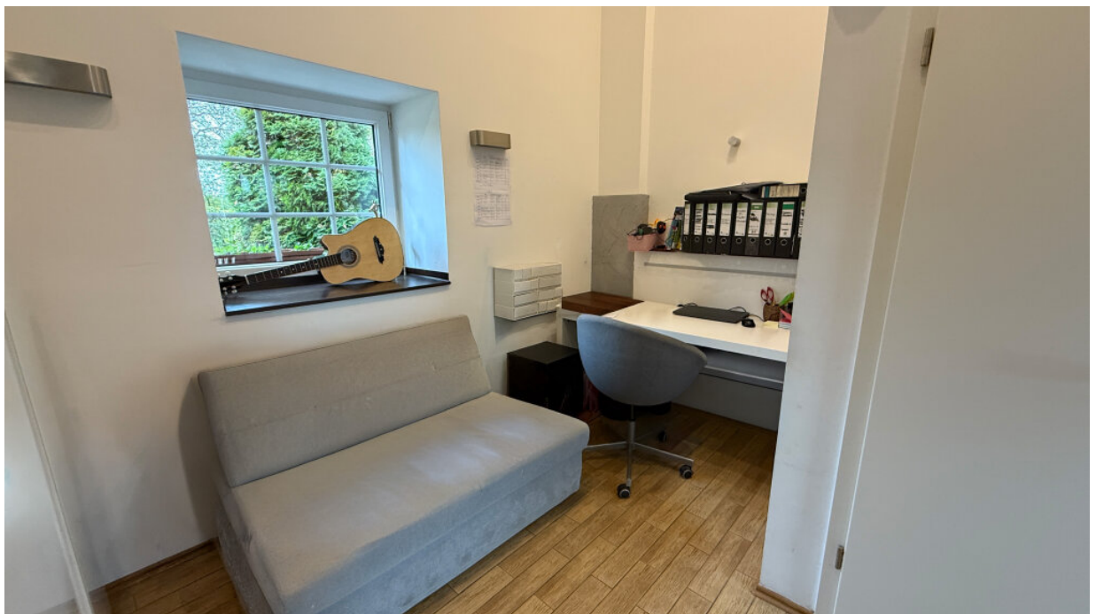
Büroecke - Erdgeschoss