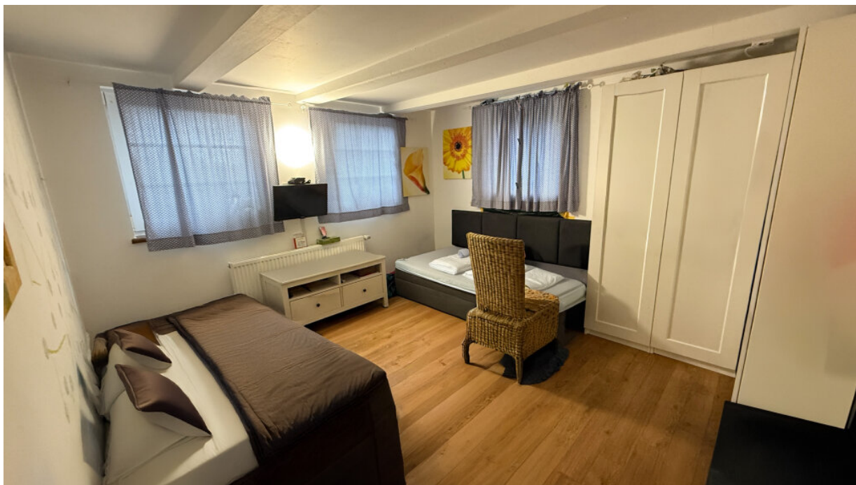
Zimmervermietung - Gästezimmer 1