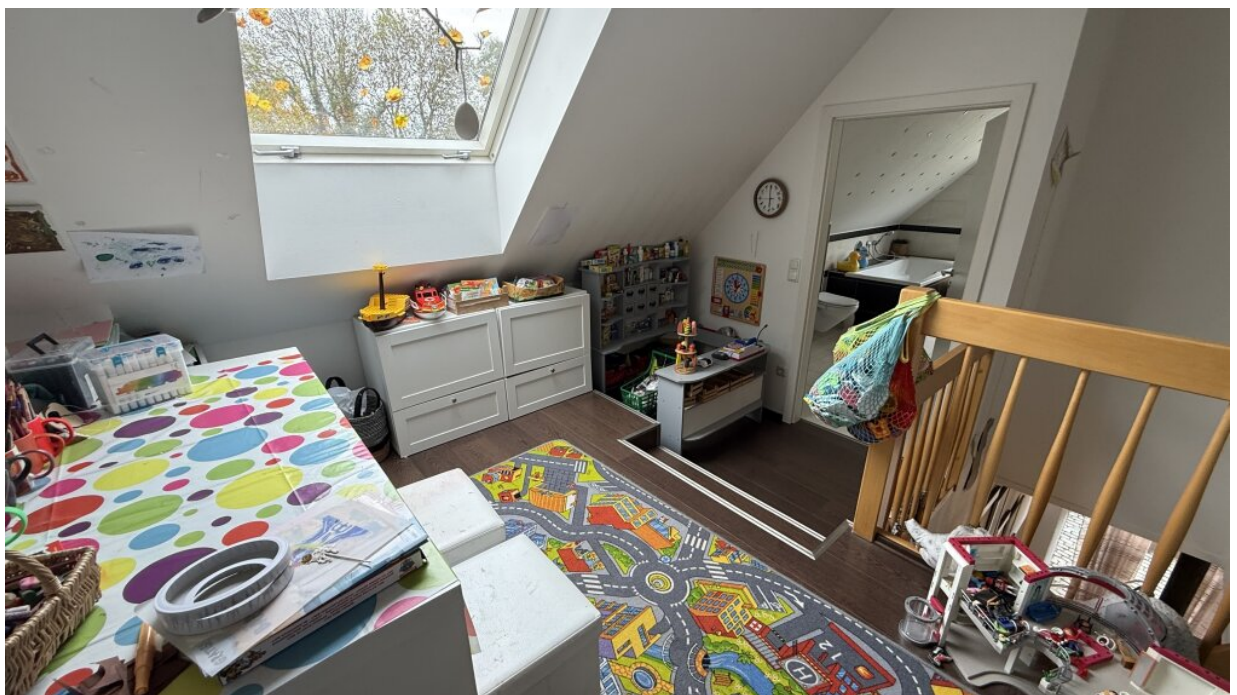
Diele - OG - Spielecke