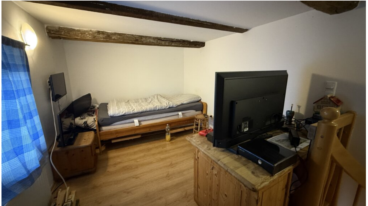
Appartment - 1. OG