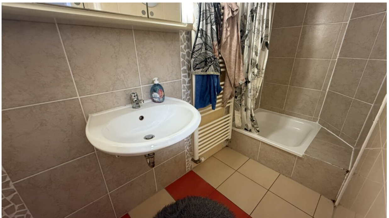
Zimmervermietung - Bad-WC-EG