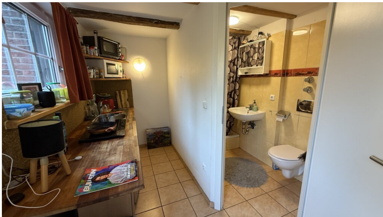
Appartment - Erdgeschoss