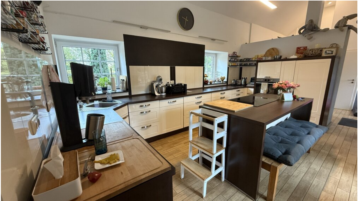
Küche - #1