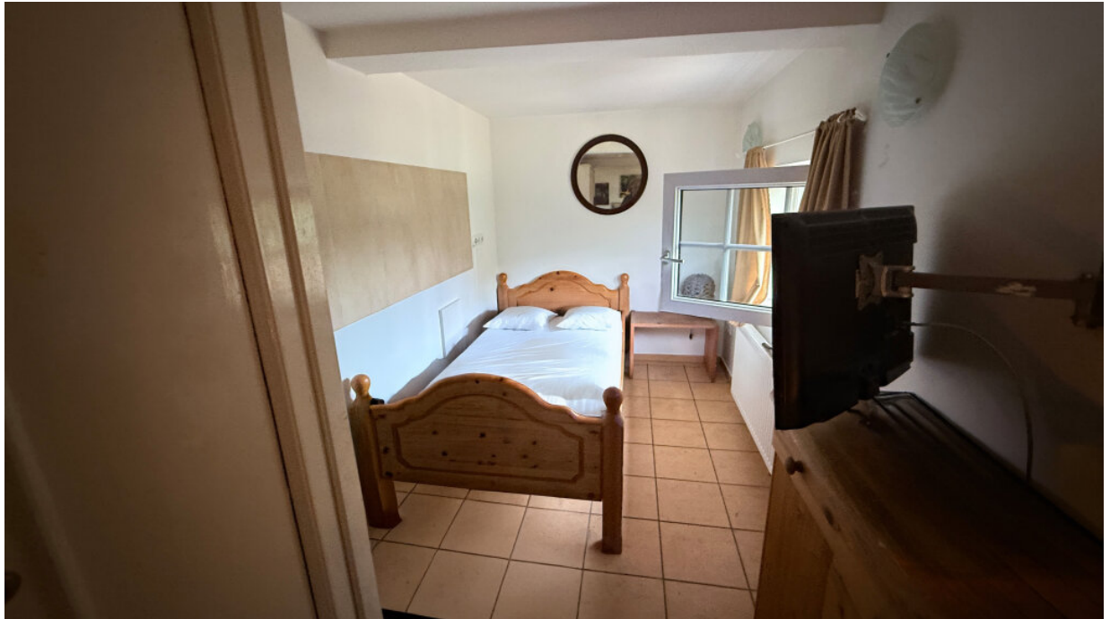
Zimmervermietung - Gästezimmer 5