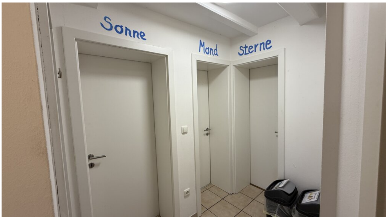
Zimmervermietung - Gästezimmer - Diele - EG