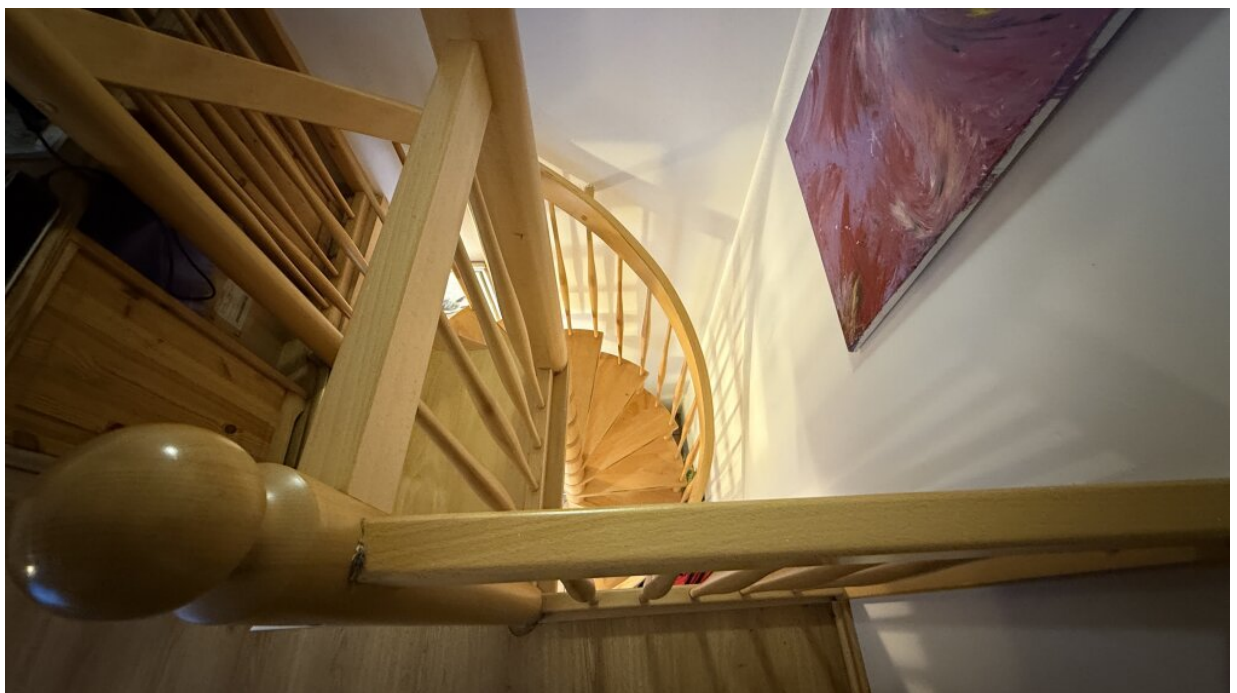
Appartment - Treppenaufgang