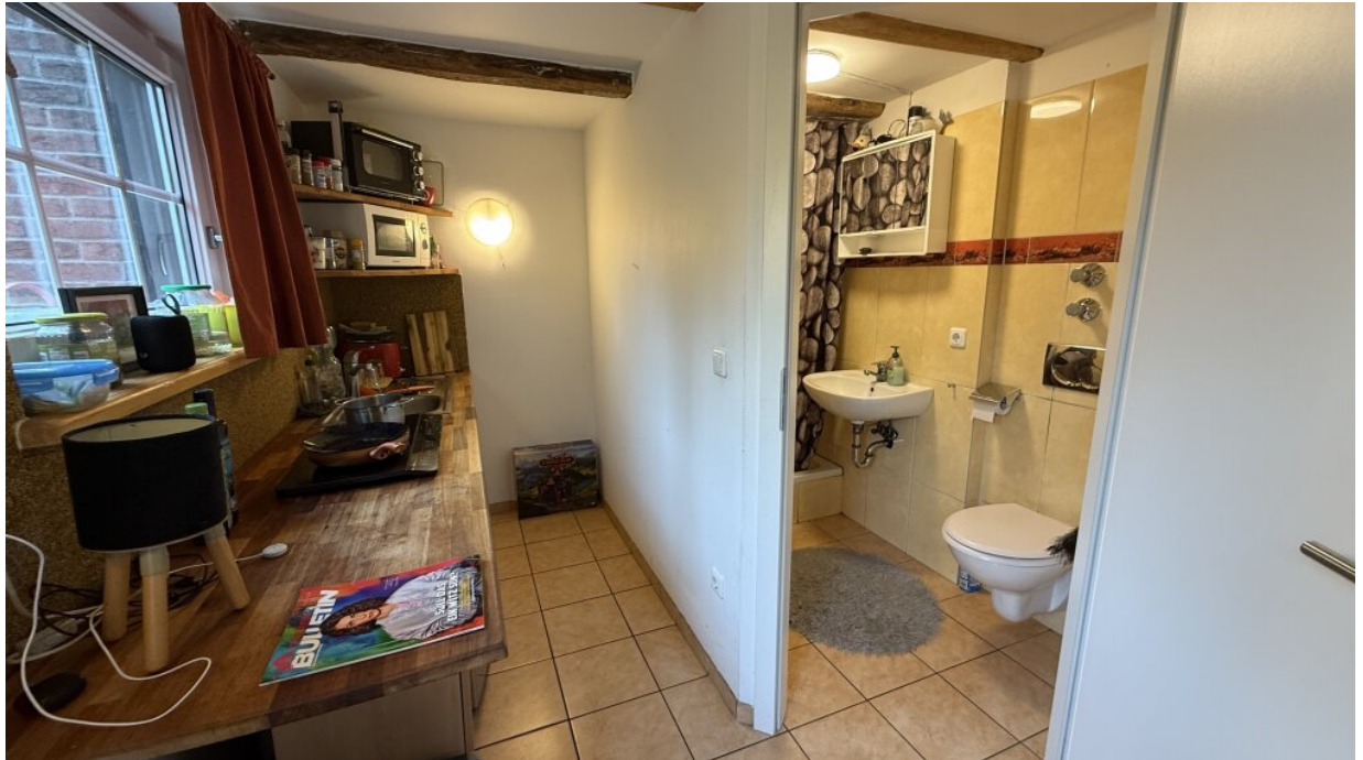
Appartment - Erdgeschoss