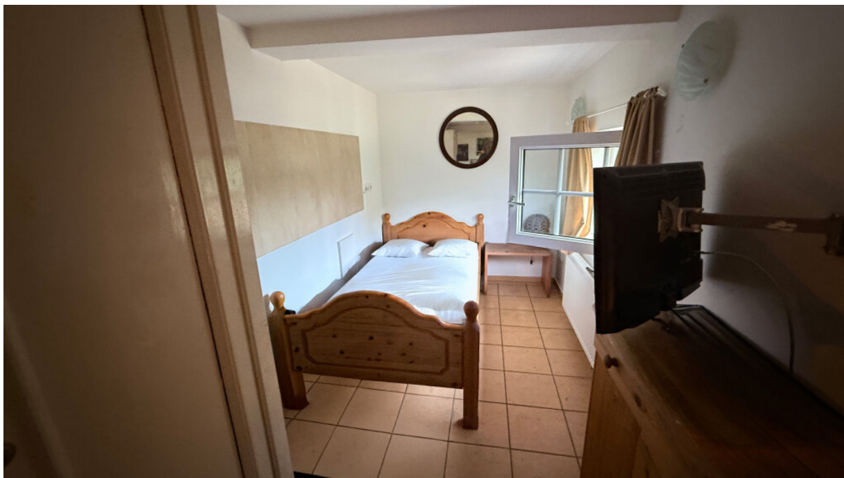
Zimmervermietung - Gästezimmer 5