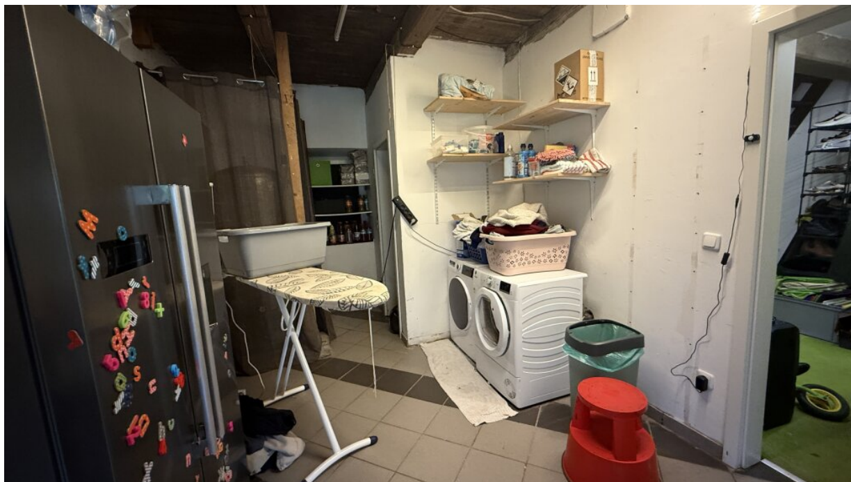
Nebengebäude - Waschraum