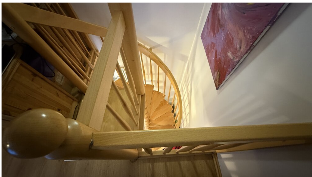
Appartment - Treppenaufgang