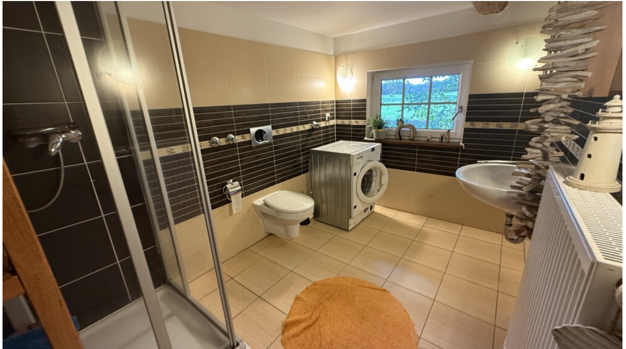
Zimmervermietung - Bad-WC-1.OG