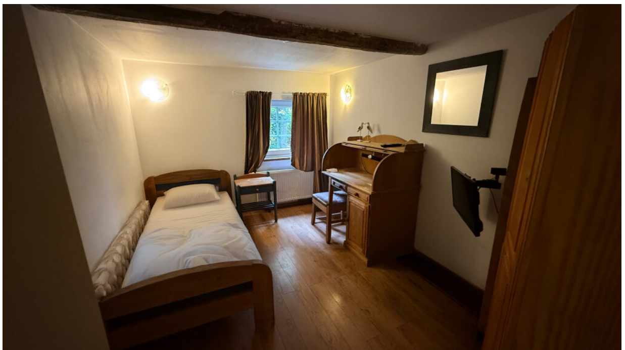
Zimmervermietung - Gästezimmer 4