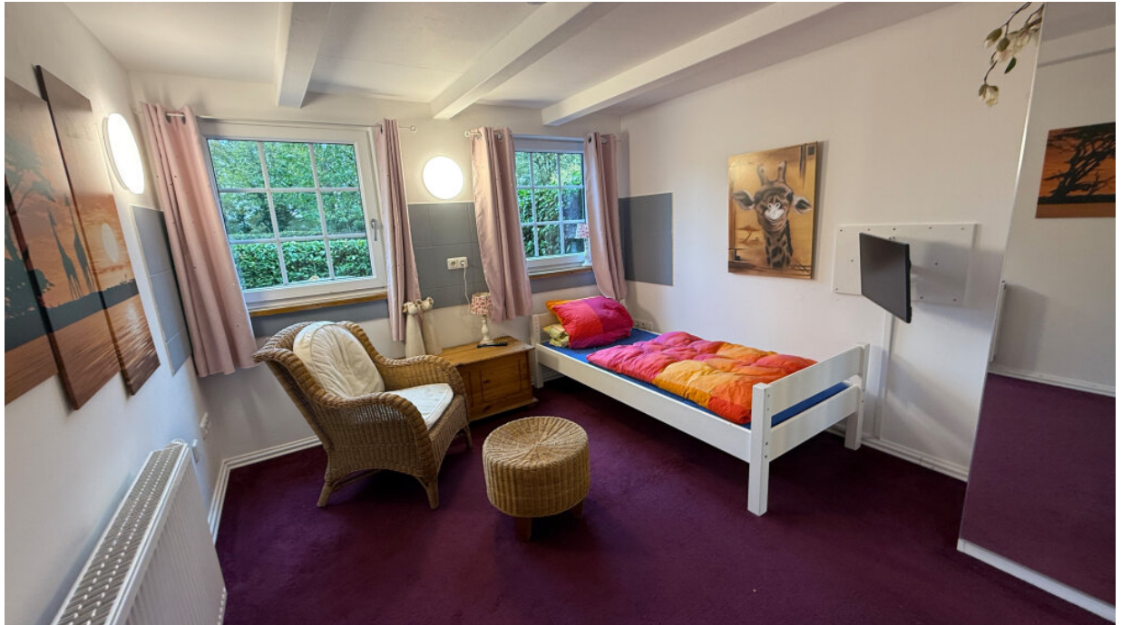
Zimmervermietung - Gästezimmer 3