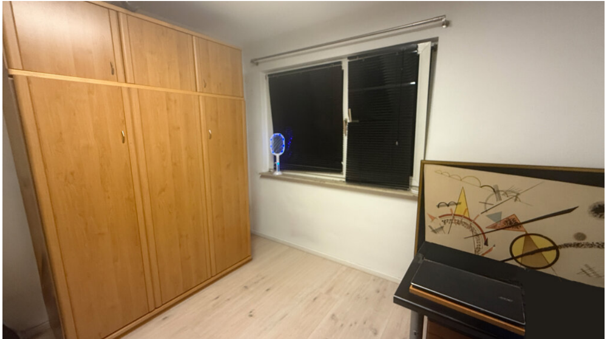
Schlafraum 1 - Fensterseite