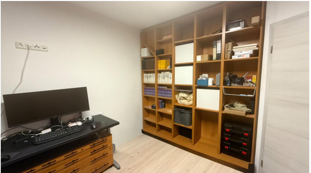
Schlafraum 1 - Zwischenwand