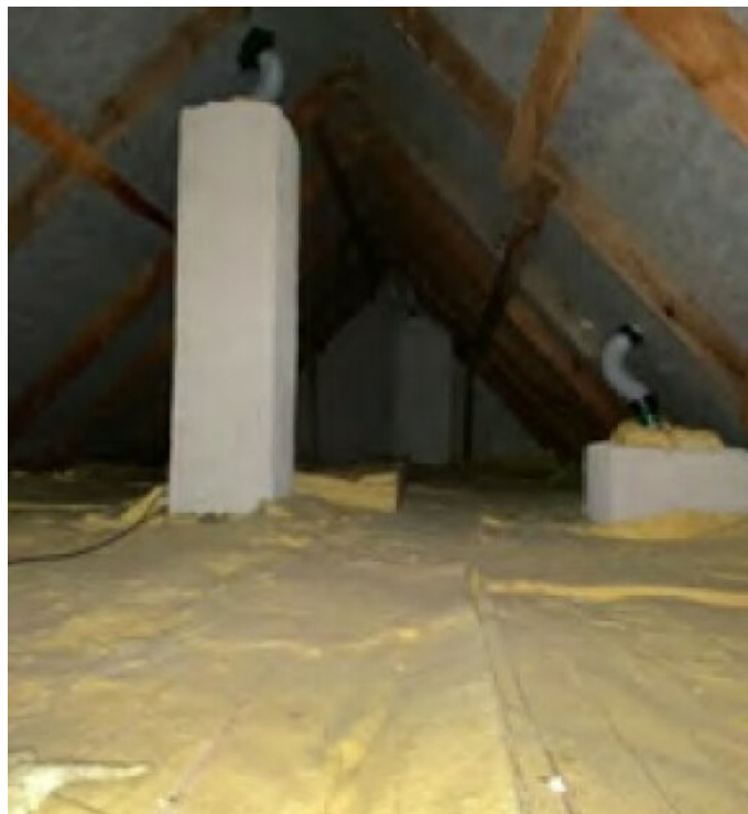
Dach ist gedämmt