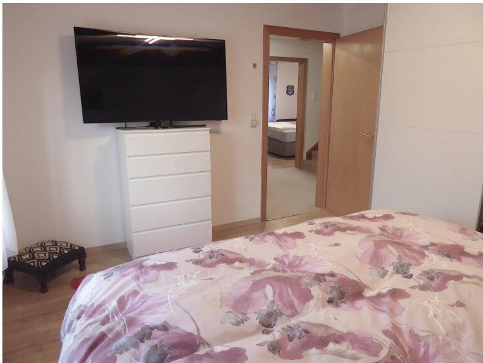
Kinderzimmer II im OG