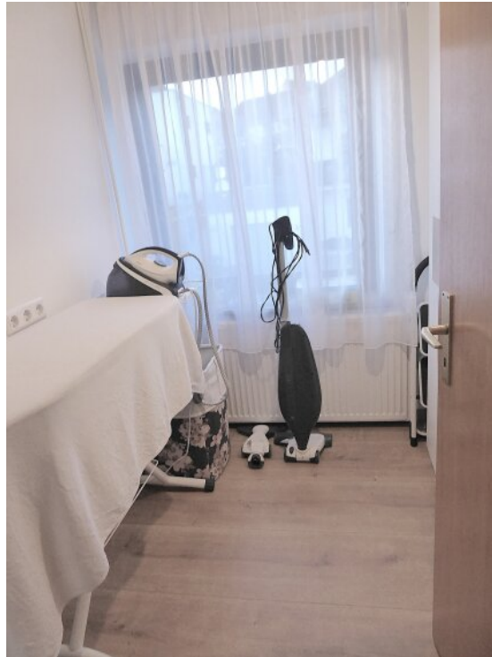
Kleiner Raum, Büro OG