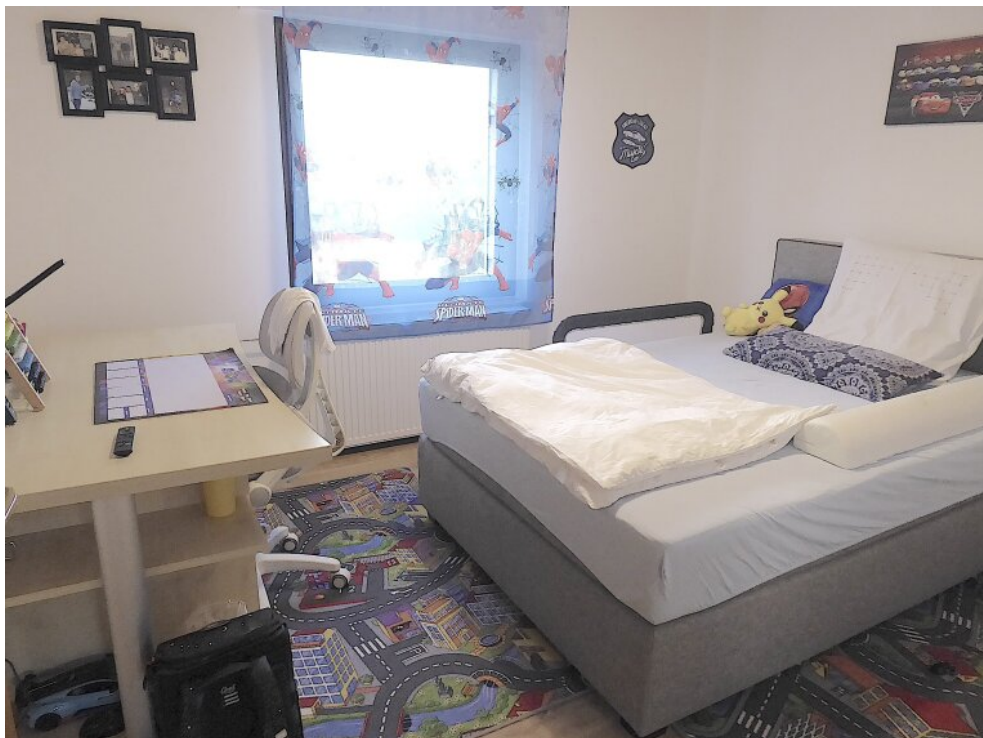
Kinderzimmer I OG.