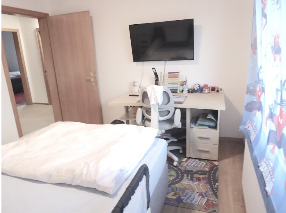
Kinderzimmer I im OG