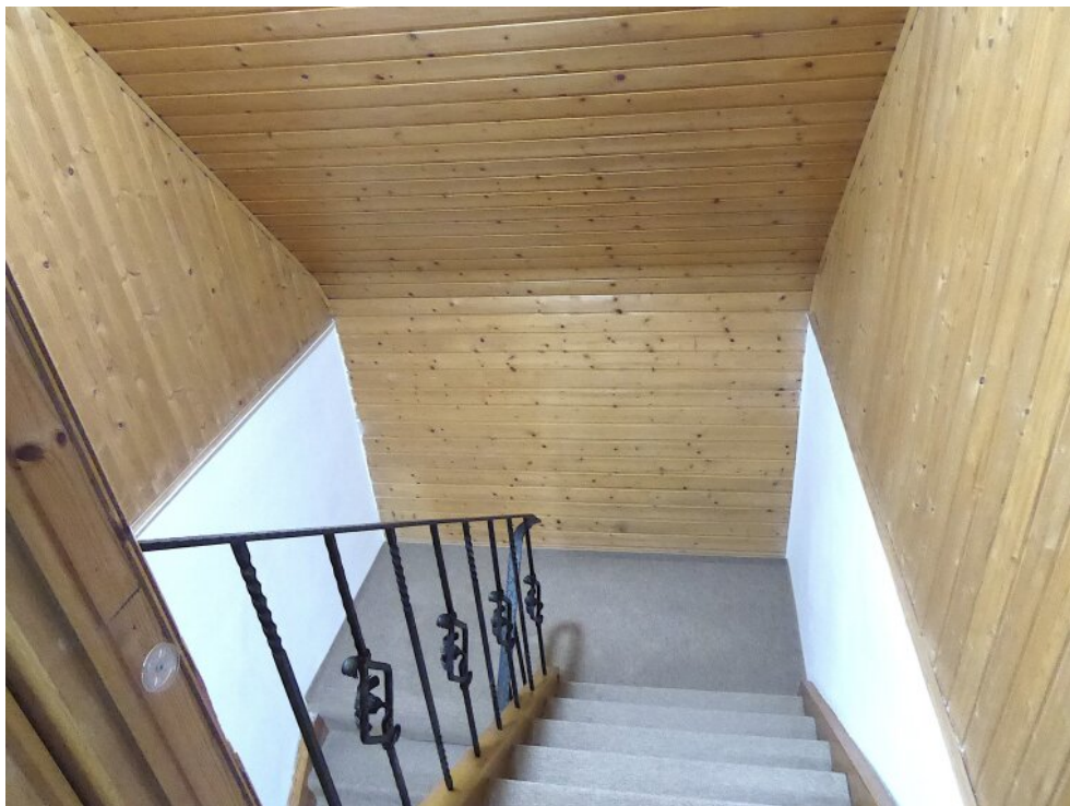
Treppe ins DG