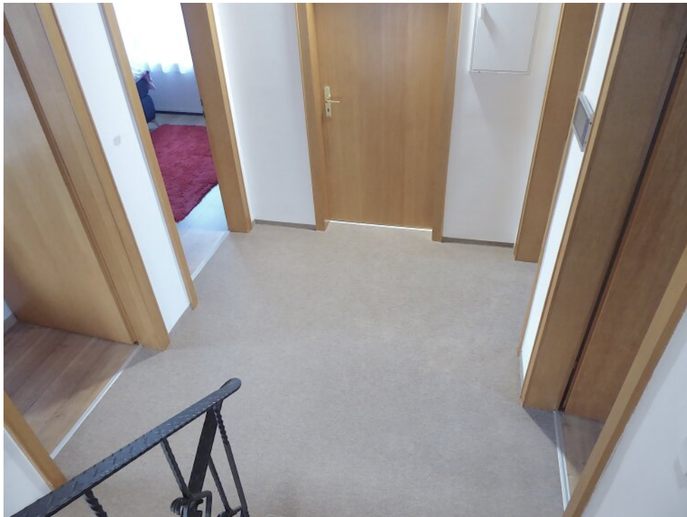
Flur im OG