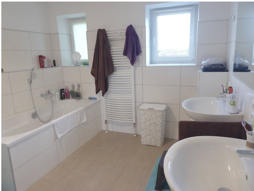
Bad EG mit Wanne