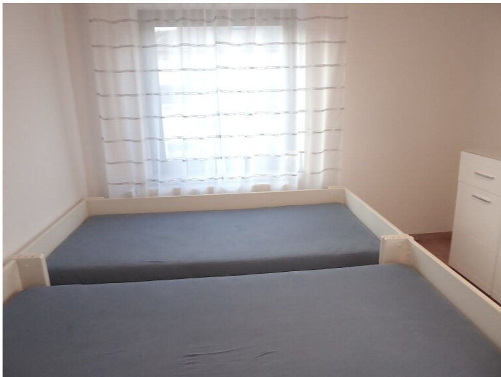
Kinderzimmer III im OG.