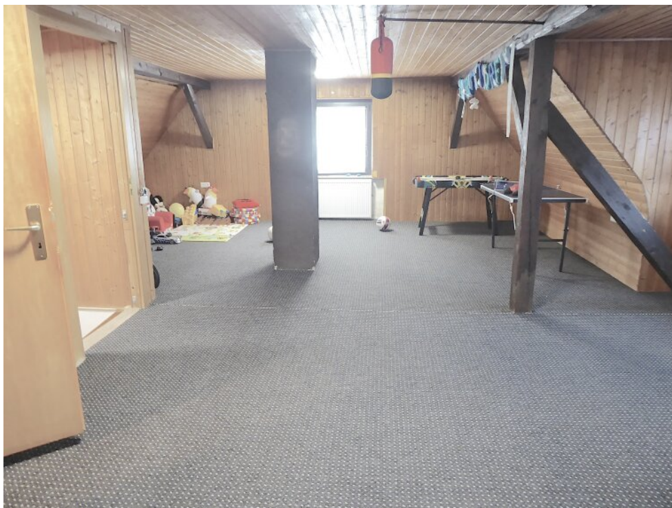
Spiezimmer im DG