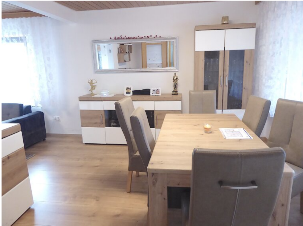
Esszimmer im EG