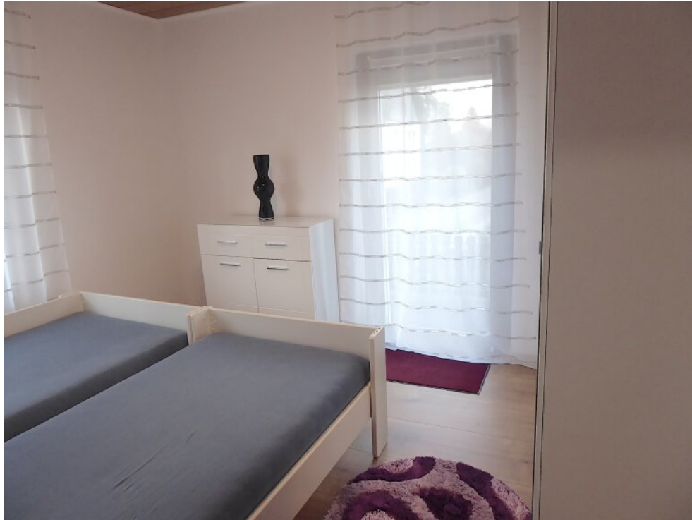
Kinderzimmer III OG