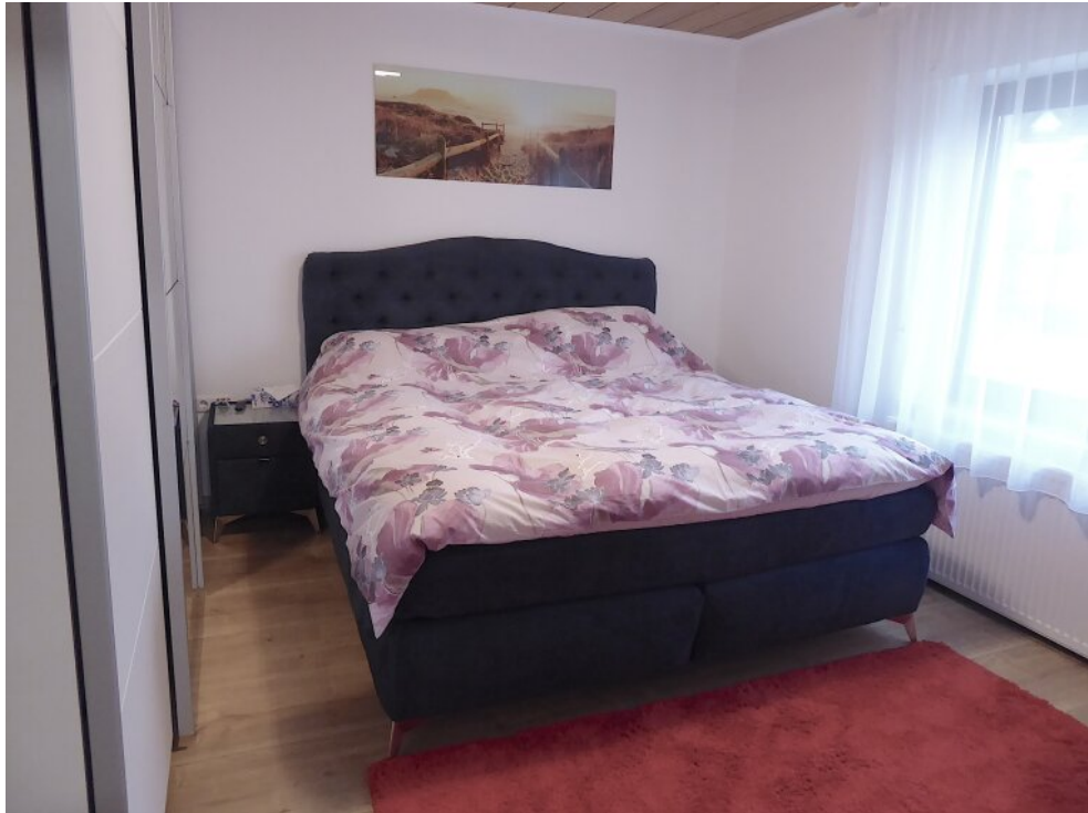
Kinderzimmer II OG