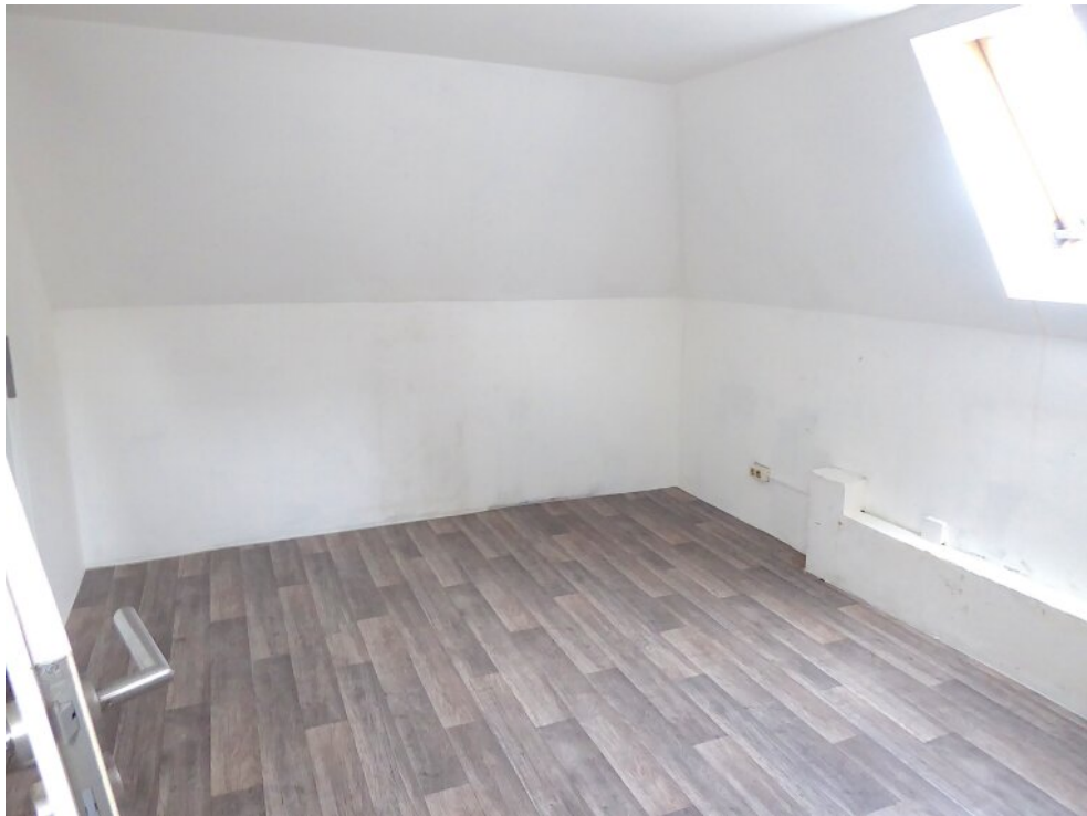
Lagerraum im OG