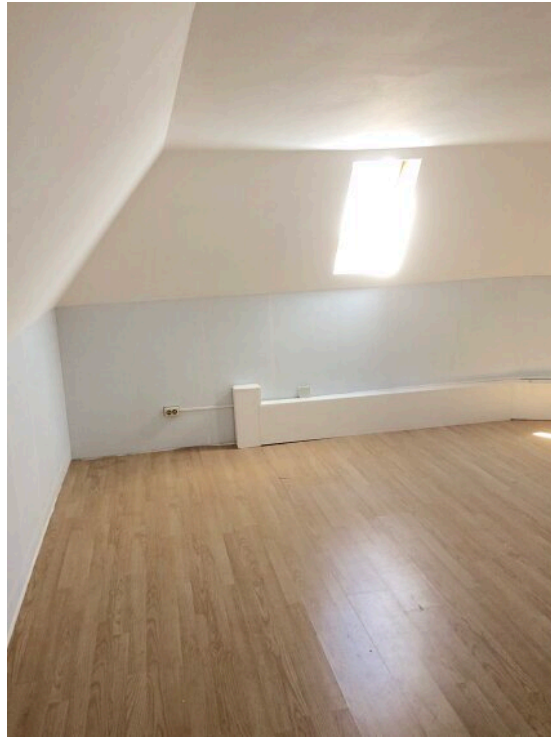
Lagerraum im OG