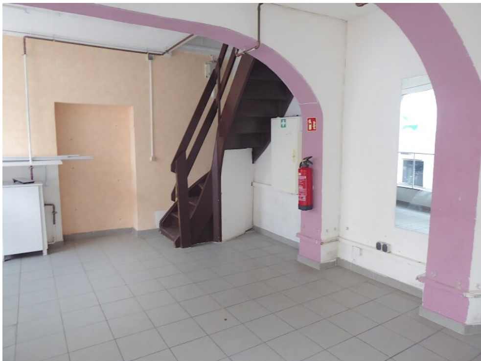
Ladenraum mit Treppe ins OG