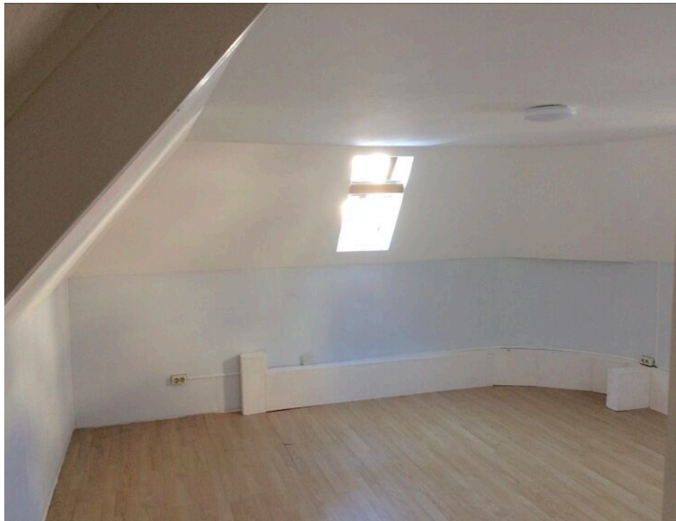
Lagerraum im OG