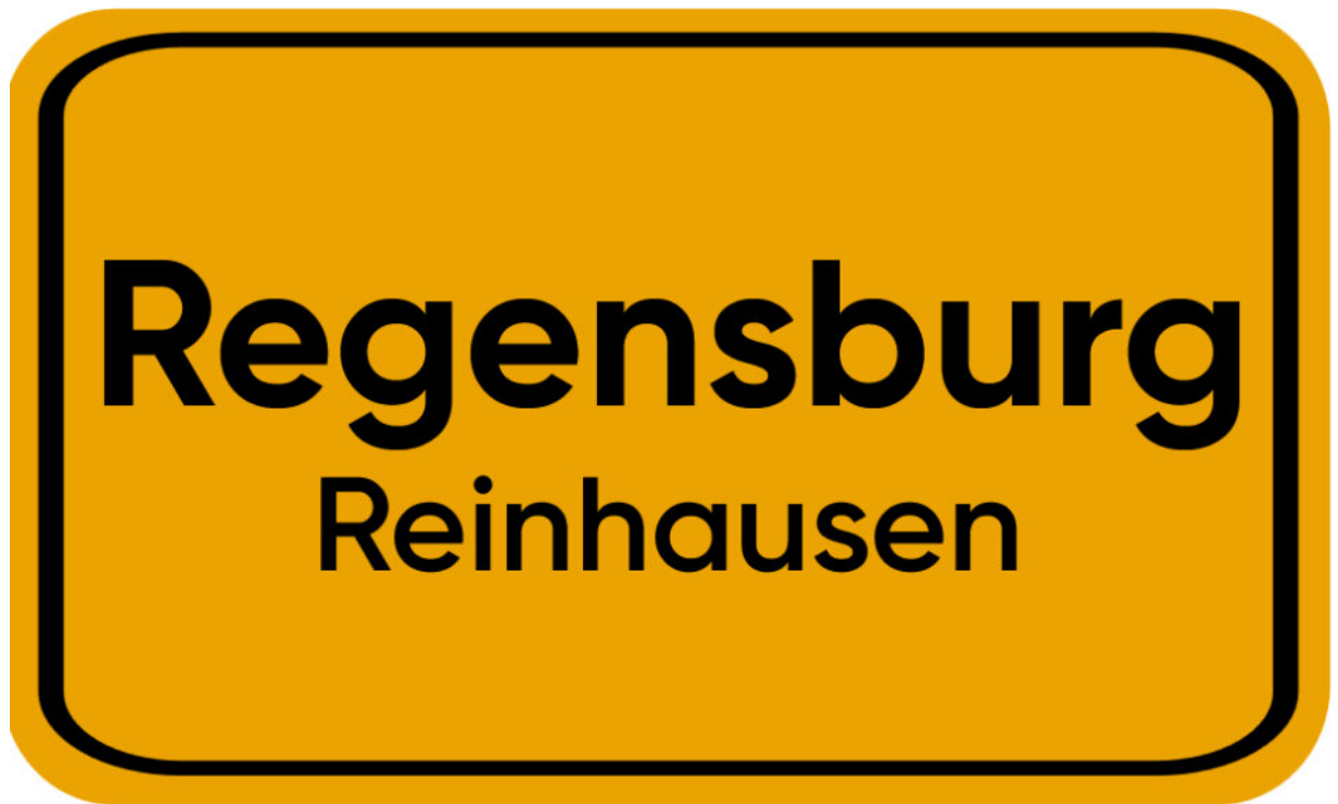
Regensburg - Reinhausen