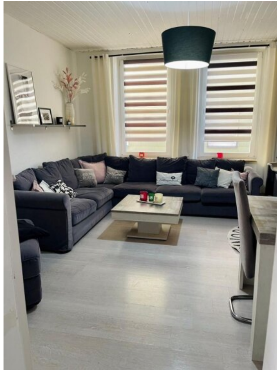
Wohnzimmer 1 OG