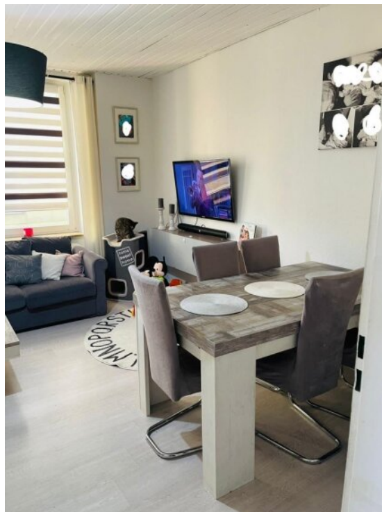
Wohnzimmer 1 OG