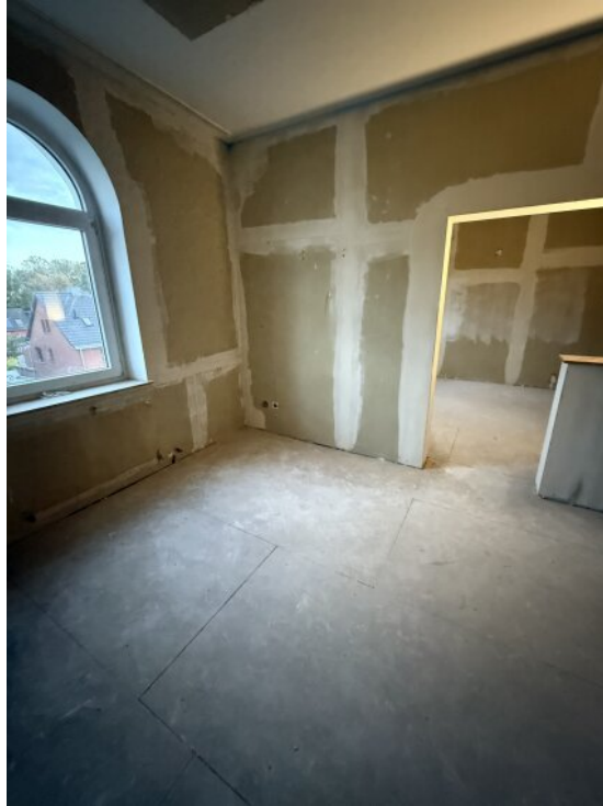
Wohnbereich 2 OG