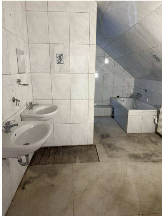
Bad 2 OG