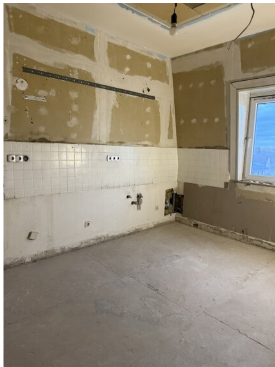
Küche 2 OG