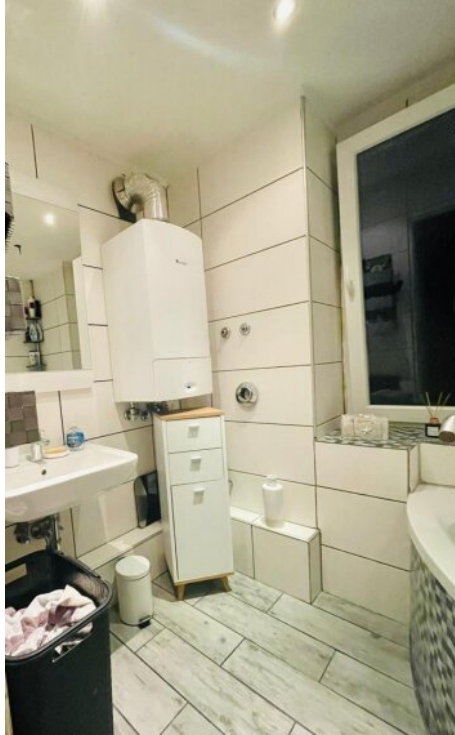
Bad 1 OG