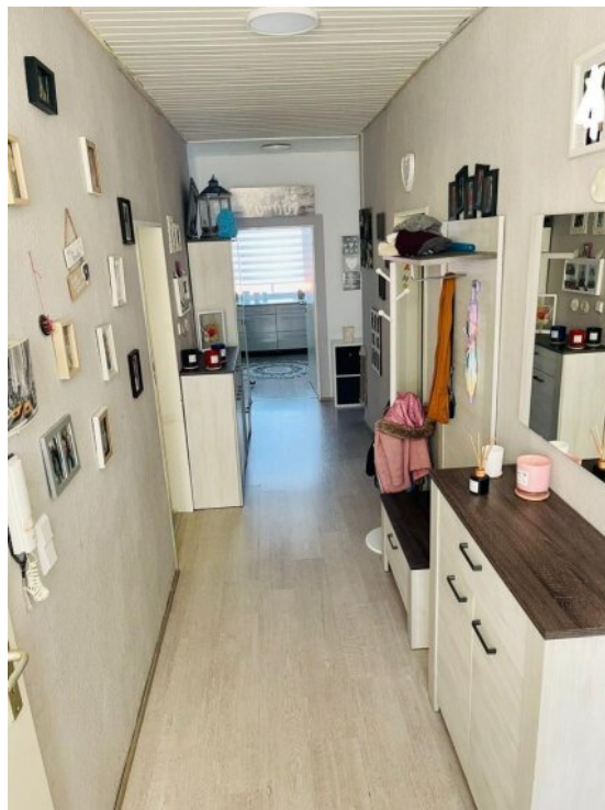
Flur 1 OG