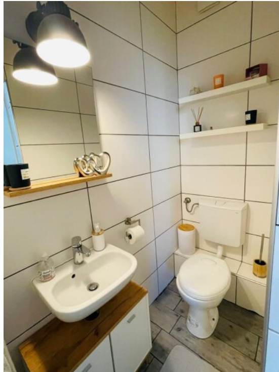
Bad 1 OG