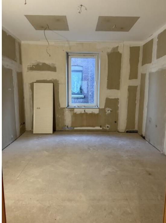
Schlafzimmer 2 OG