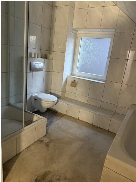
Bad 2 OG