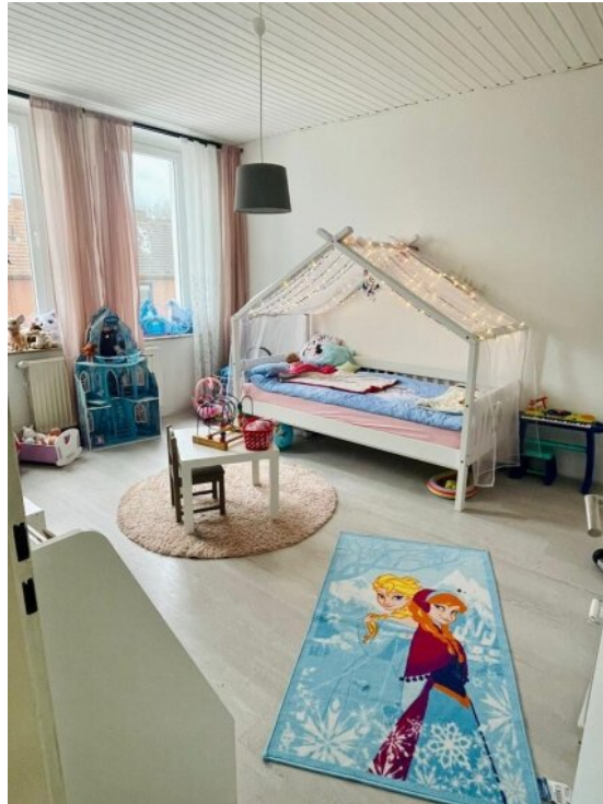
Schlafzimmer 1 OG