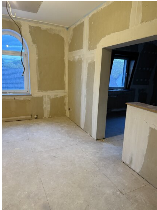
Wohnzimmer 2 OG