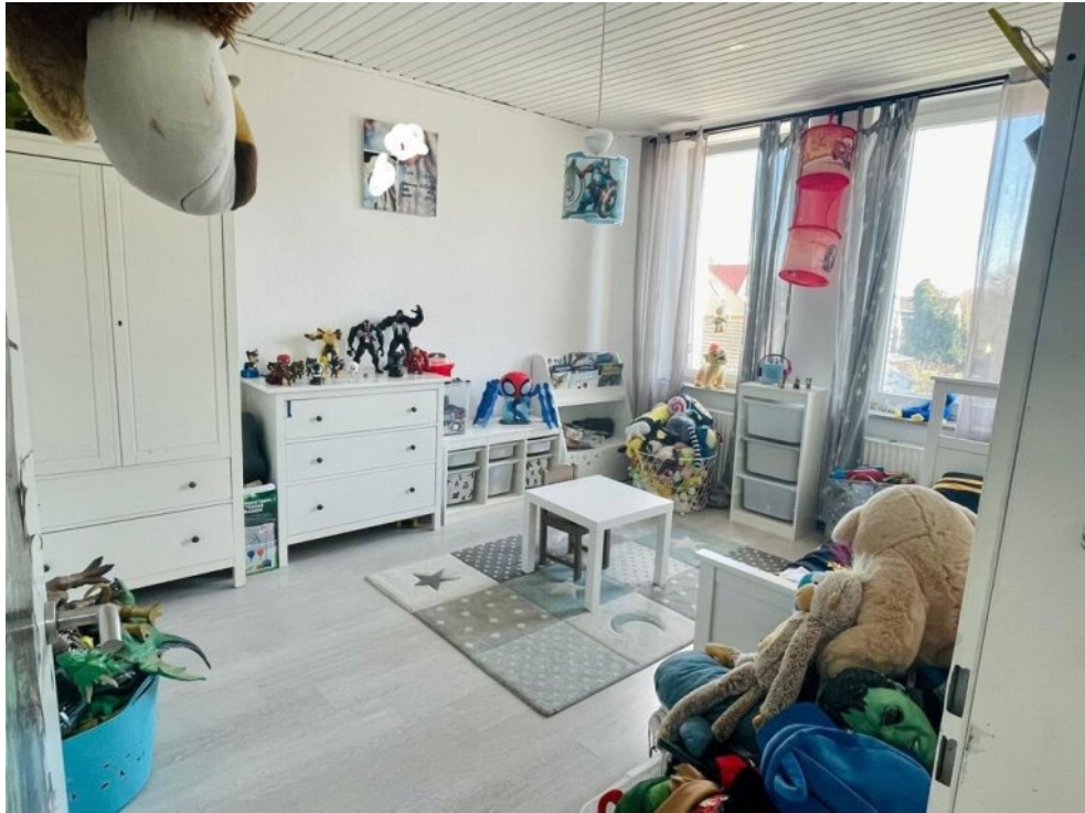
Schlafzimmer 1 OG