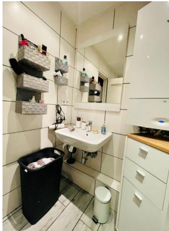
Bad 1 OG