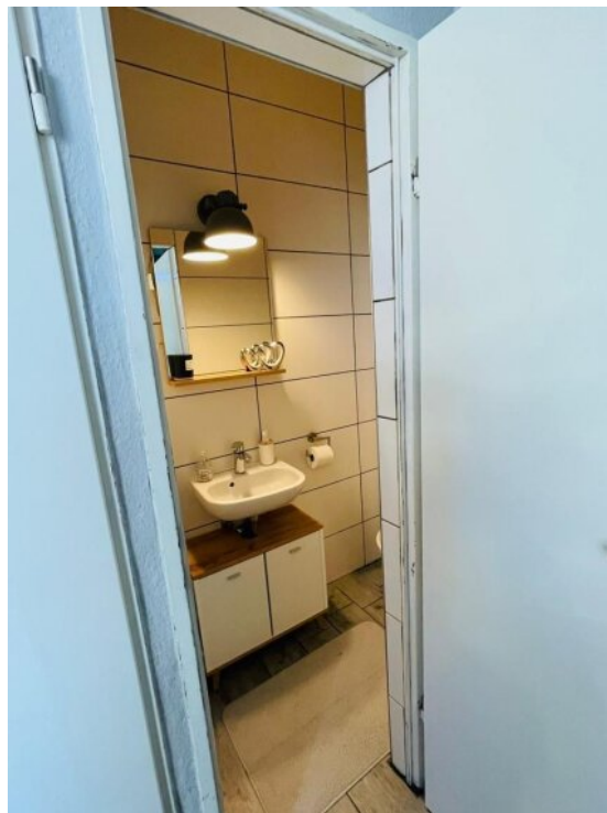
Bad 1 OG