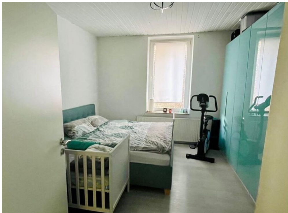
Schlafzimmer 1 OG