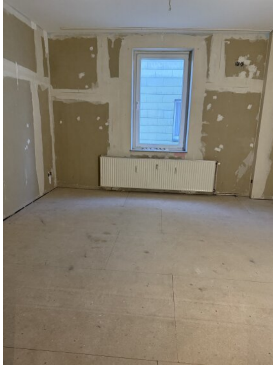
Schlafzimmer 2 OG