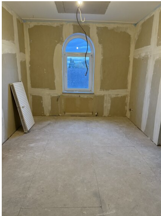
Schlafzimmer 2 OG