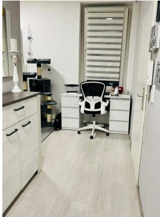
Schlafzimmer 1 OG