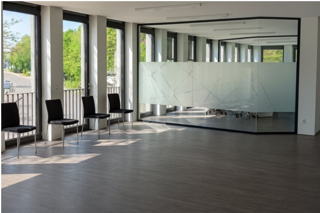
Moderne Bürogestaltung bei Tageslicht