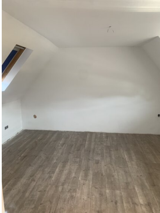
1 Stock Wohnzimmer