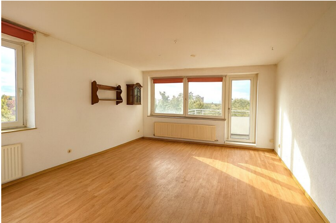
Lebensraum mit großem Balkon