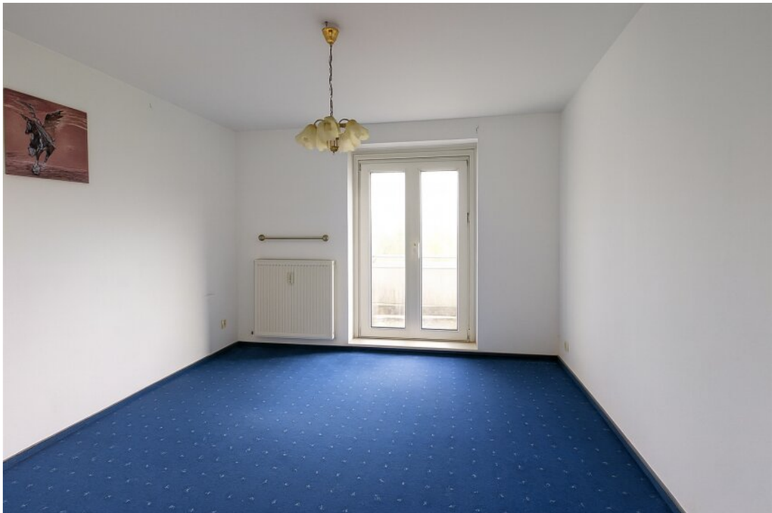
Zimmer 2 mit kleinem Balkon