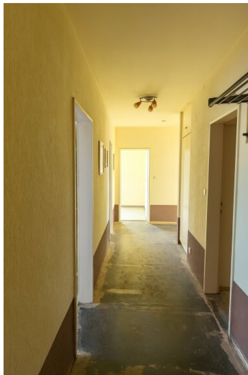
Flur in Richtung Küche