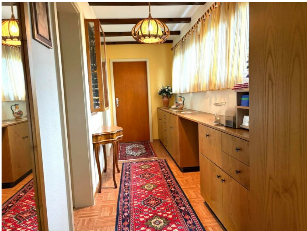
Flur zu den Schlafräumen