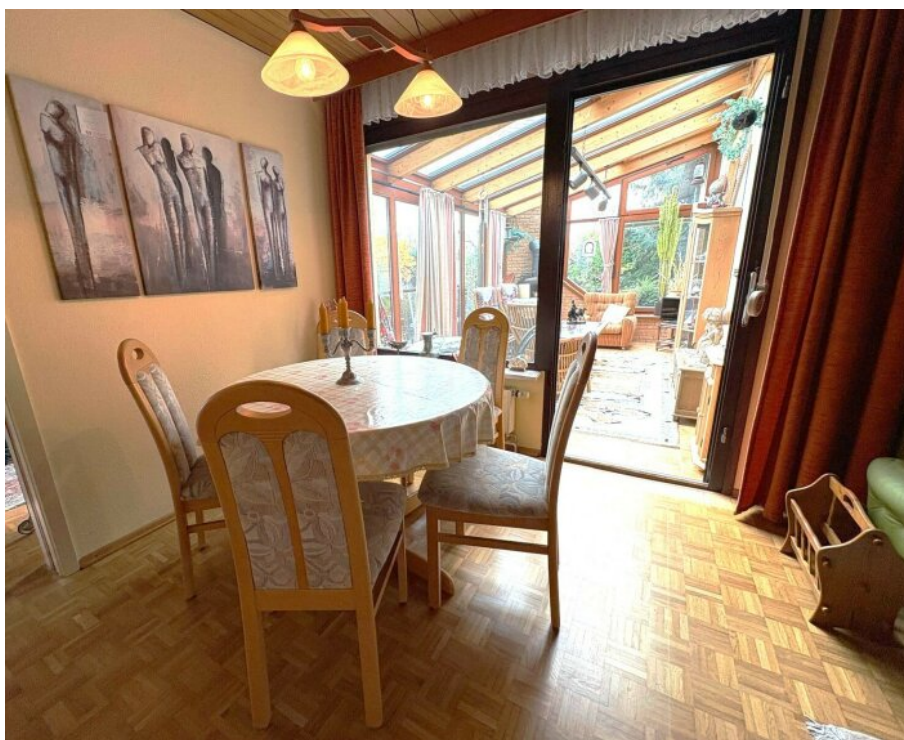
Esszimmer mit Wintergarten