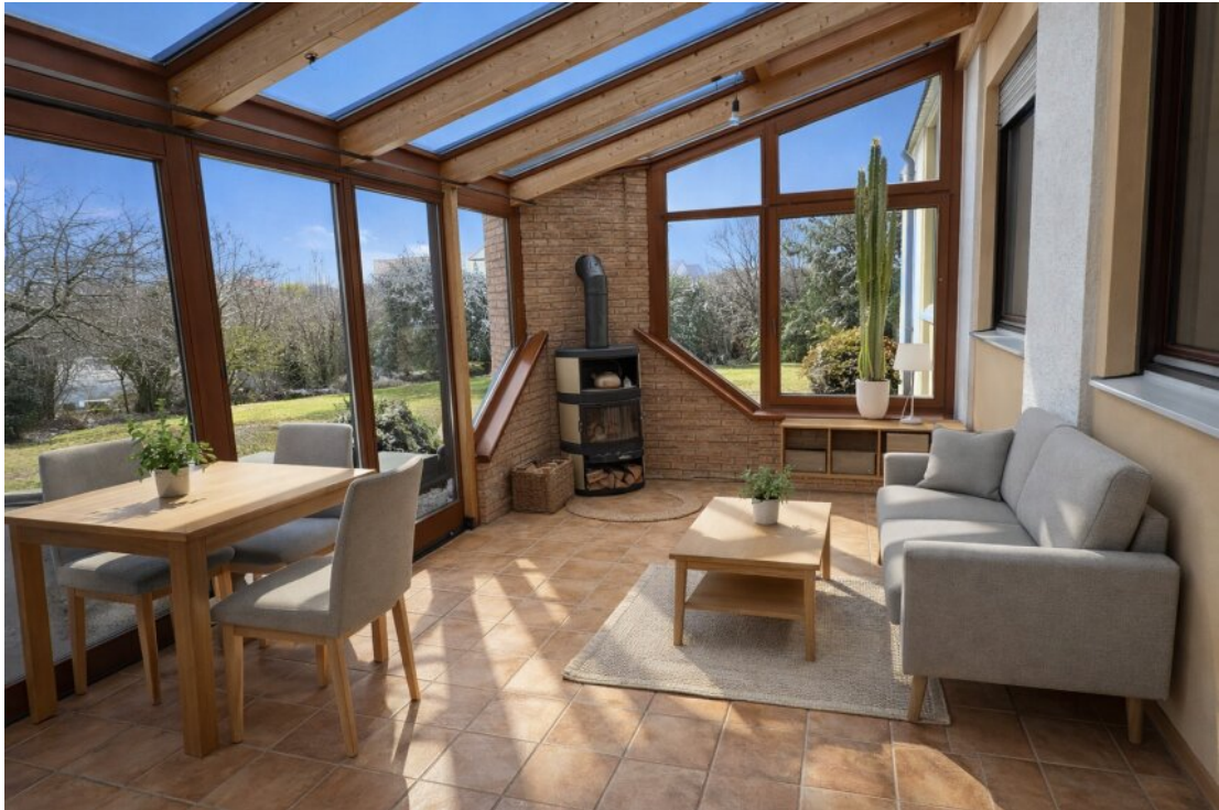
Wintergarten neu möbliert