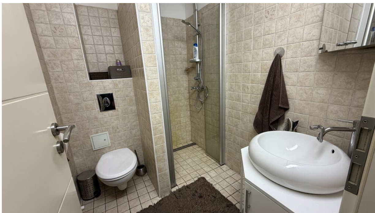
Bad : WC 1