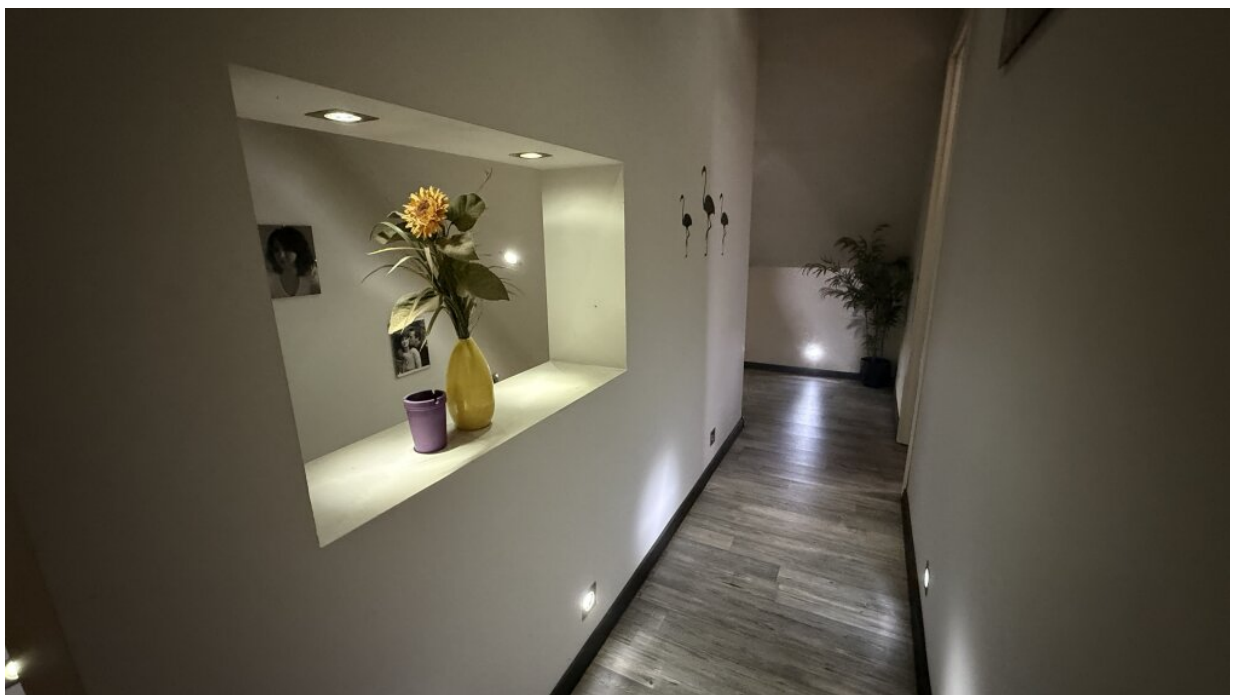
Diele 1. OG