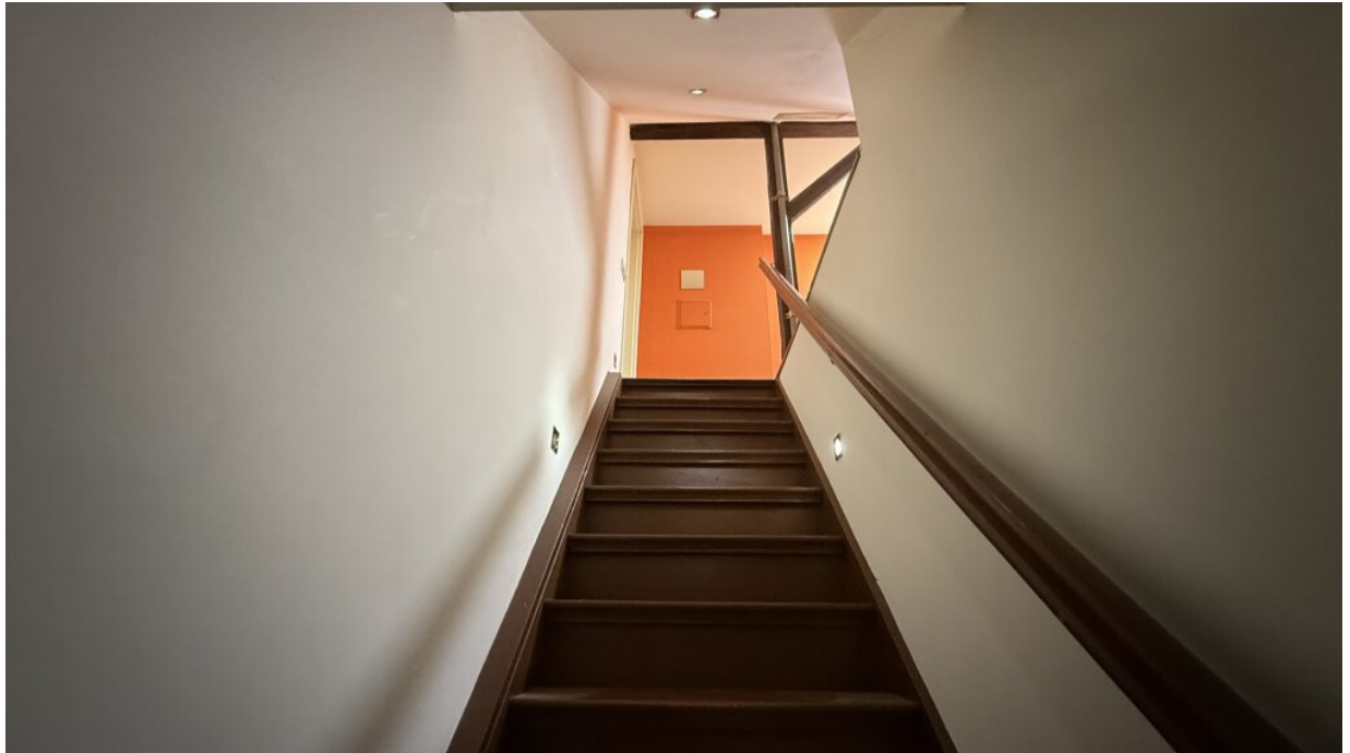
Aufgang zum 2. OG