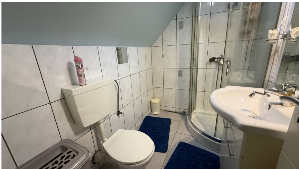
Bad : WC 2