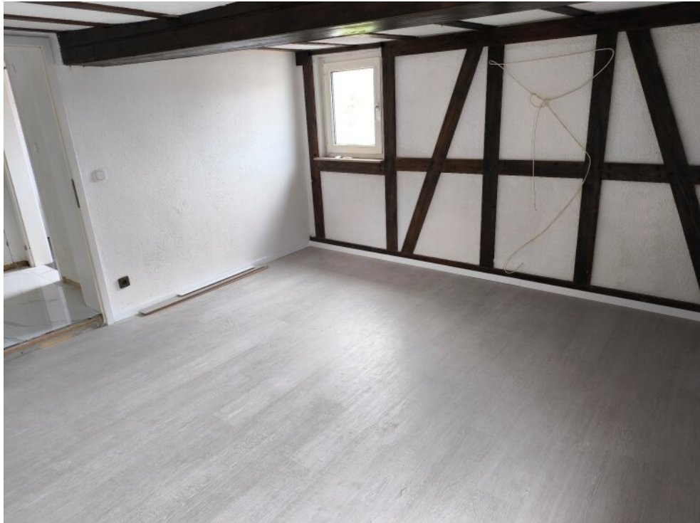
Wohn- Schlafzimmer Dachgeschoß