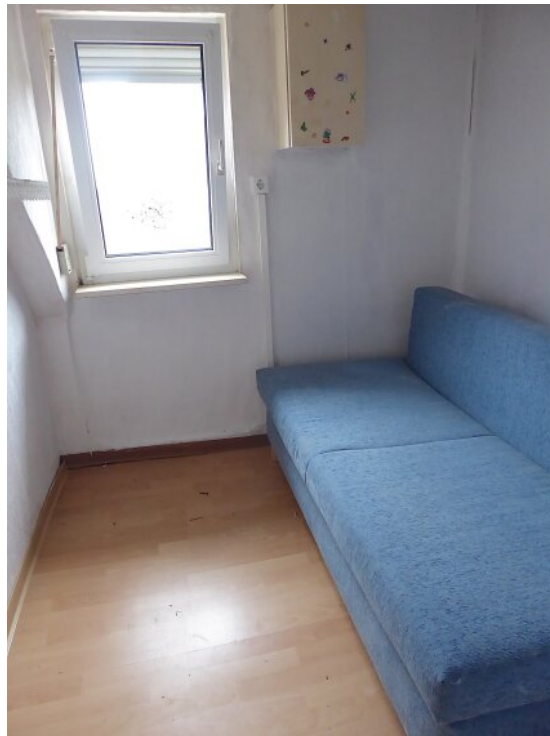
Zimmer hinter Durchgangszimmer