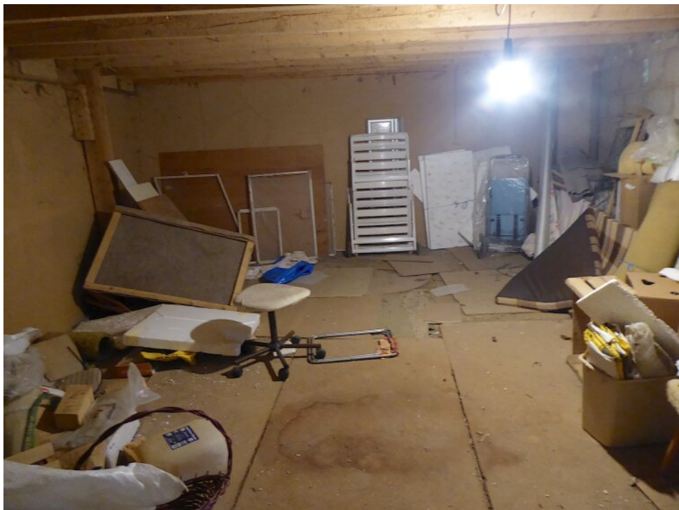
Obergeschoss Scheune rechts