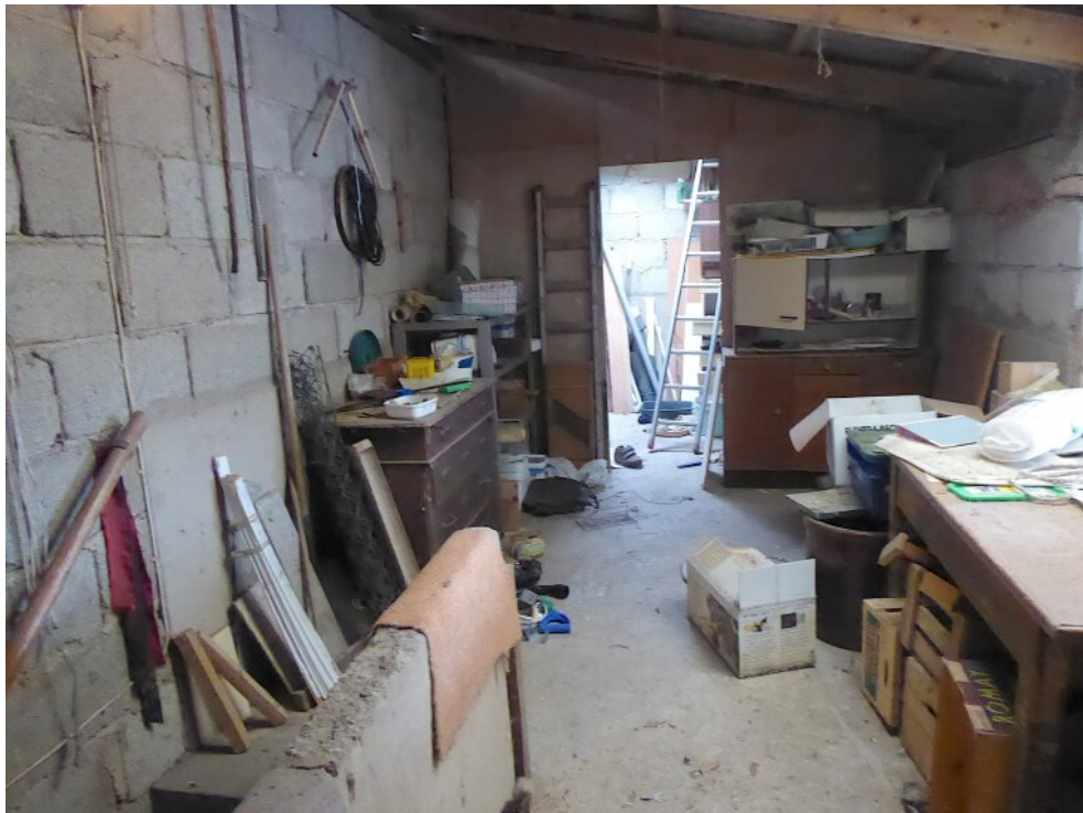
Scheune rechts OG