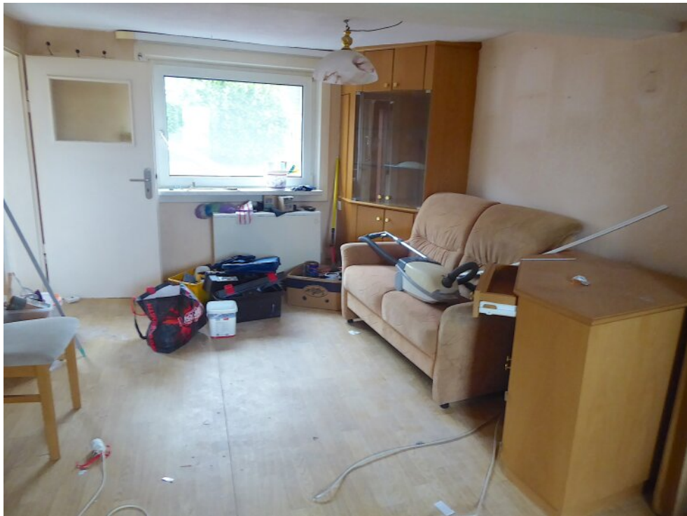
Wohnzimmer im EG