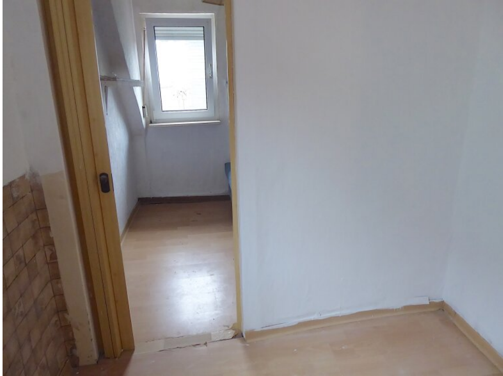
Durchgangszimmer mit Zimmer dahinter OG