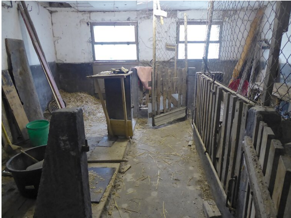
Stall in rechter Scheune