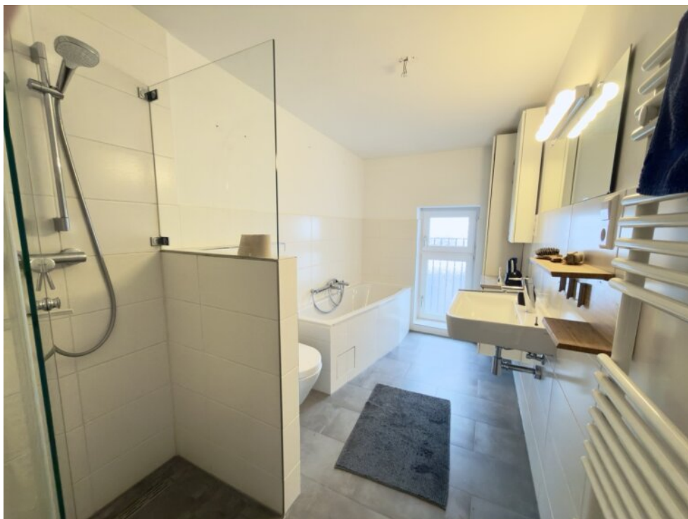
Bad mit Dusche und Wanne