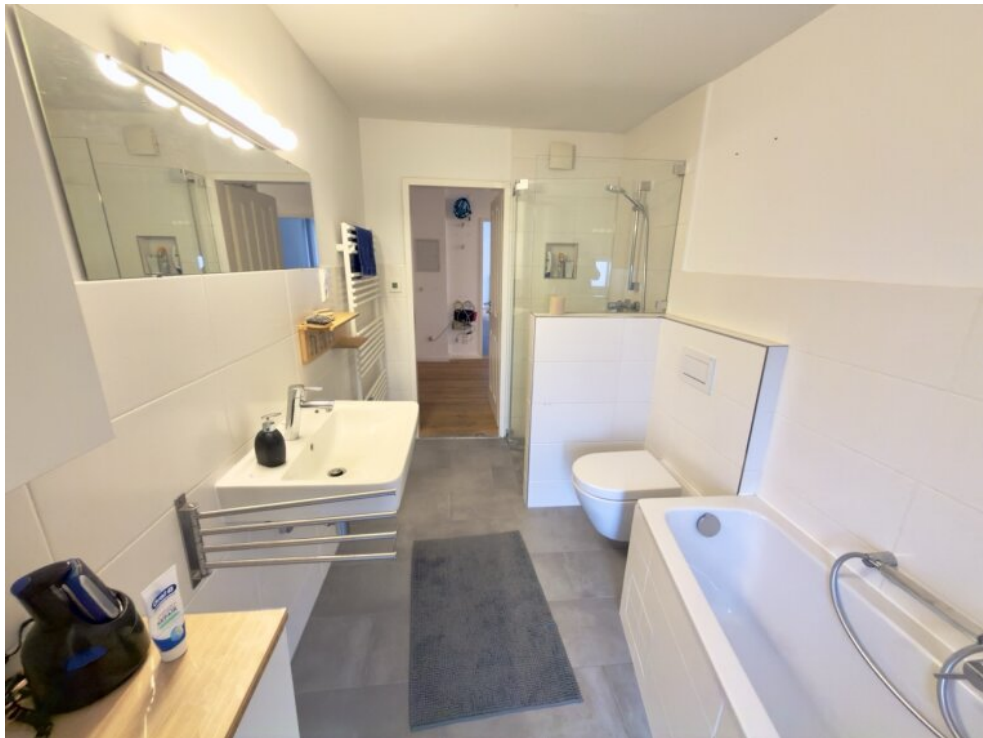
Bad mit Dusche und Wanne