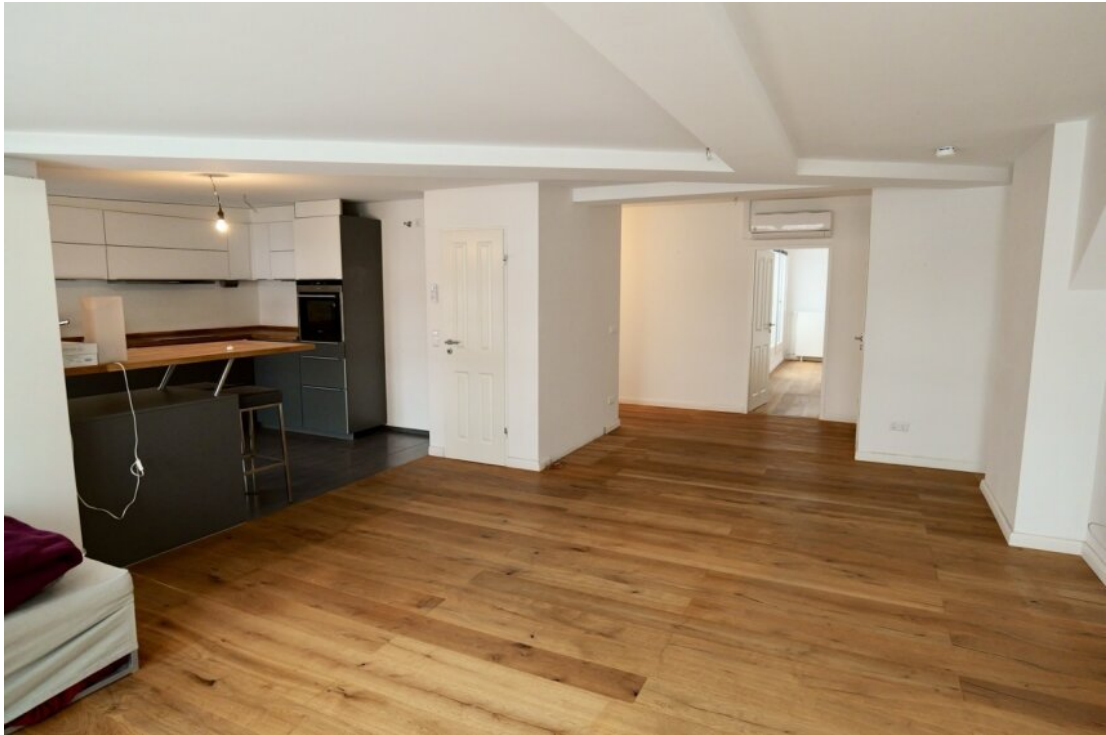
Die geräumige Wohnküche