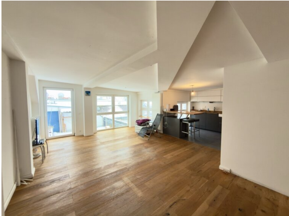
Die geräumige Wohnküche