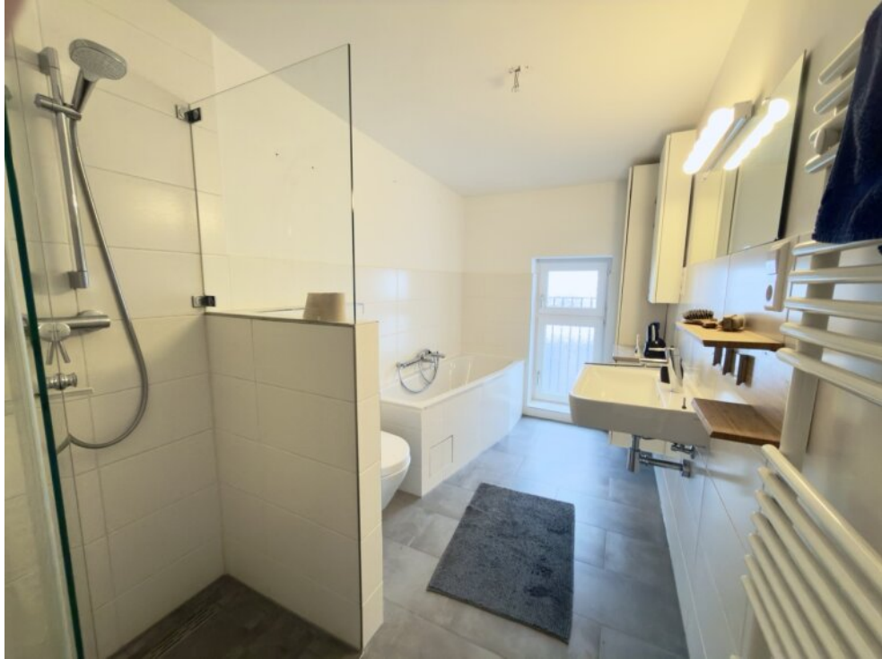
Bad mit Dusche und Wanne