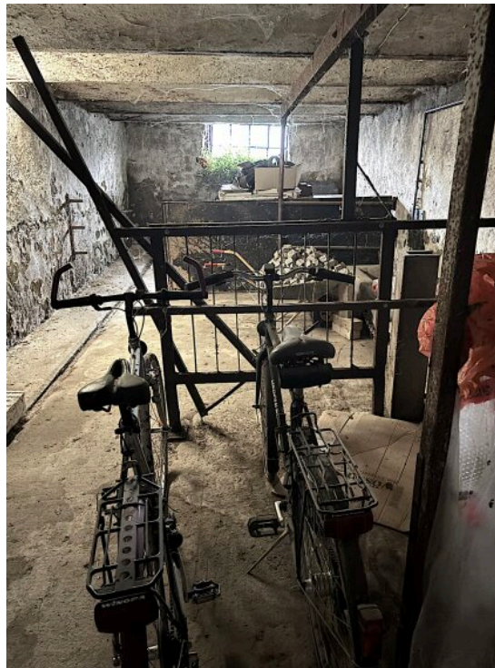
Raum in der Scheune