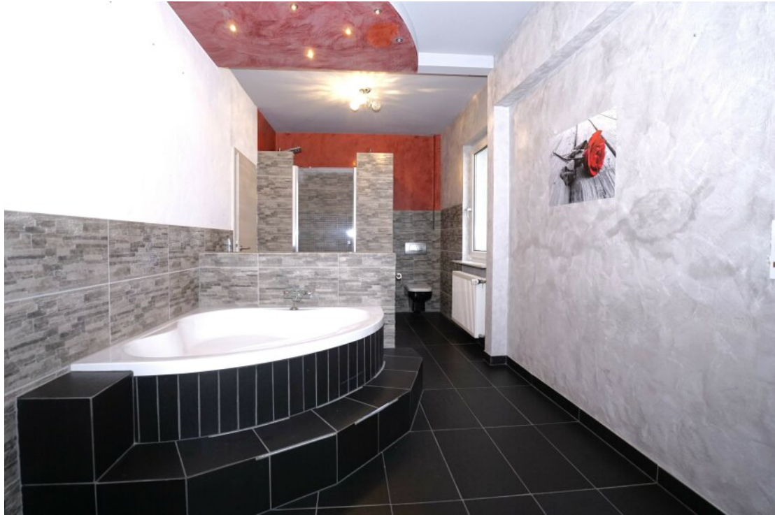
OG Bad mit BW + DU