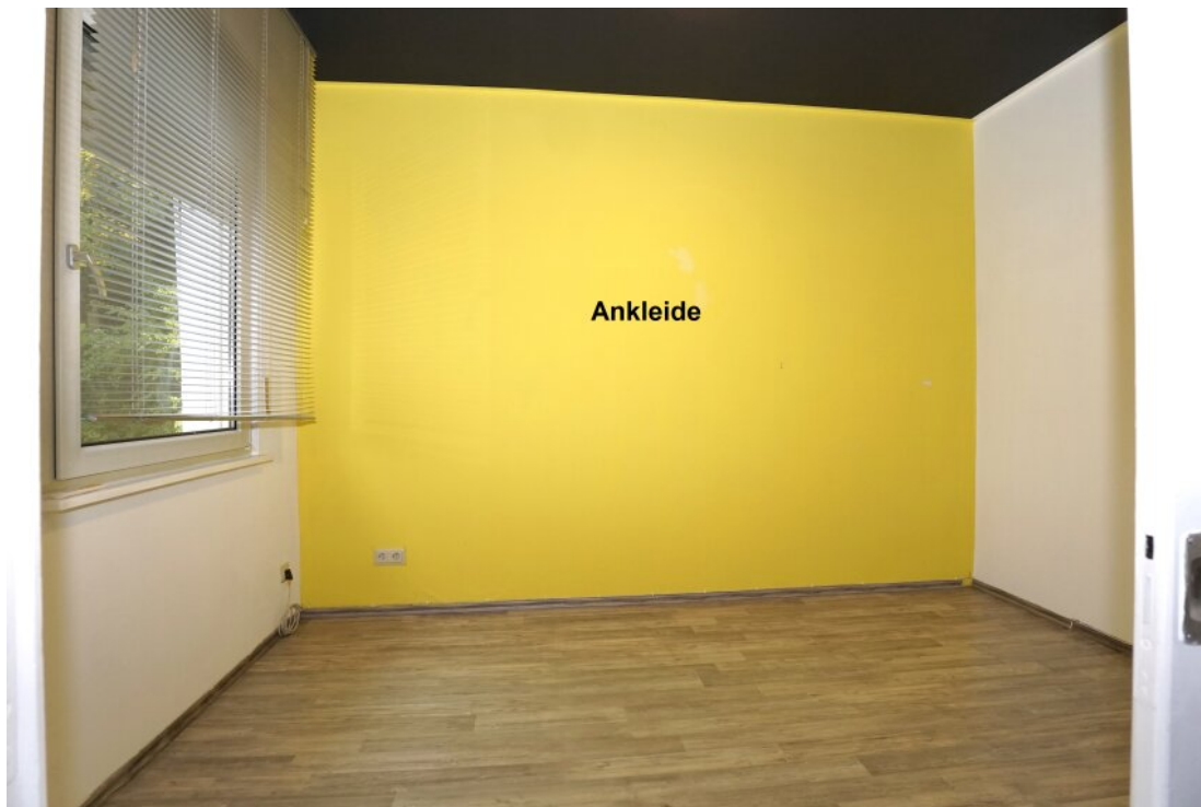
OG Schlafzimmer mit Ankleide und Balkon