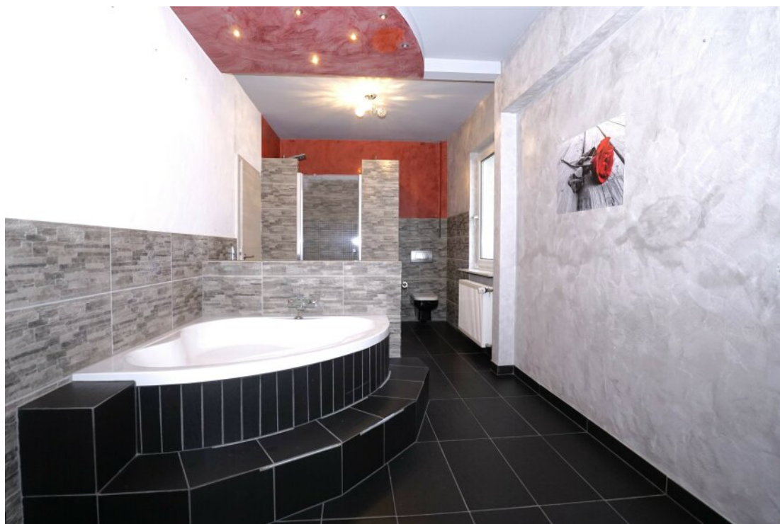
OG Bad mit BW + DU