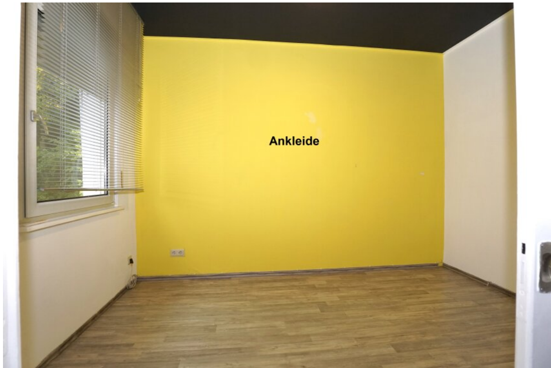
OG Schlafzimmer mit Ankleide und Balkon