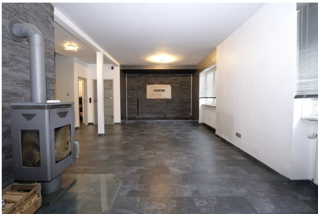
Wohnbereich mit EBK