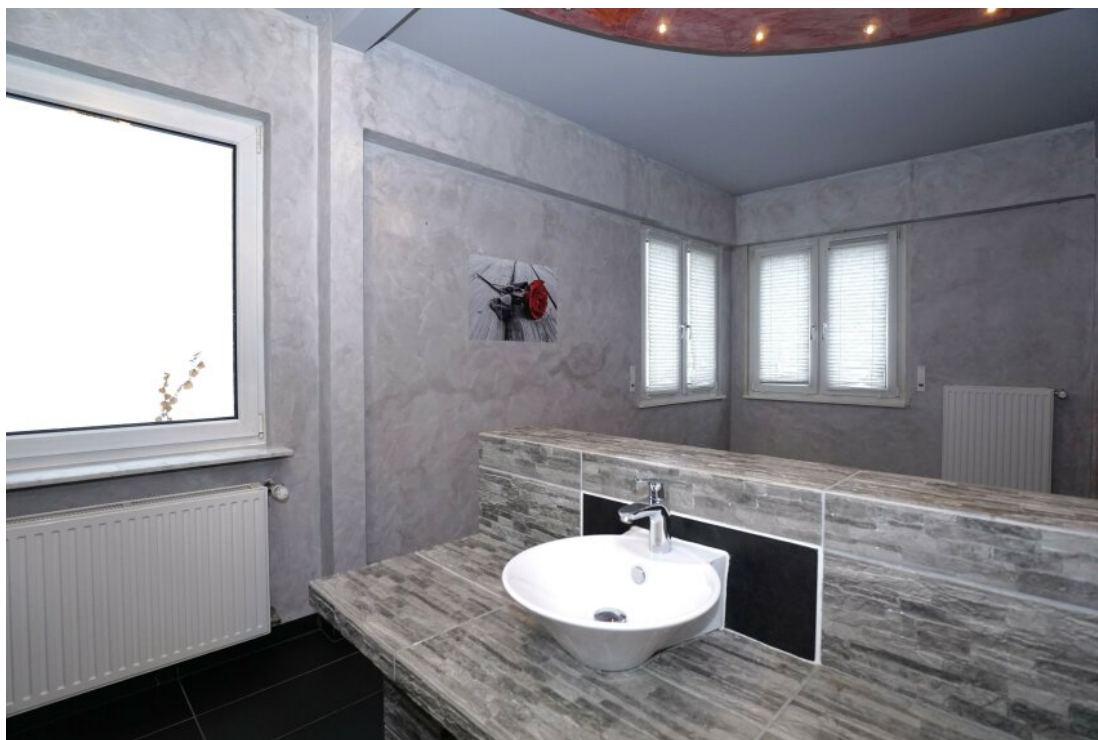
OG Bad mit BW + DU