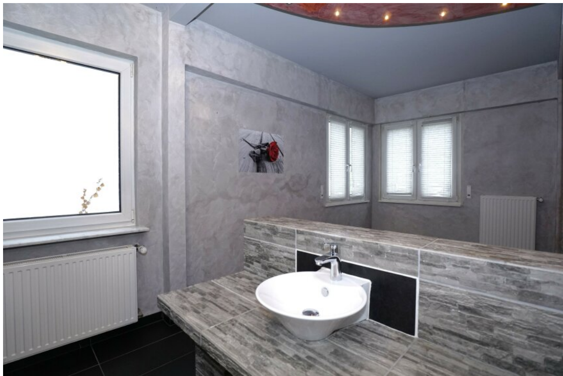
OG Bad mit BW + DU