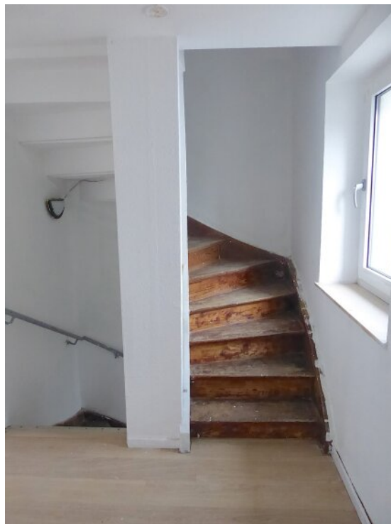
Flur mit Treppe OG