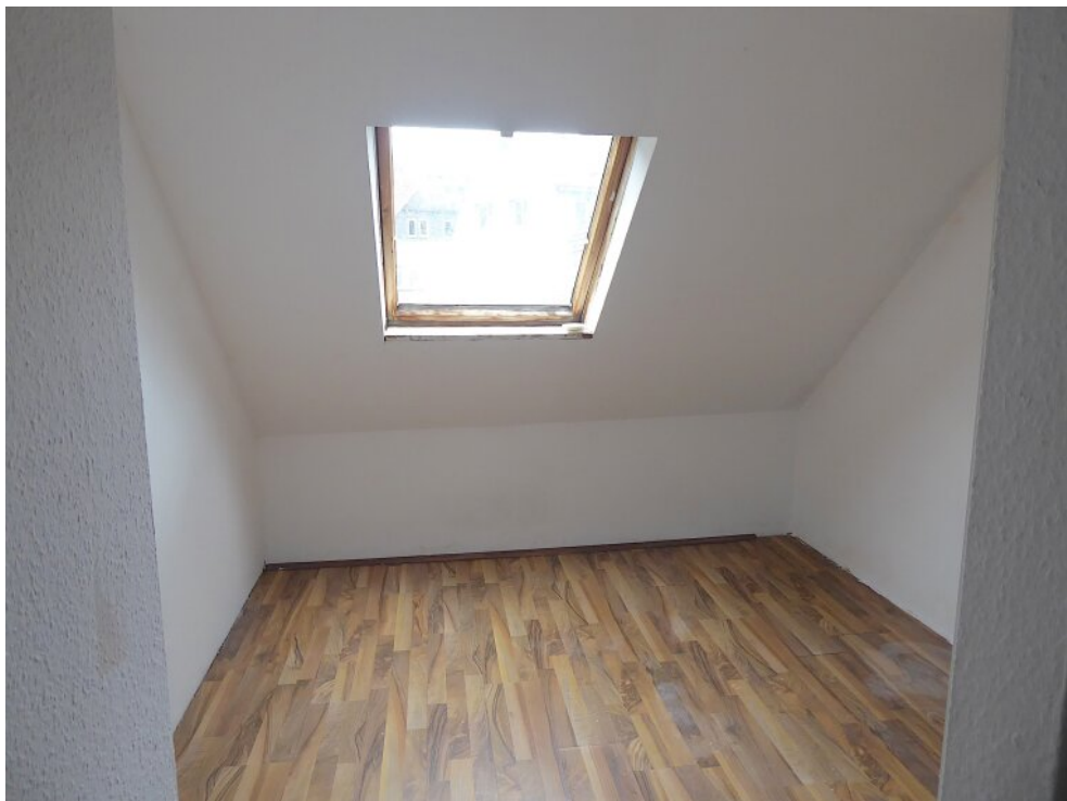
Schlafzimmer II DG