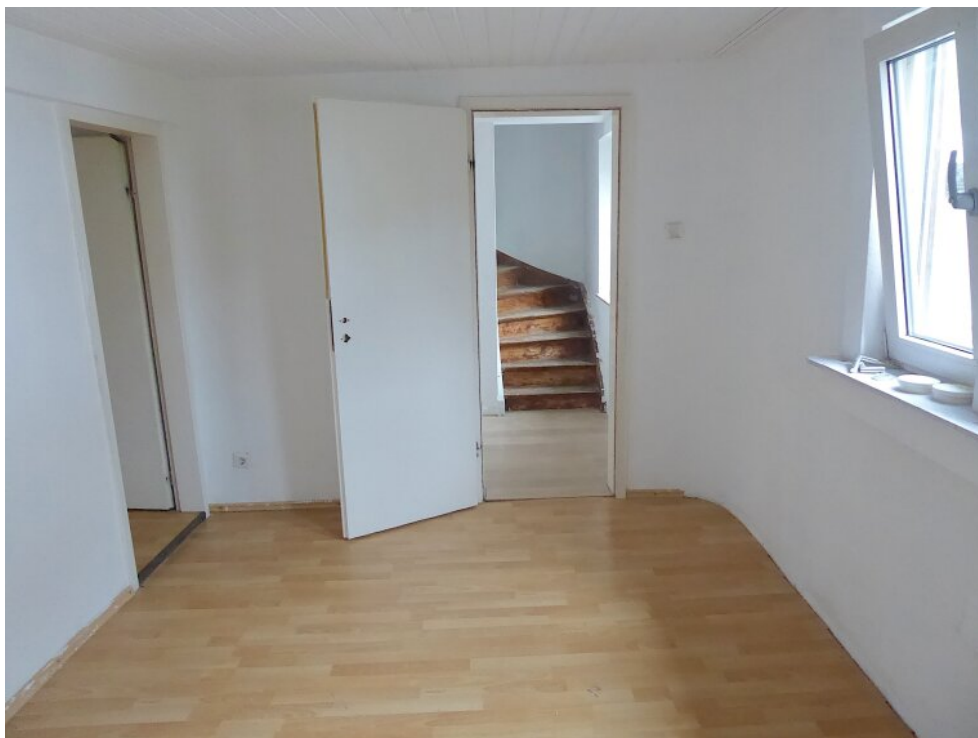
Durchgangszimmer im OG