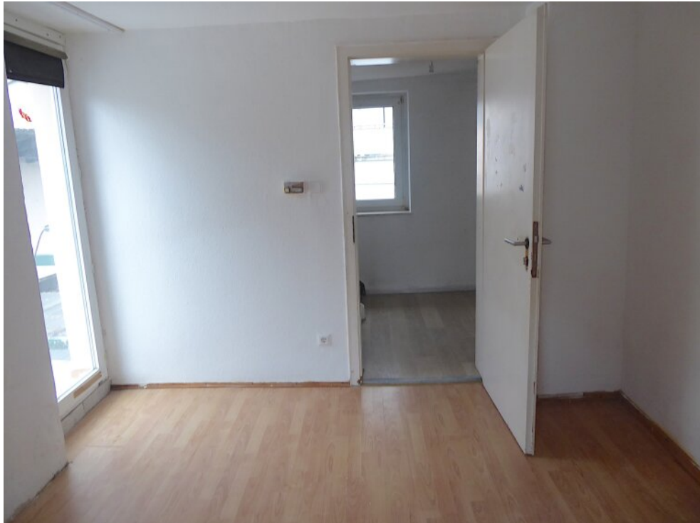
Schlafzimmer III OG mit Zugang Balkon