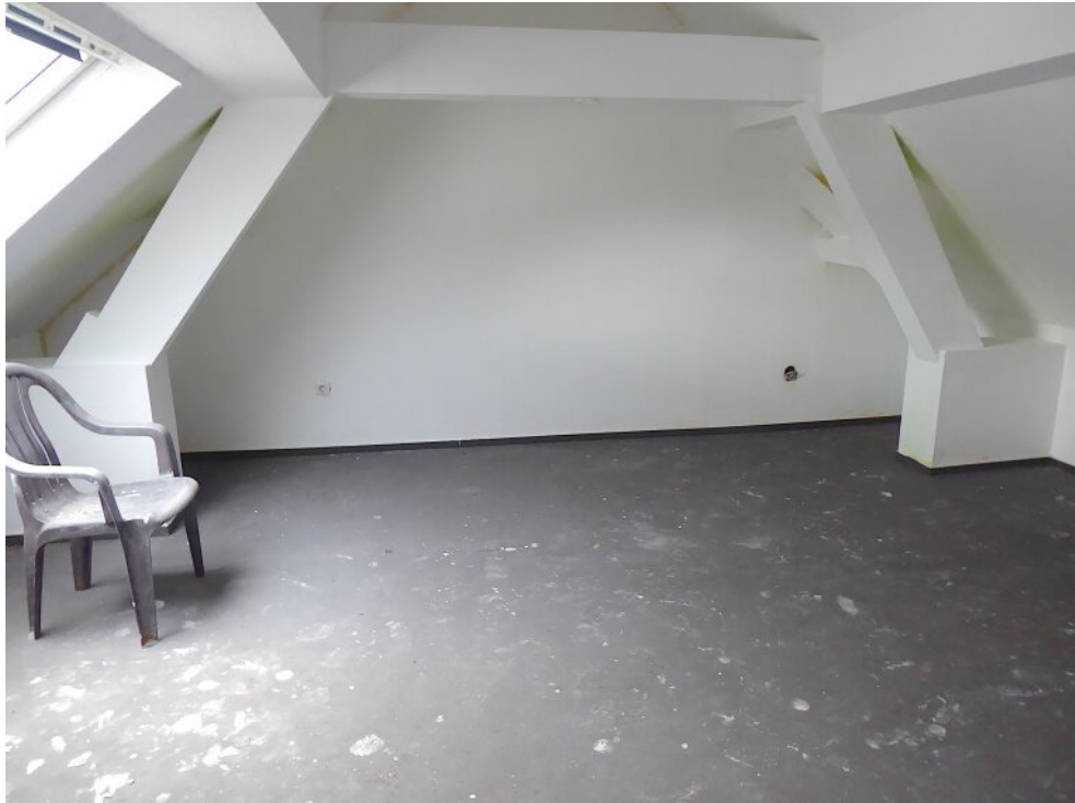
Schlafzimmer I im DG