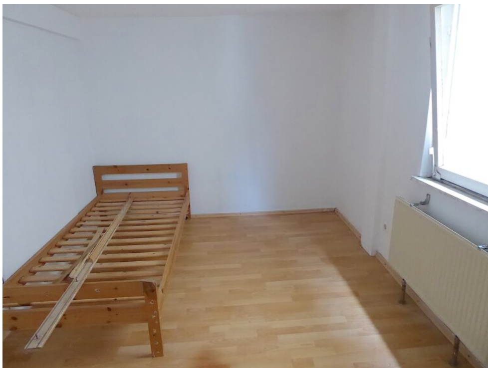
Schlafzimmer hinter Durchgangszimmer OG