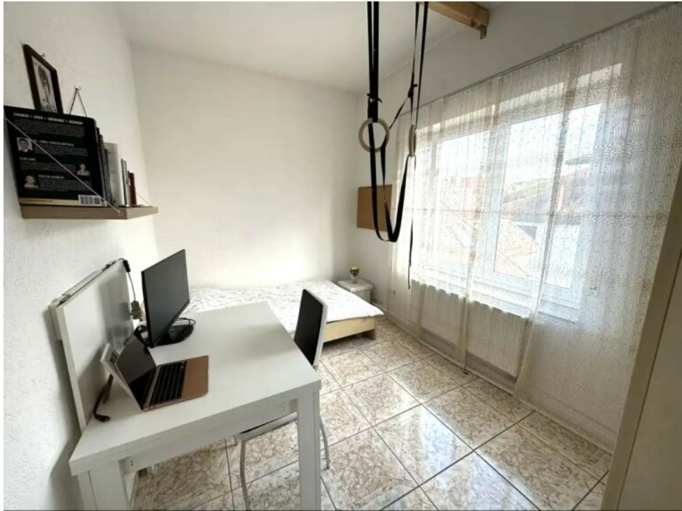
Kinderzimmer - Büro