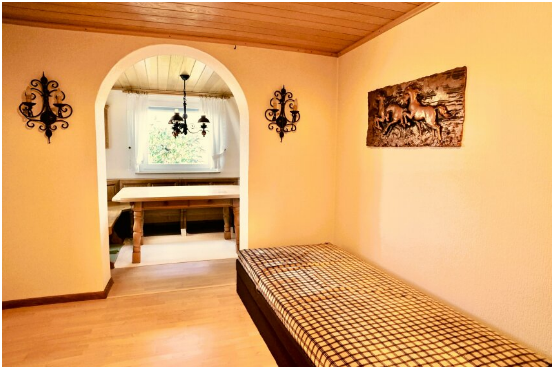
Großzügiger Bereich im Kellergeschoss