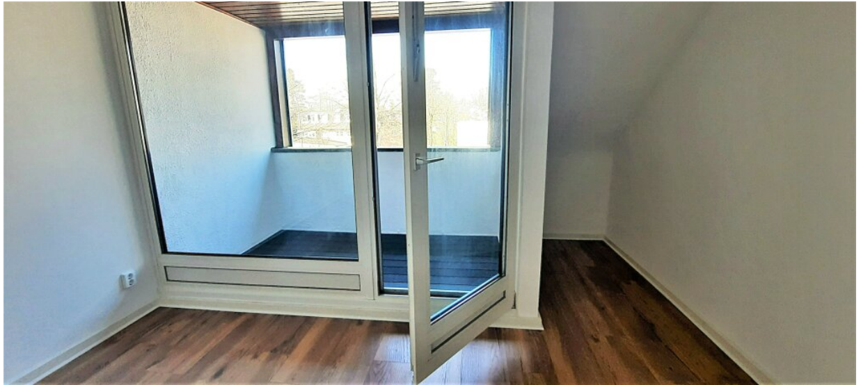
Zimmer 1 mit Loggia