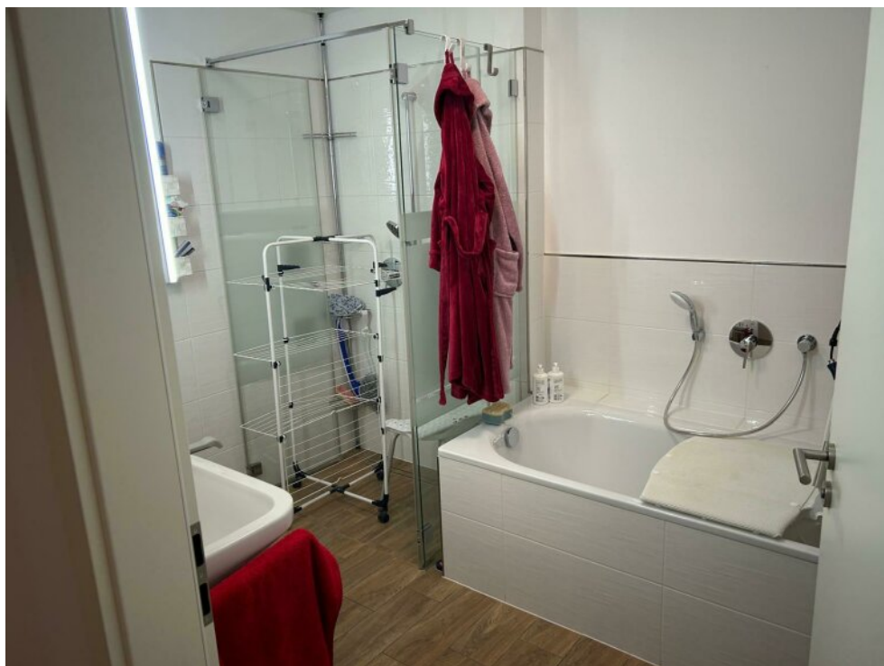
Bad mit Wanne und Dusche