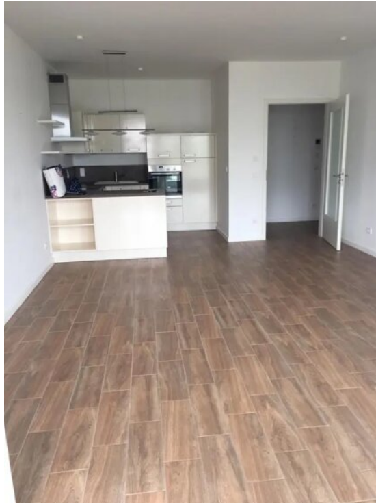
Wohnung im geräumten Zustand