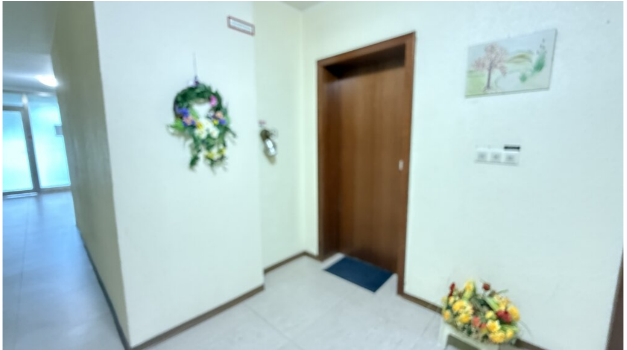
Hausflur - Eingangstür