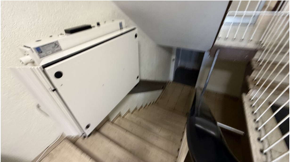
Hausflur - zum Keller