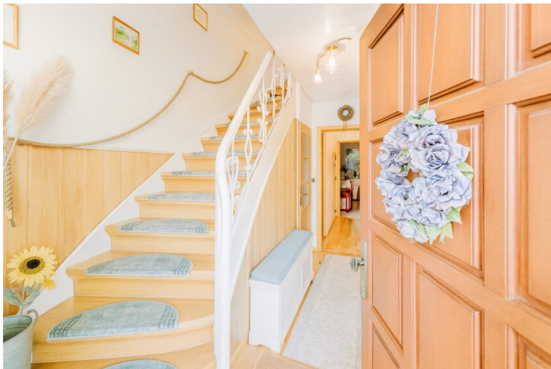
mit KI aufgehell