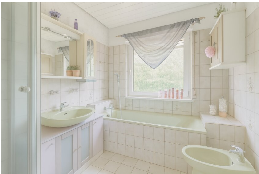
mit KI aufgeräumt