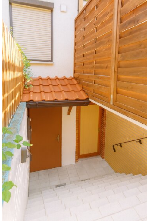
mit KI verschönert