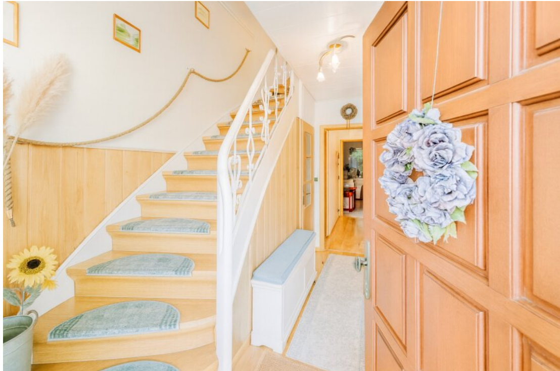
mit KI aufgehell