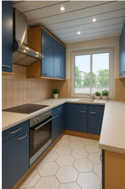
mit KI aufgeräumt