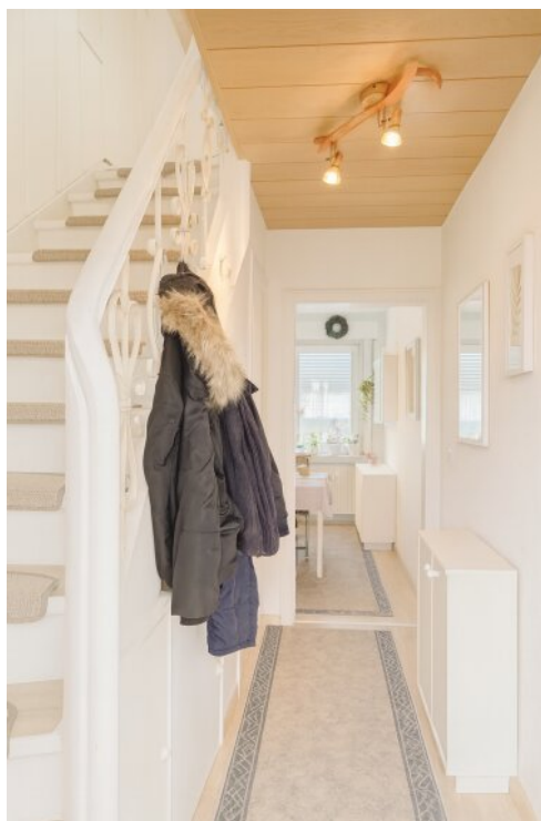
mit KI aufgehell