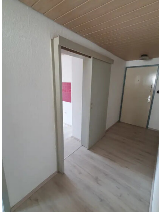
Flur - Kücheneingang