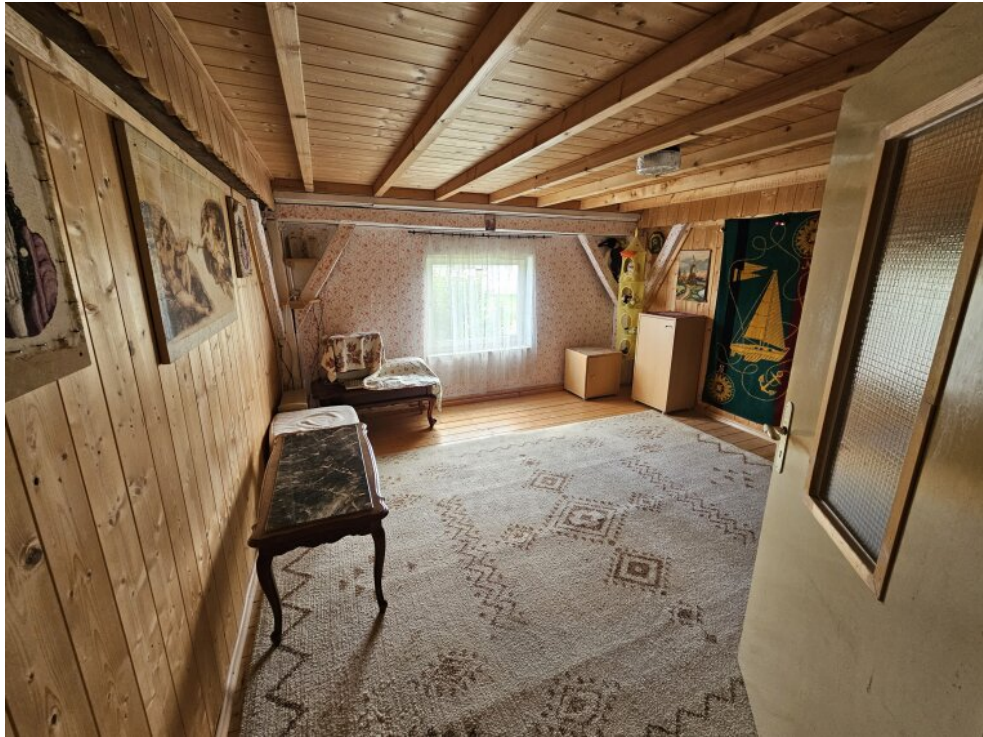
Dachgeschoß / Büro