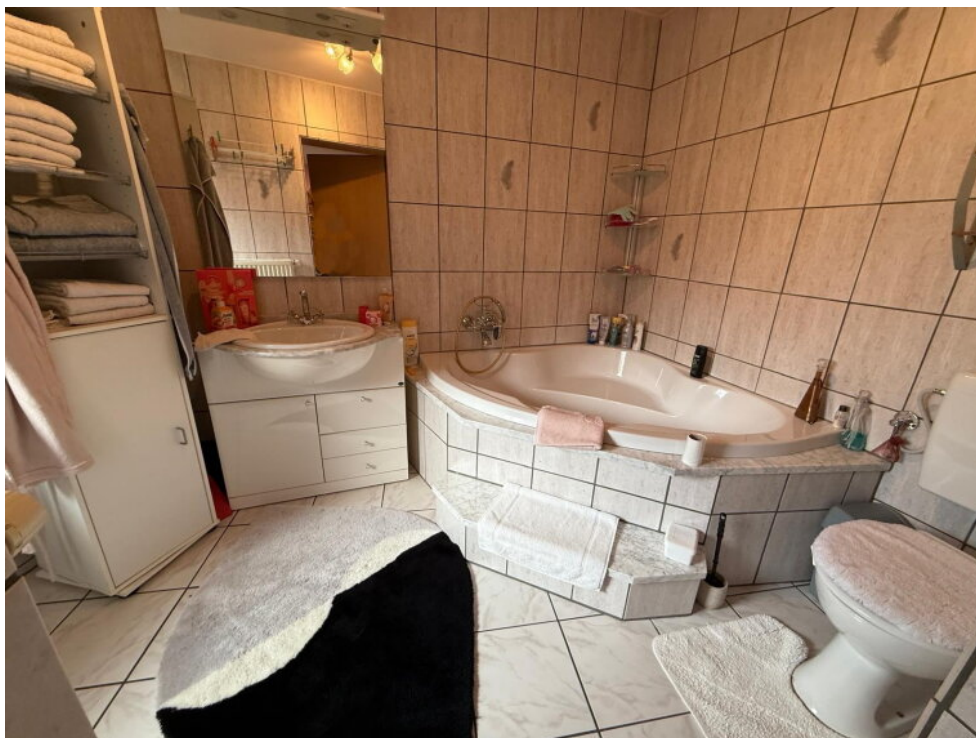
Tageslichtbad mit Wanne I.OG