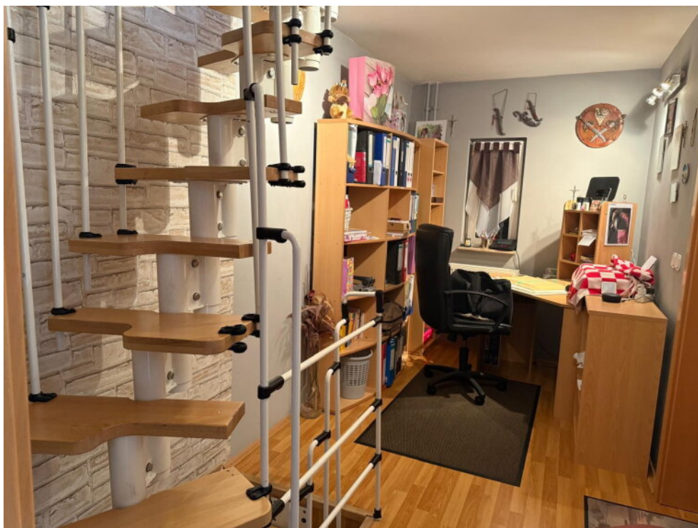
Büroecke im 1.OG