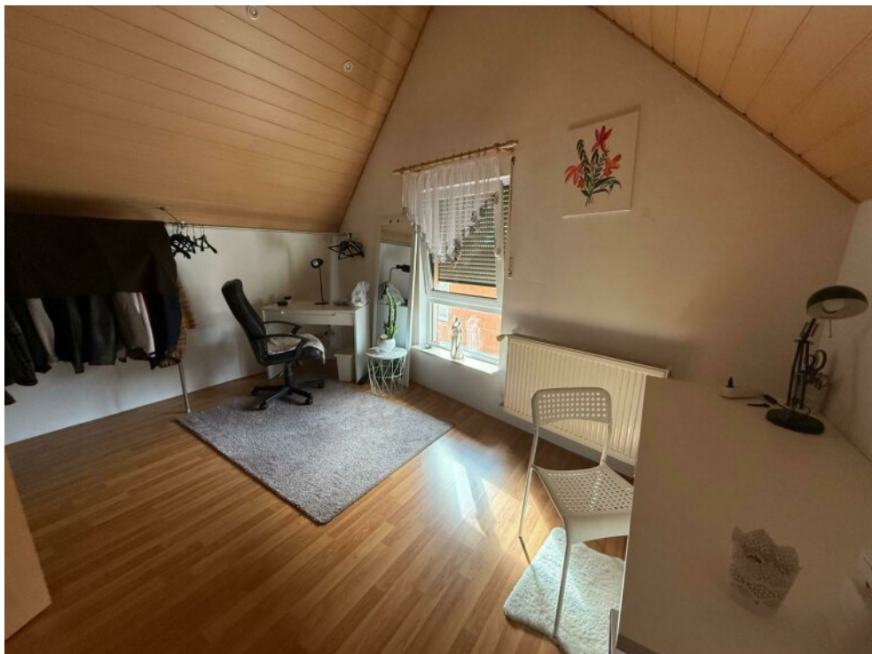
2. Kinderzimmer im DG