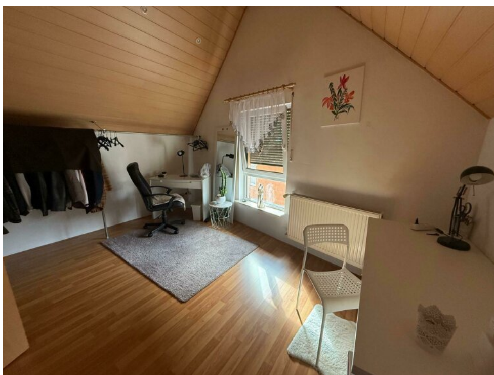
2. Kinderzimmer im DG