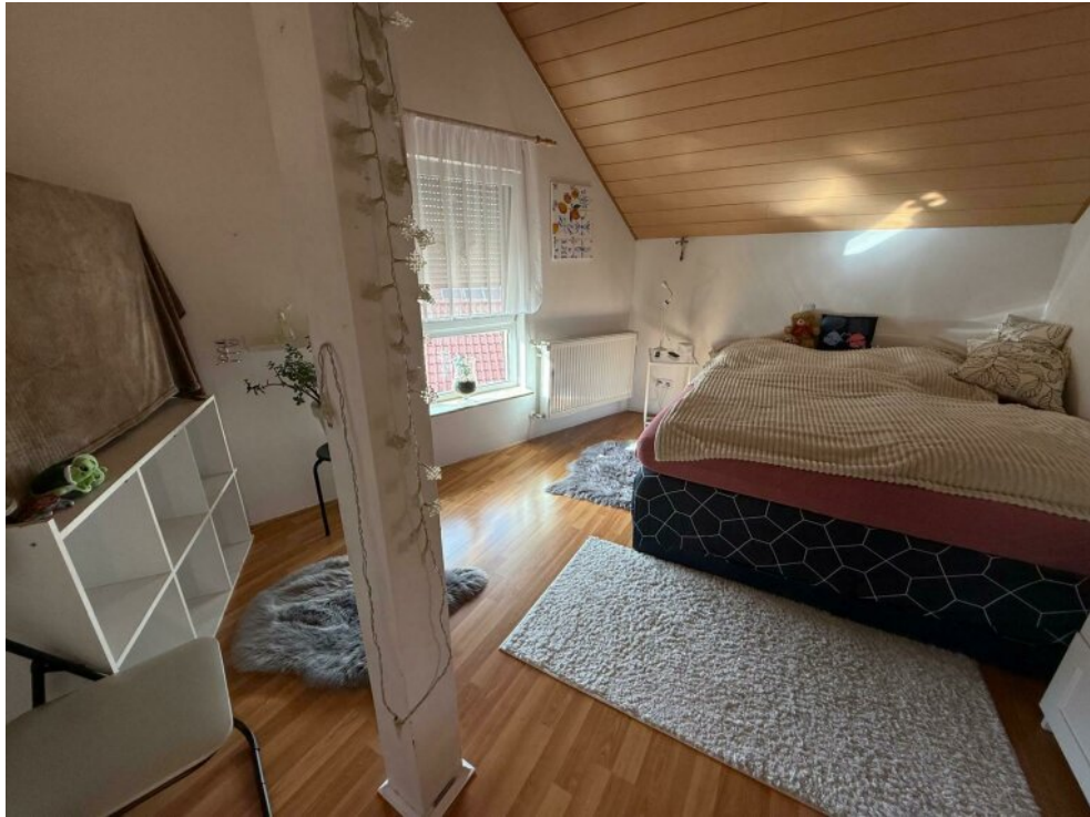
1. Kinderzimmer im DG