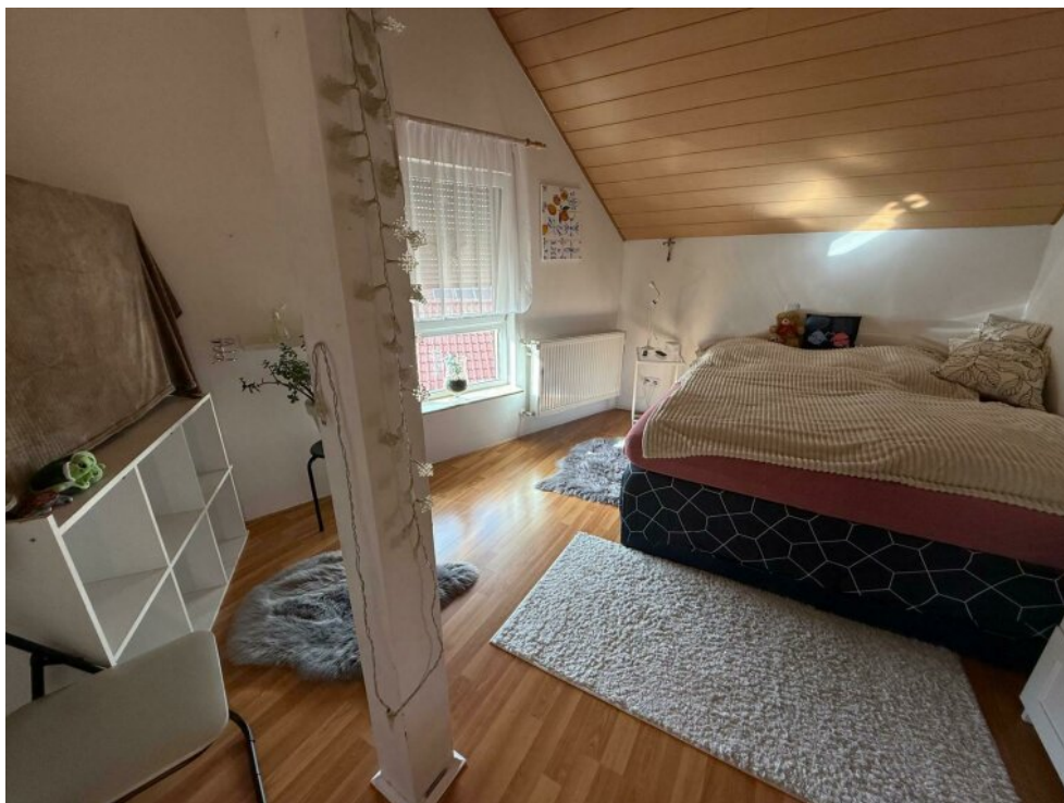
1. Kinderzimmer im DG