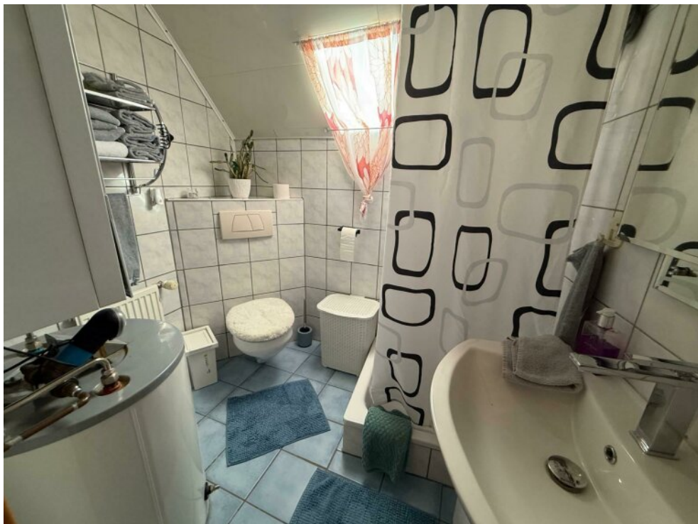
Duschbad im DG