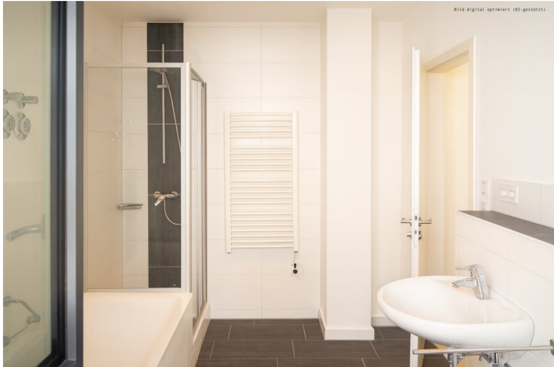
Bad mit Wanne und Dusche