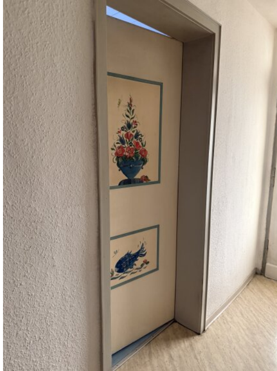
Türen mit Bauermalerei