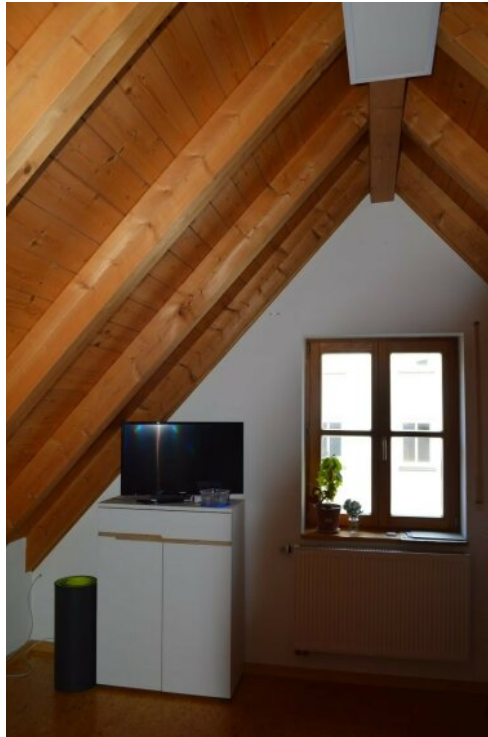
Zimmer oberes Geschoss