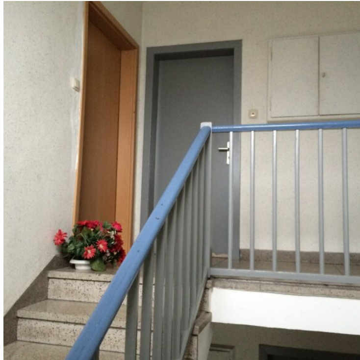
Flur mit Eingangstür