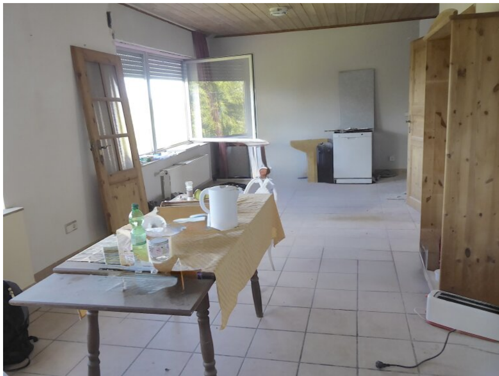
Offener Wohnbereich OG