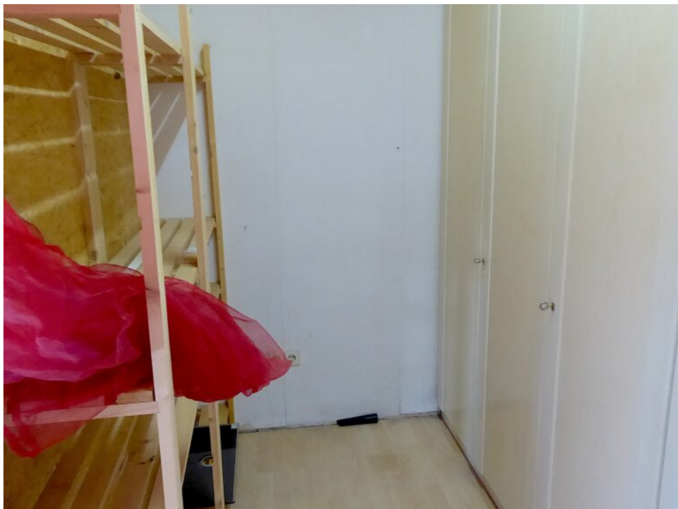
Begehbarer Kleiderschrank OG