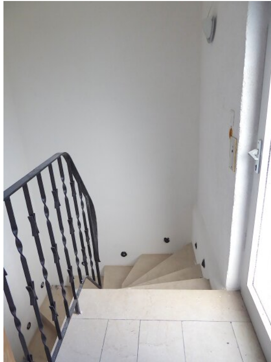
Eingang und Treppe OG