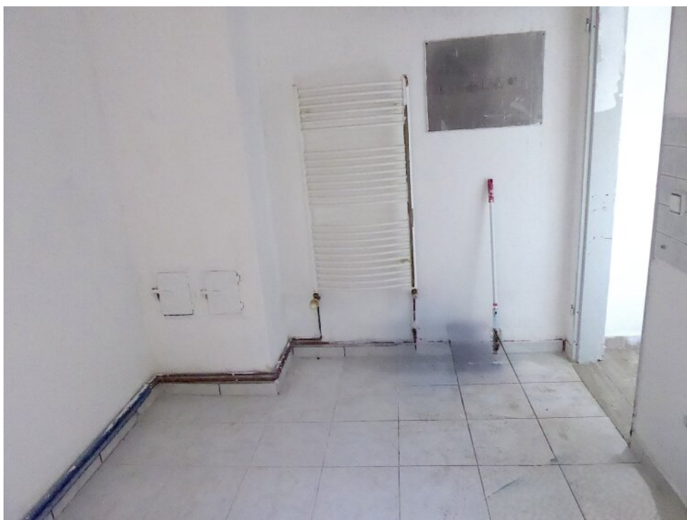
Küche im EG