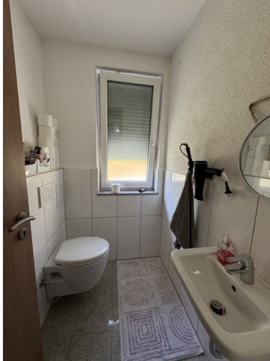
Gäste WC DG