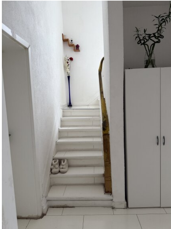
Aufgang in die Wohnung