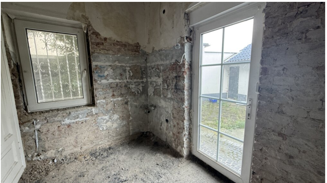
EG - Eingang Keller - Ausgang Garten