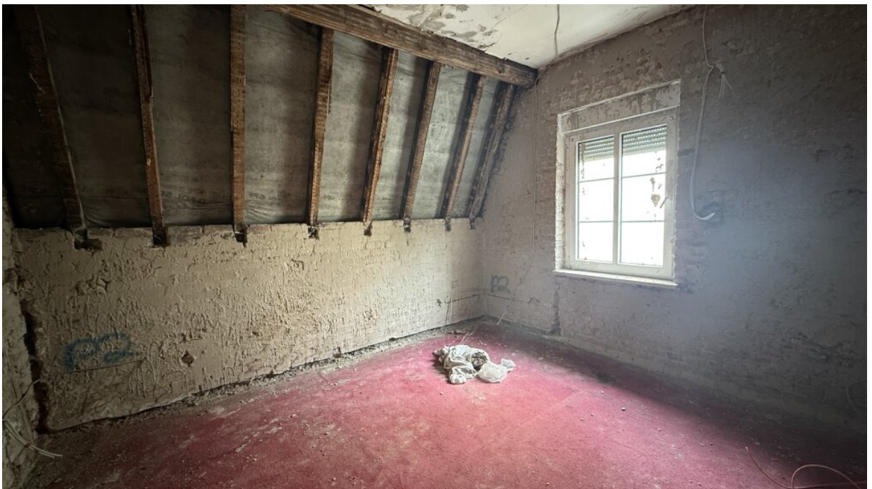
1. OG - Raum 3