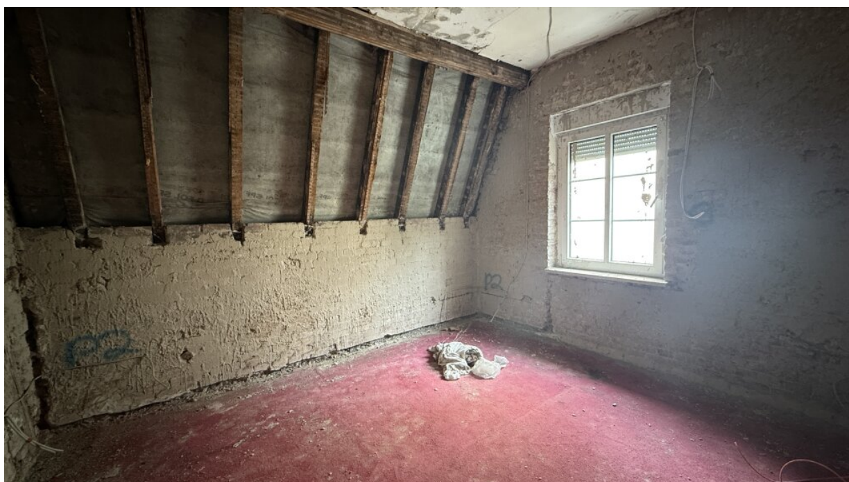
1. OG - Raum 3