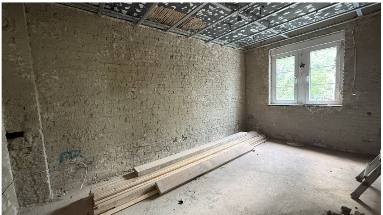
1. OG - Raum 2