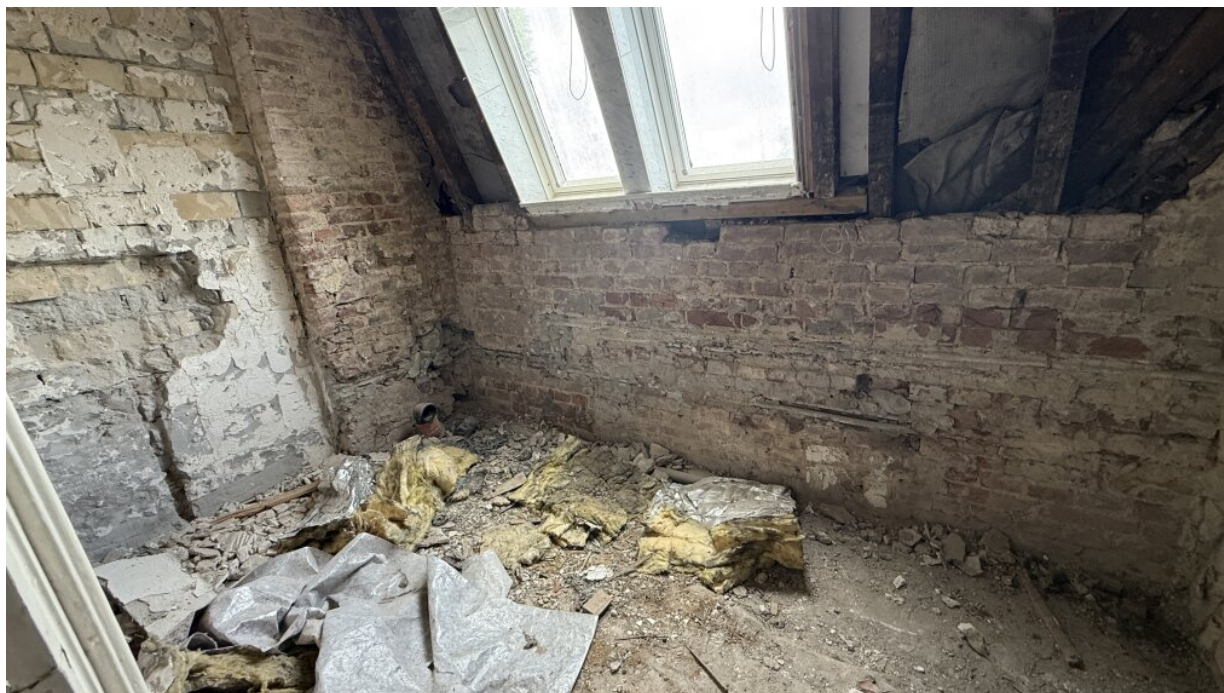
1. OG - Bad