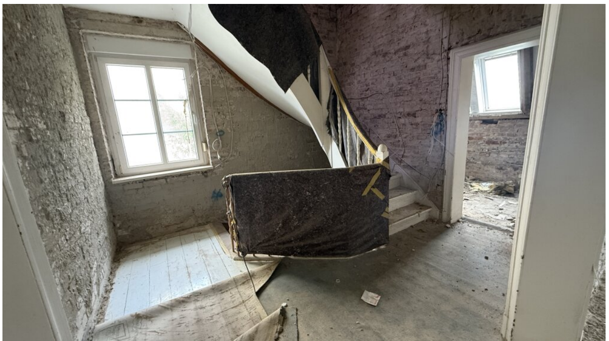
1. OG - Flur