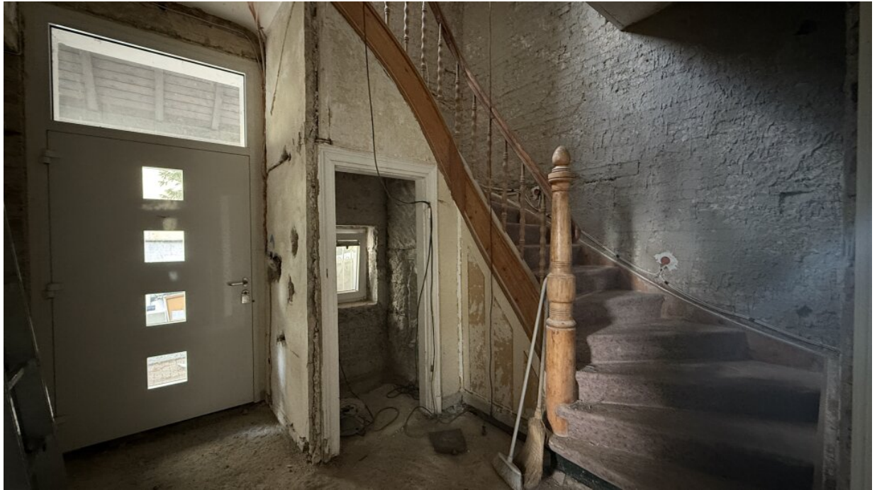
EG - Flur