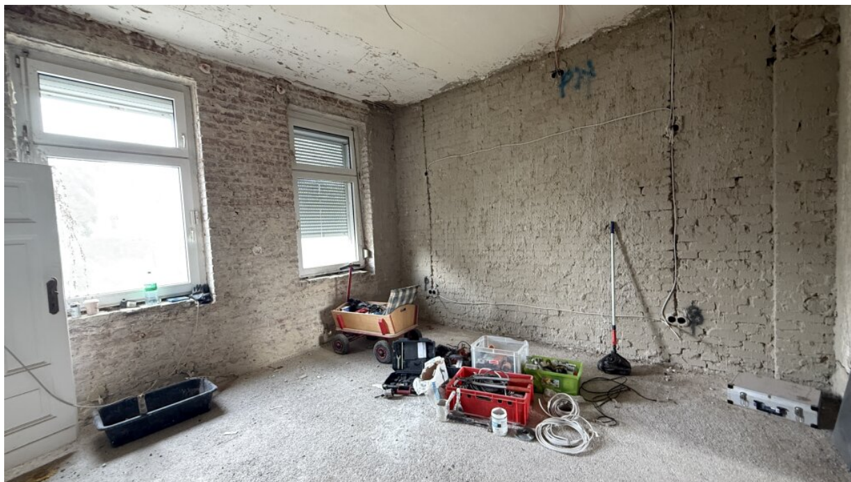
EG - Raum 2