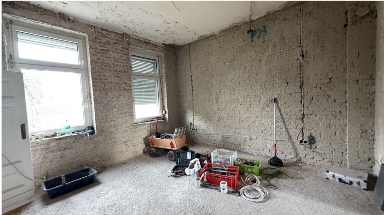
EG - Raum 2