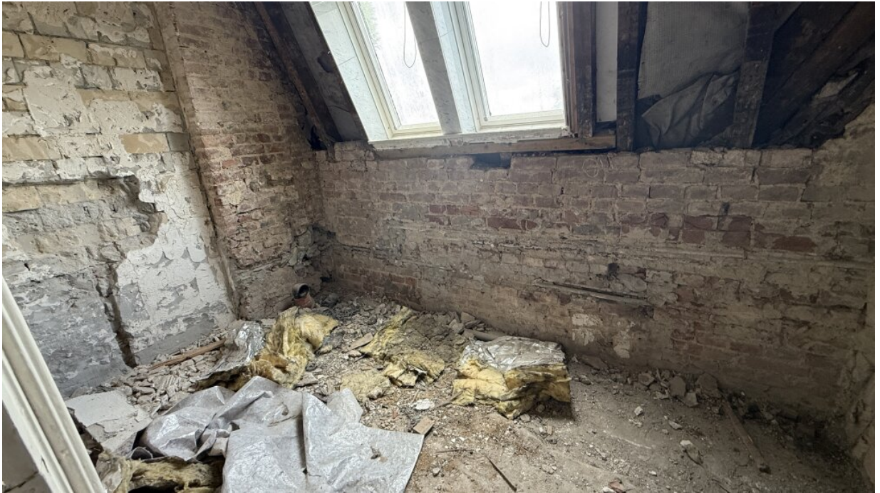
1. OG - Bad