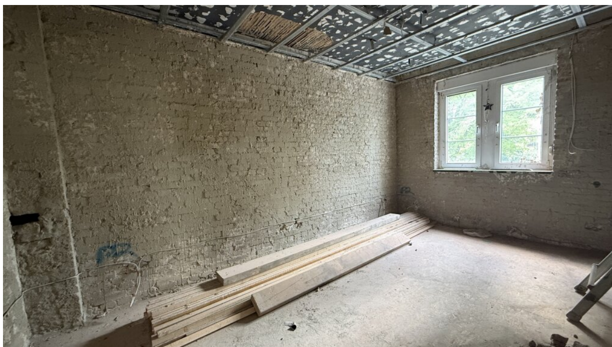
1. OG - Raum 2