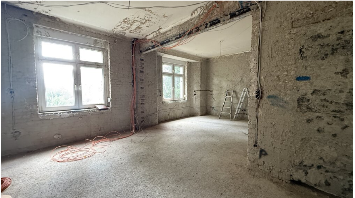
EG - Raum 1.a.JPG