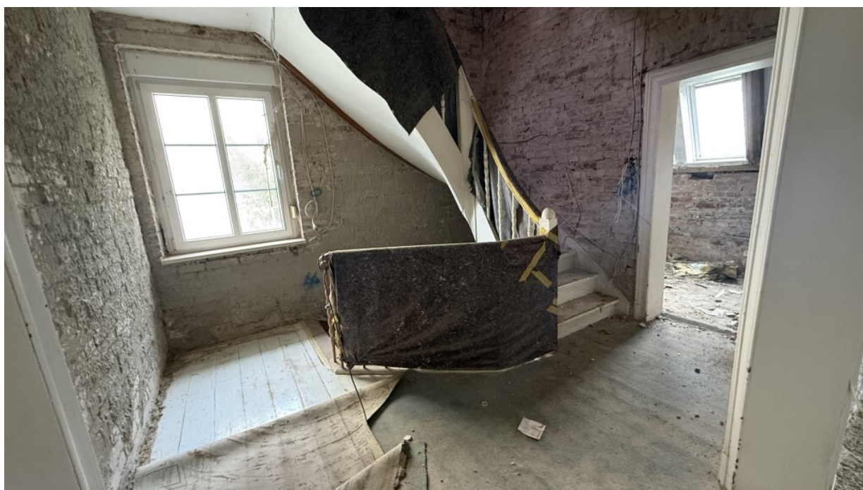
1. OG - Flur