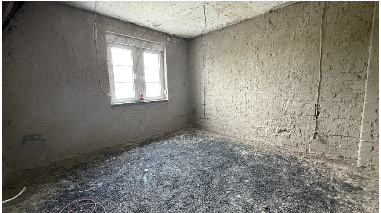
1. OG - Raum 1