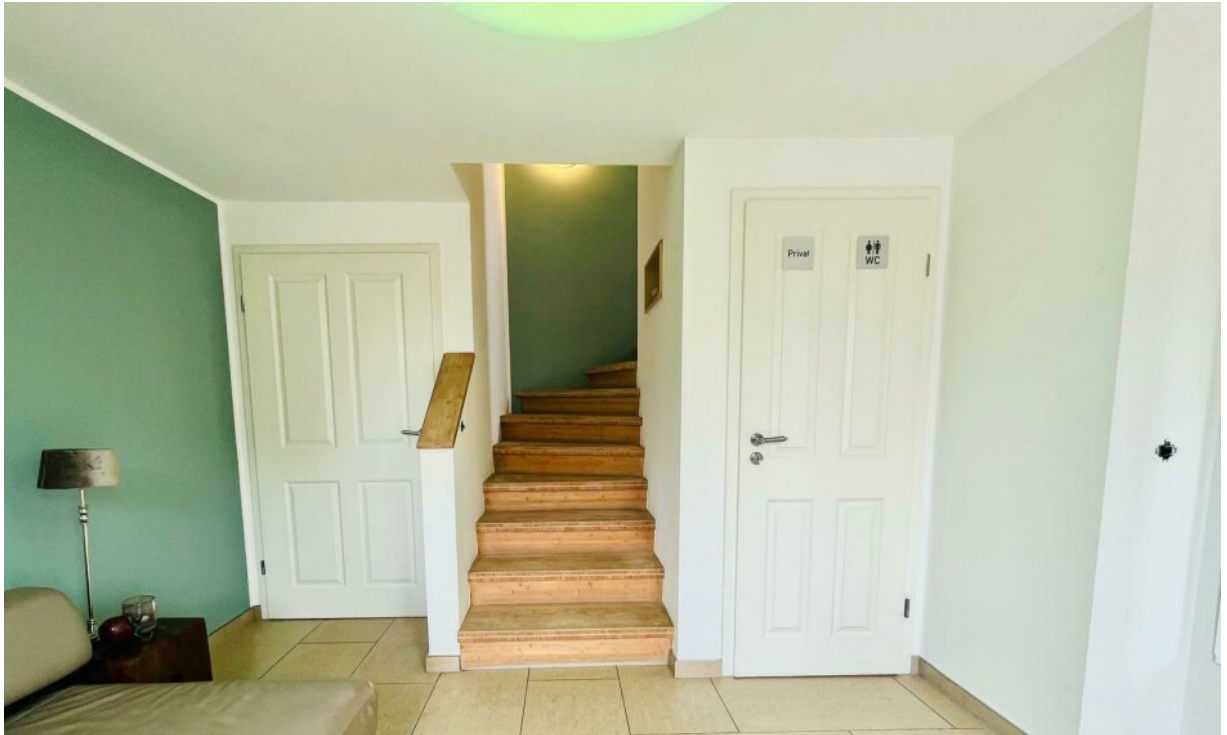
Aufgang zum OG