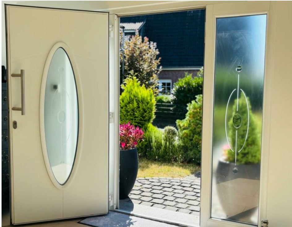
Blick aus Haustür