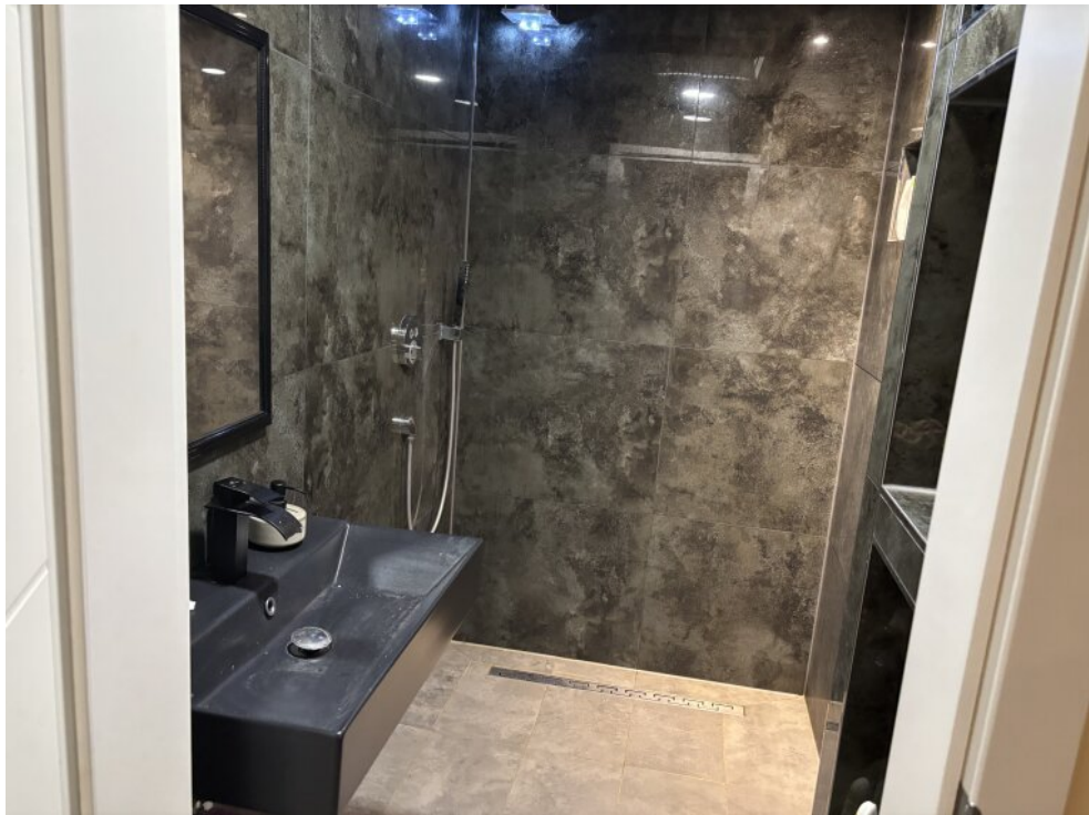
Keller - Bad im Gästezimmer