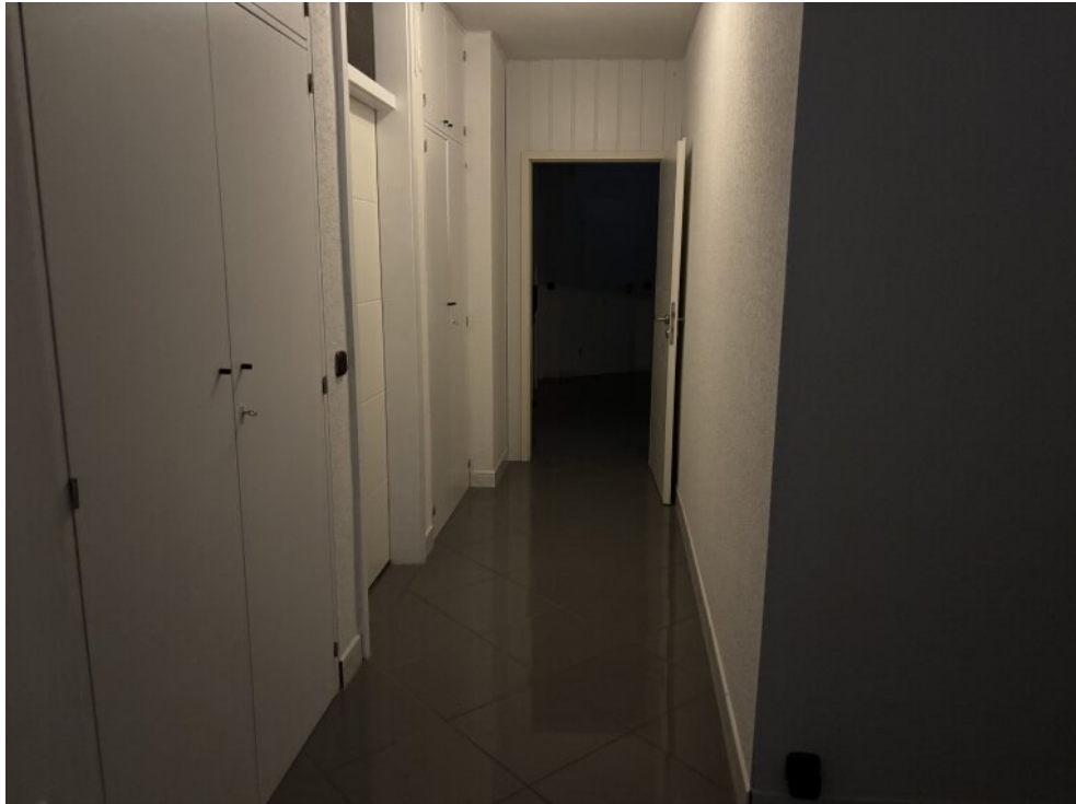
Flur mit Einbauschränken