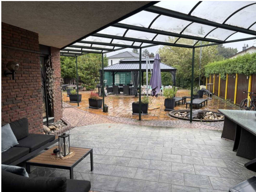
Terrasse vor Wohnzimmer