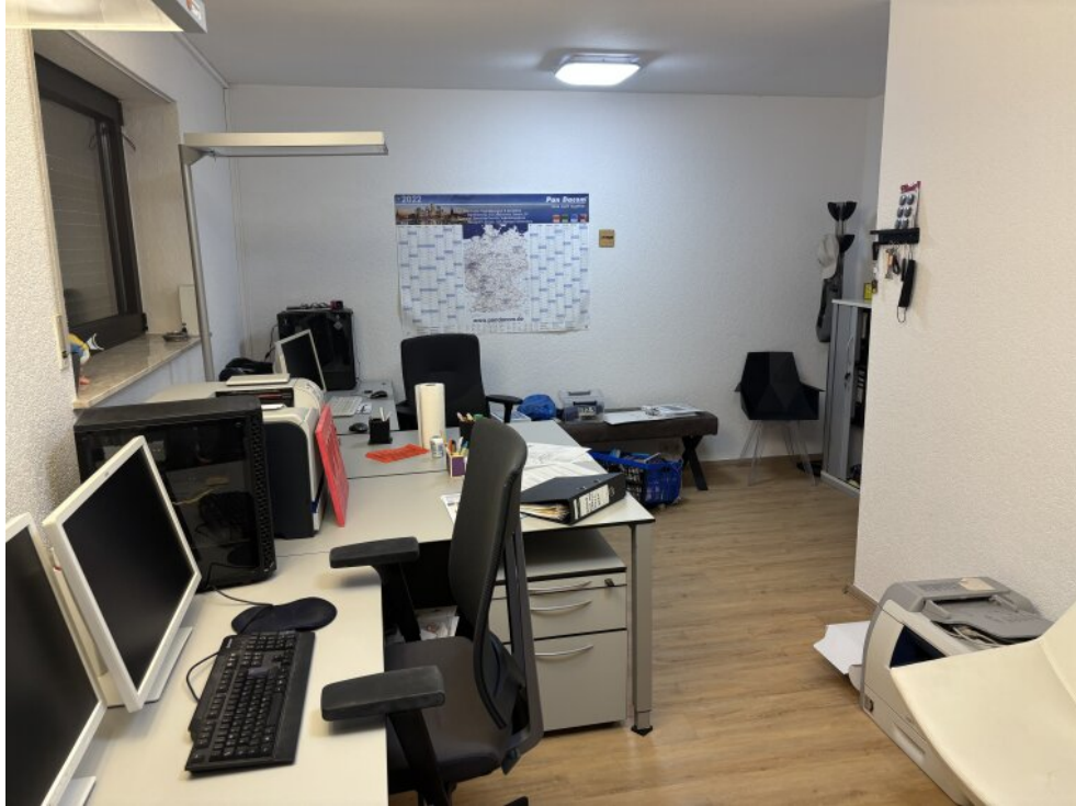
Keller - Büro