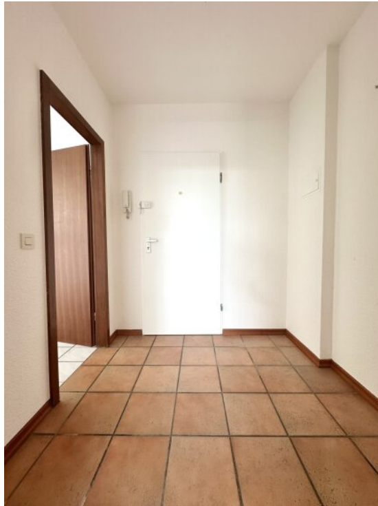
Eingangsbereich/ Flur u. Küche