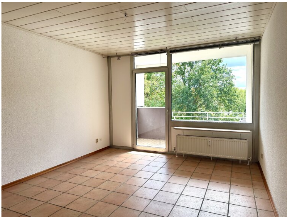
Wohnbereich mit Loggia