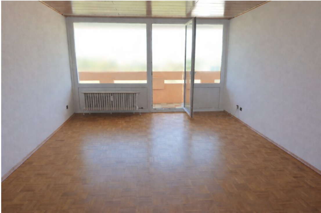
Wohnzimmer mit Zugang Balkon