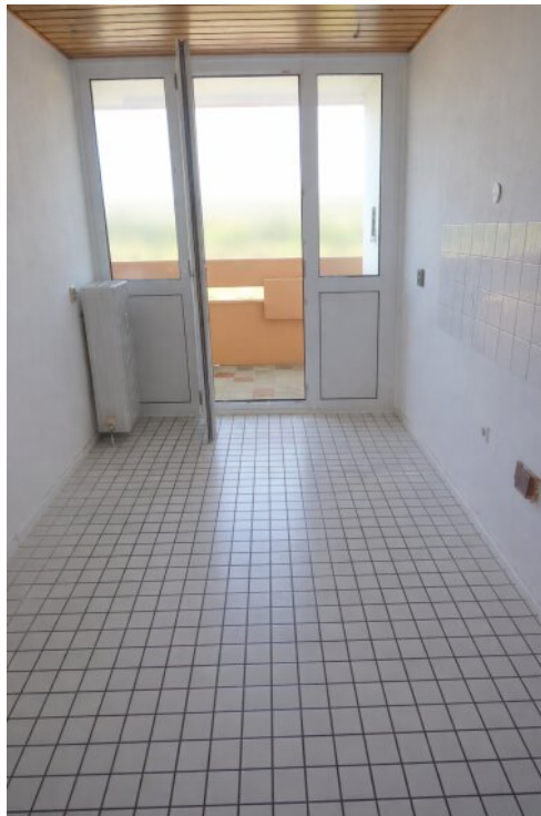
Küche mit Zugang Balkon