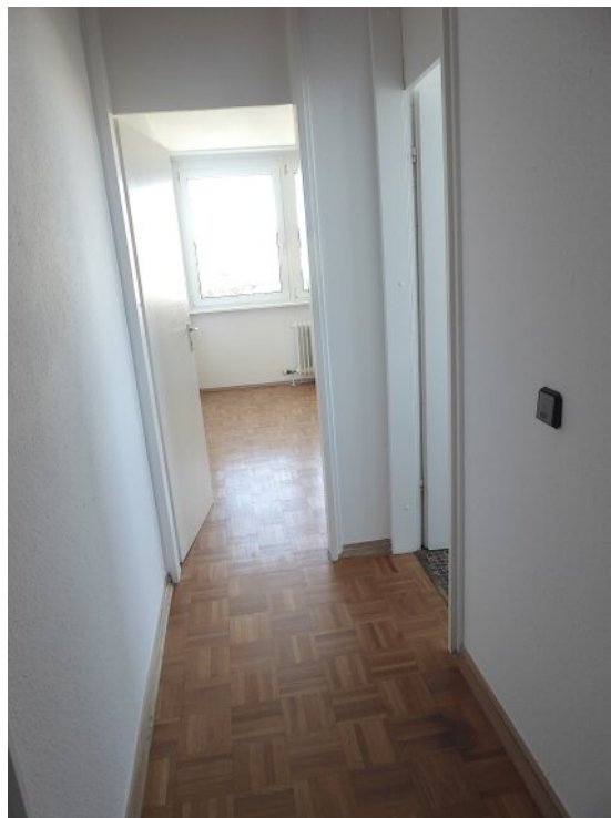
Flur vor dem Badezimmer