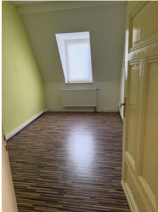
Kinderzimmer OG 2