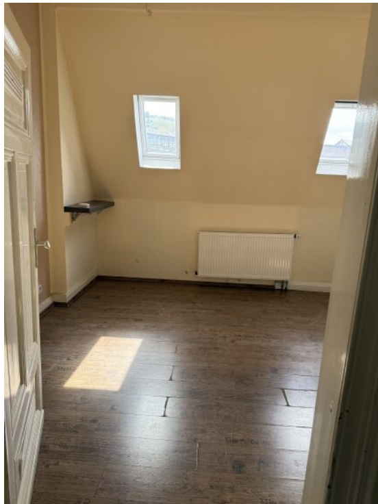
Schlafzimmer OG 2