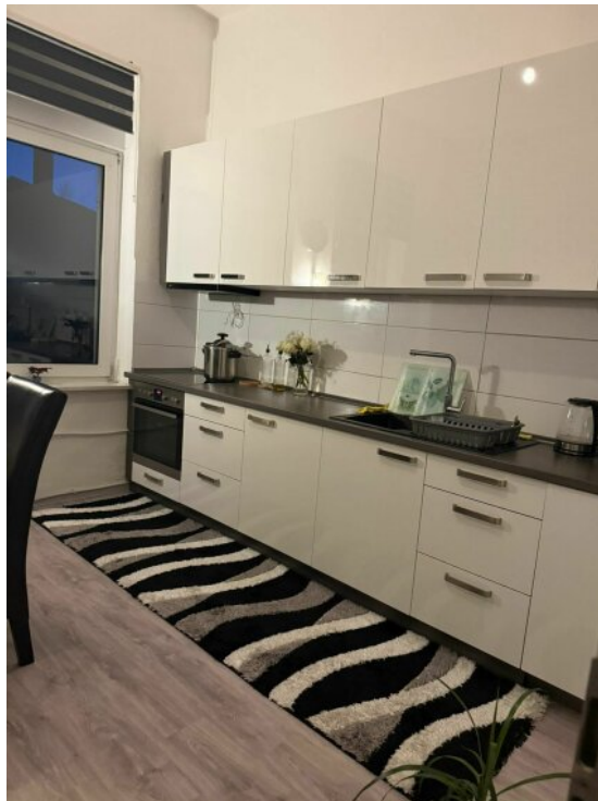
Küche 1 OG