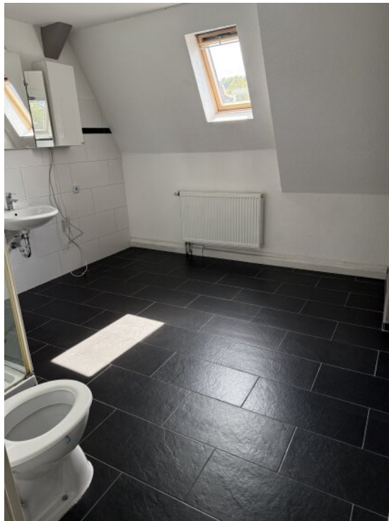
Badezimmer OG 2