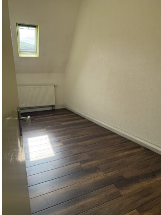
Kinderzimmer OG 2