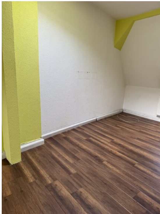
Kinderzimmer OG 2