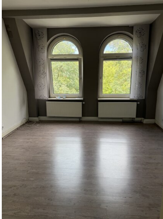
Wohnzimmer OG 2