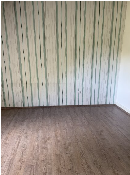
Schlafzimmer OG 2