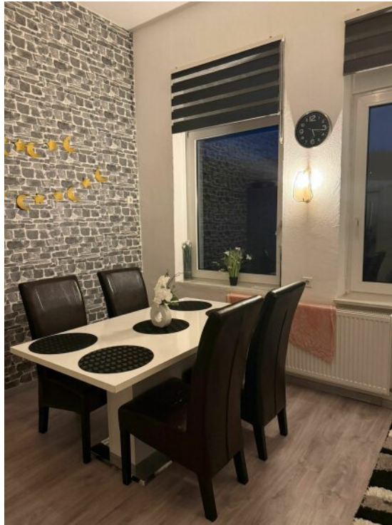
Küche 1 OG