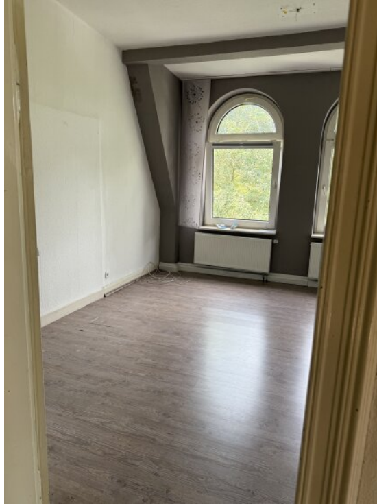
Schlafzimmer OG 2