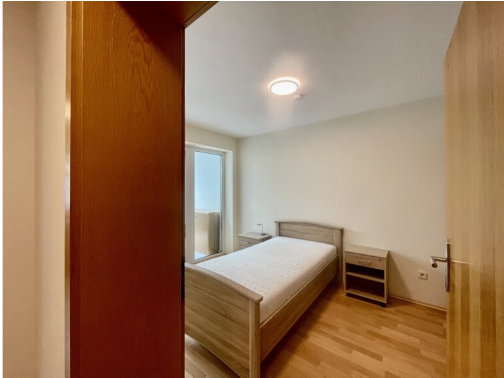
Blick ins Schlafzimmer