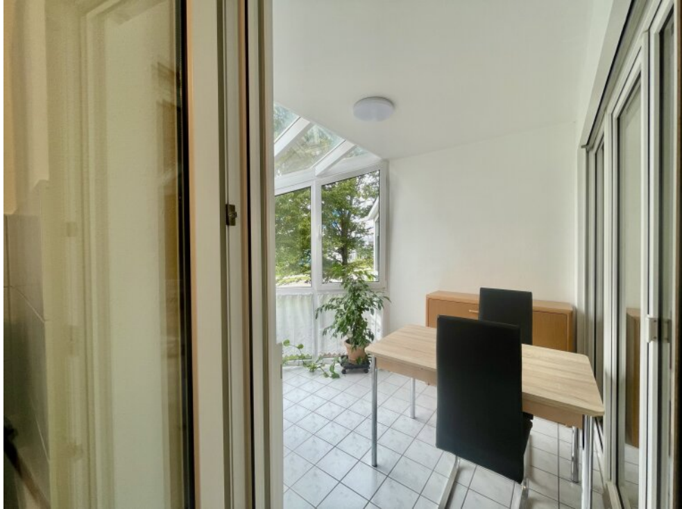
Blick in den Wintergarten