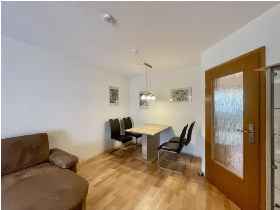
Essbereich im Wohnzimmer