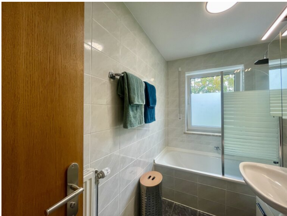
Bad mit Fenster