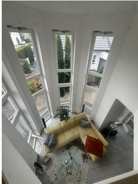
Galerie im Wohnzimmer