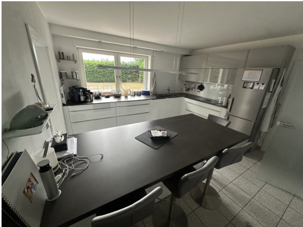
Küche inkl. Einbauküche