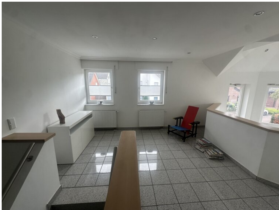
Raum am Treppenhaus