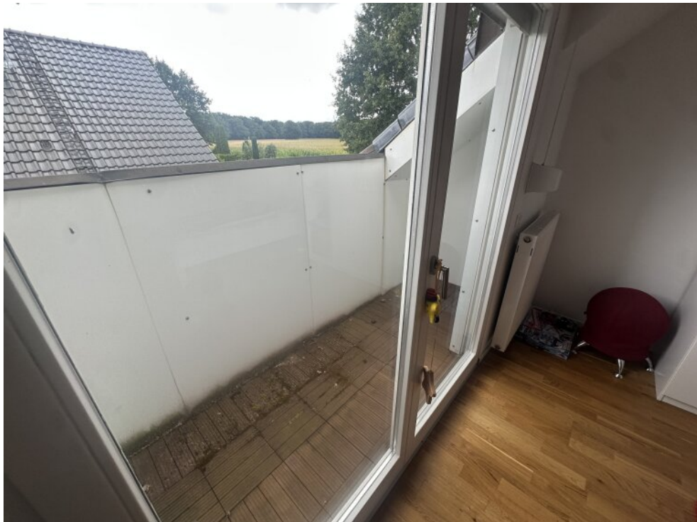
Balkon am Kinderzimmer