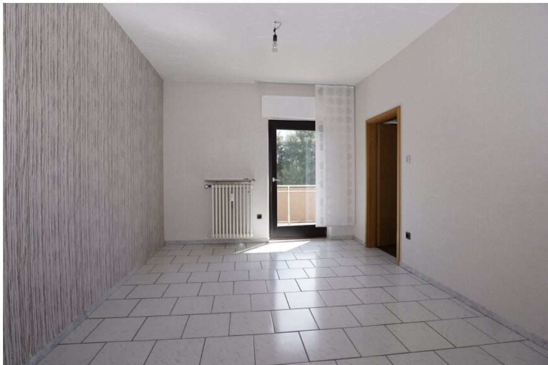
OG Esszimmer mit Balkonzugang