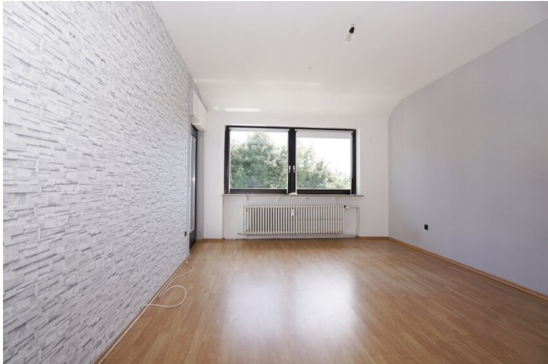
OG Kinderzimmer mit Balkonzugang