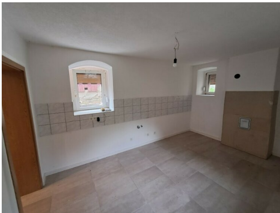
Küche mit Schornsteianschluß