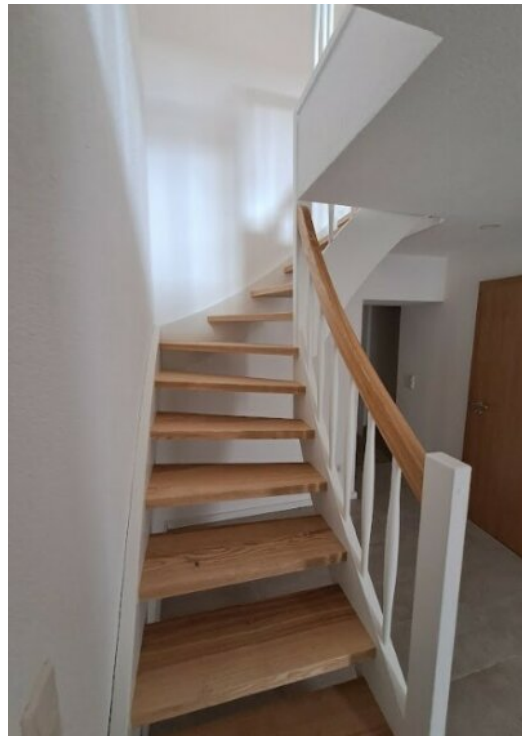
Neue Treppe zum DG