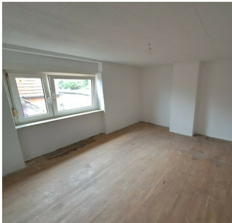
Schlafzimmer im DG