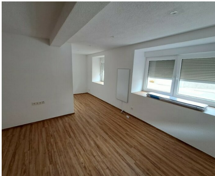
Blick ins WZ