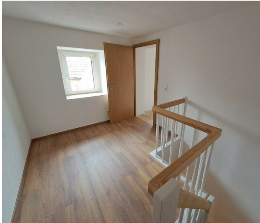
Flurbereich im DG