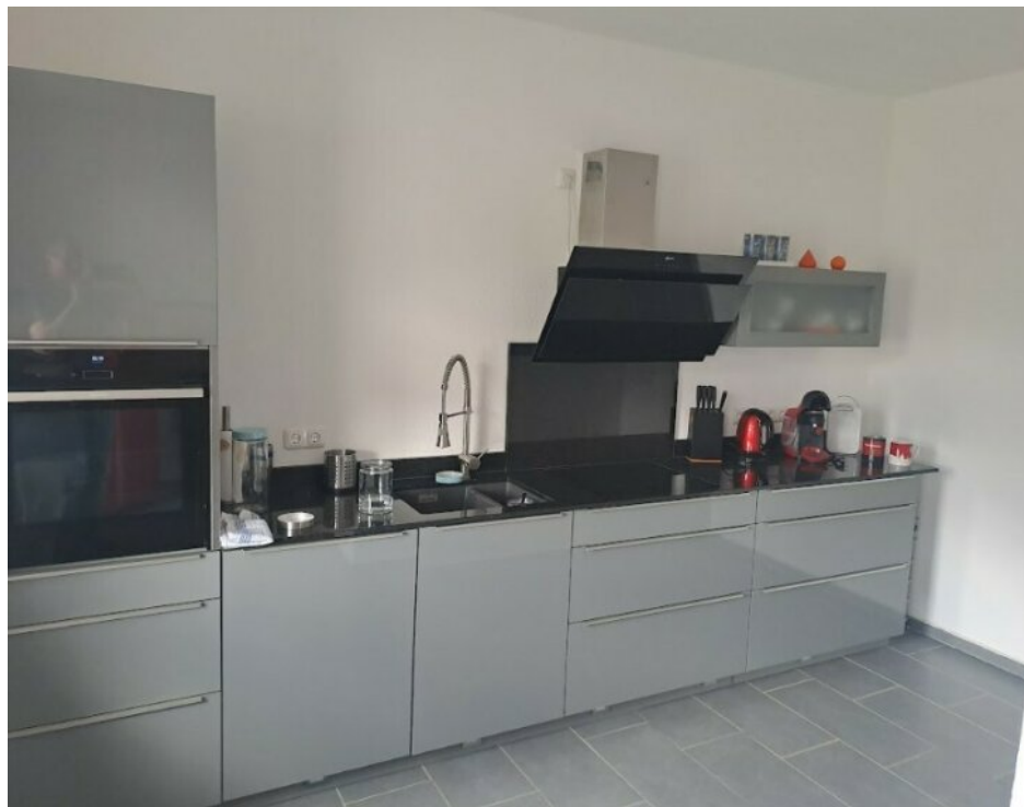
Offener Küchenbereich mit EBK