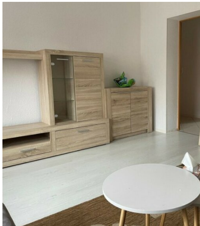
Raumbeispiele kleine Wohnung