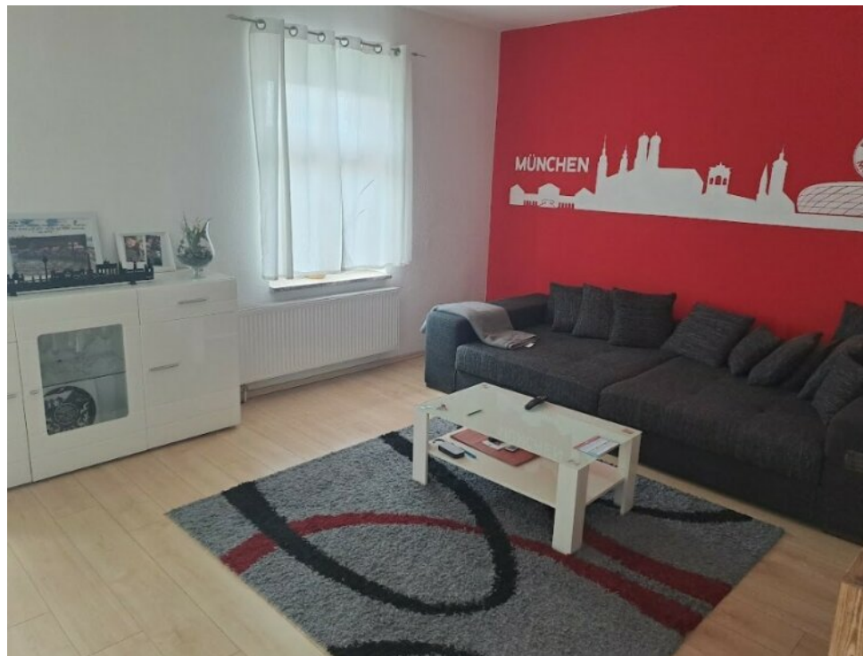
Raumbeispiele große Wohnung