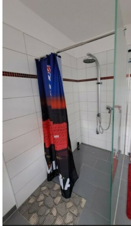
Bad mit bodentiefer Dusche