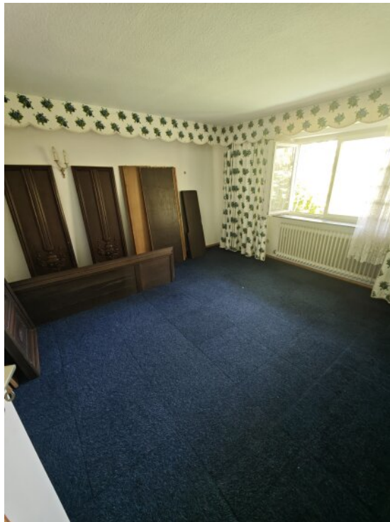
Zimmer im Keller