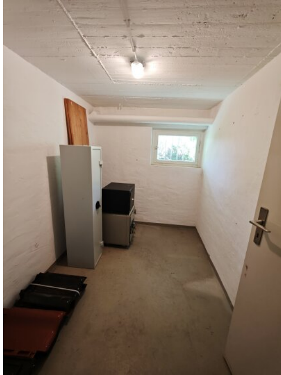
Abstellraum im Keller