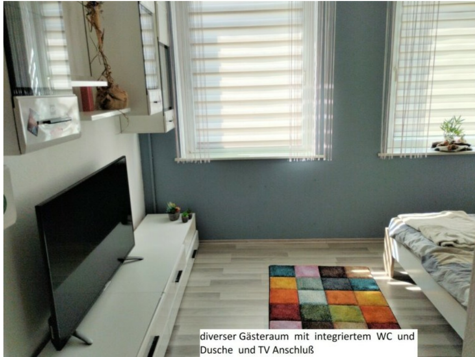
diverser Gästeraum mit integriertem WC und Dusche und TV Anschluß