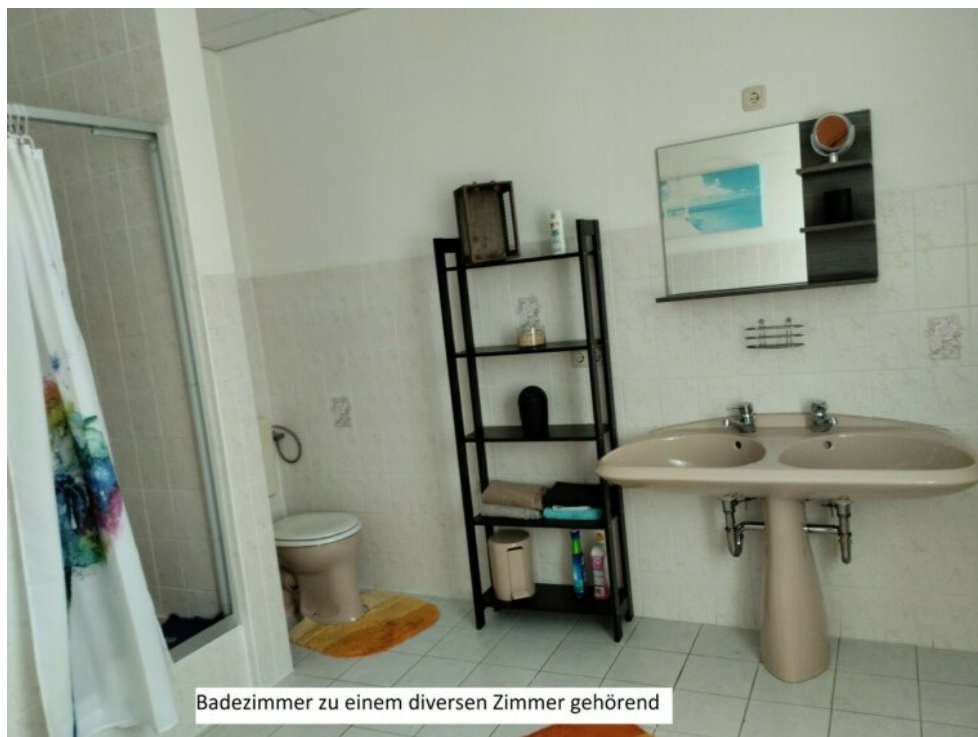
Badezimmer zu einem diversen Zimmer gehörend