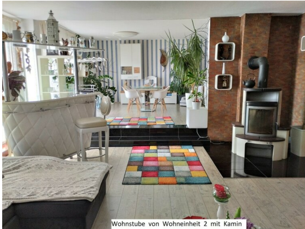
Wohnstube von Wohneinheit 2 mit Kamin