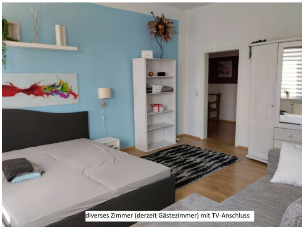
diverses Zimmer (derzeit Gästezimmer) mit TV-Anschluss