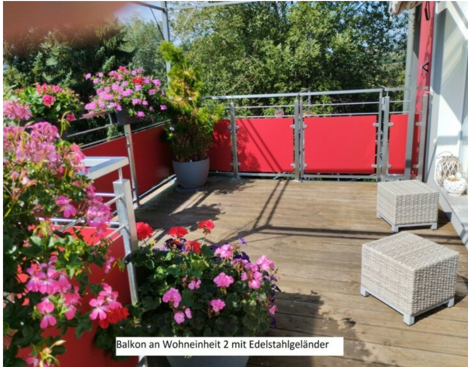
Balkon an Wohneinheit 2 mit Edelstahlgeländer