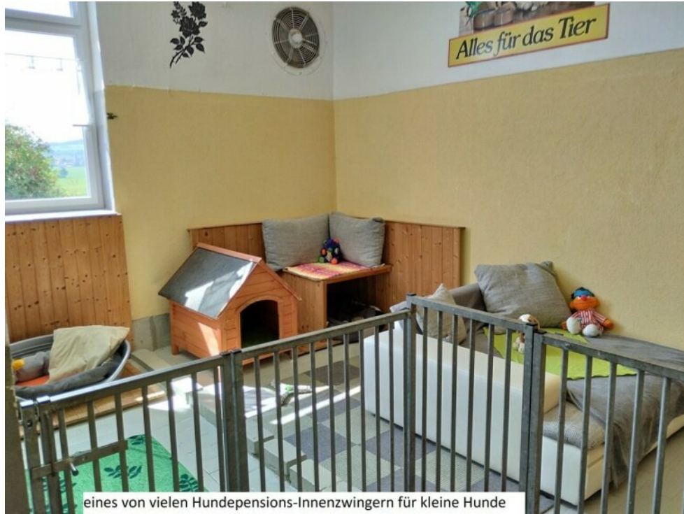
eines von vielen Hundepensions-Innenzwingern für kleine Hunde