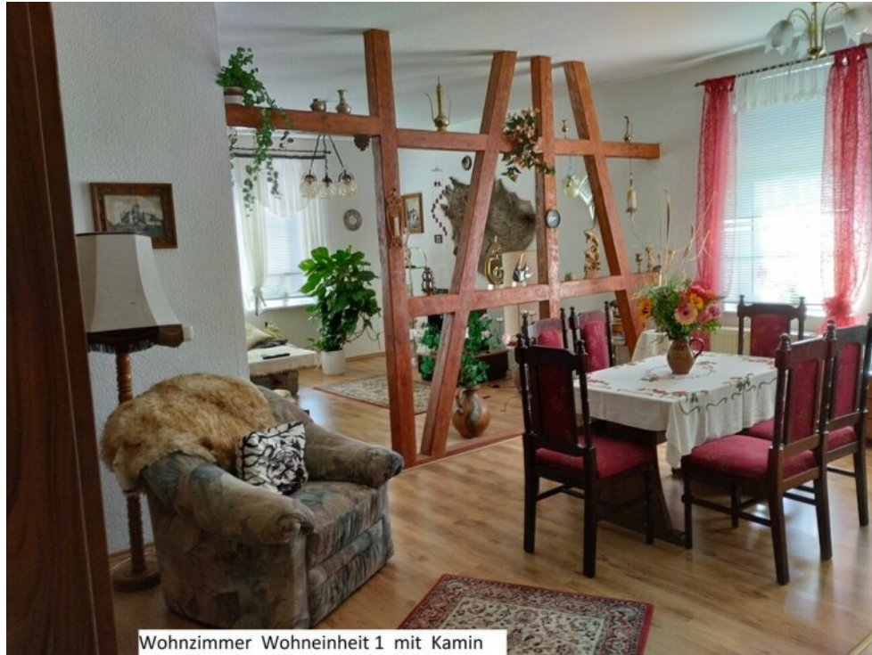
Wohnzimmer Wohneinheit 1 mit Kamin