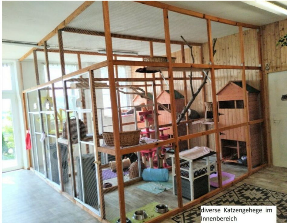
diverse Katzegehege im Innenbereich