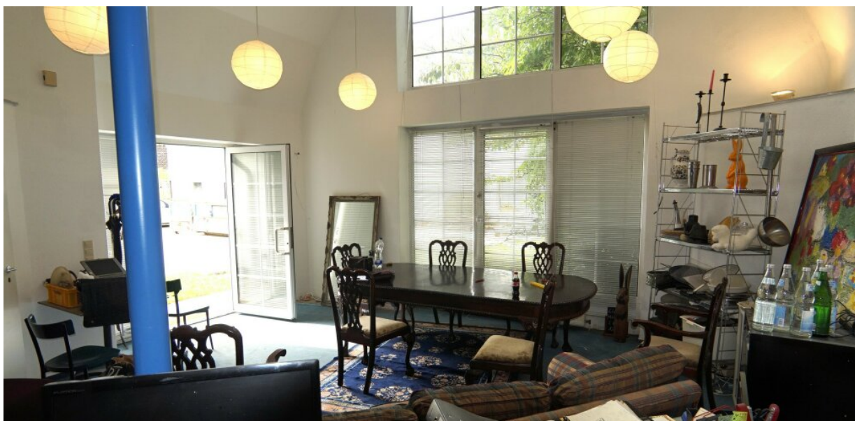
EG Wohnng links