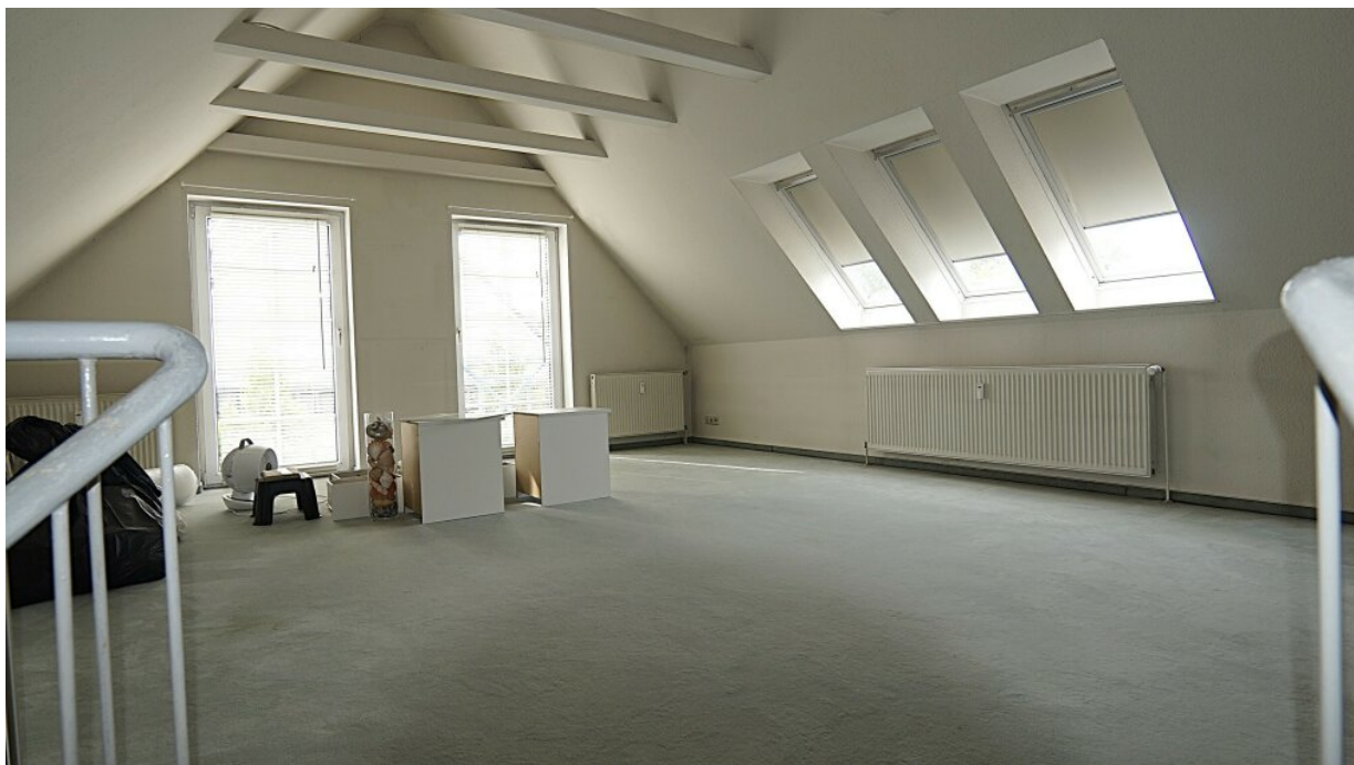
Obere Ebene Whg. rechts