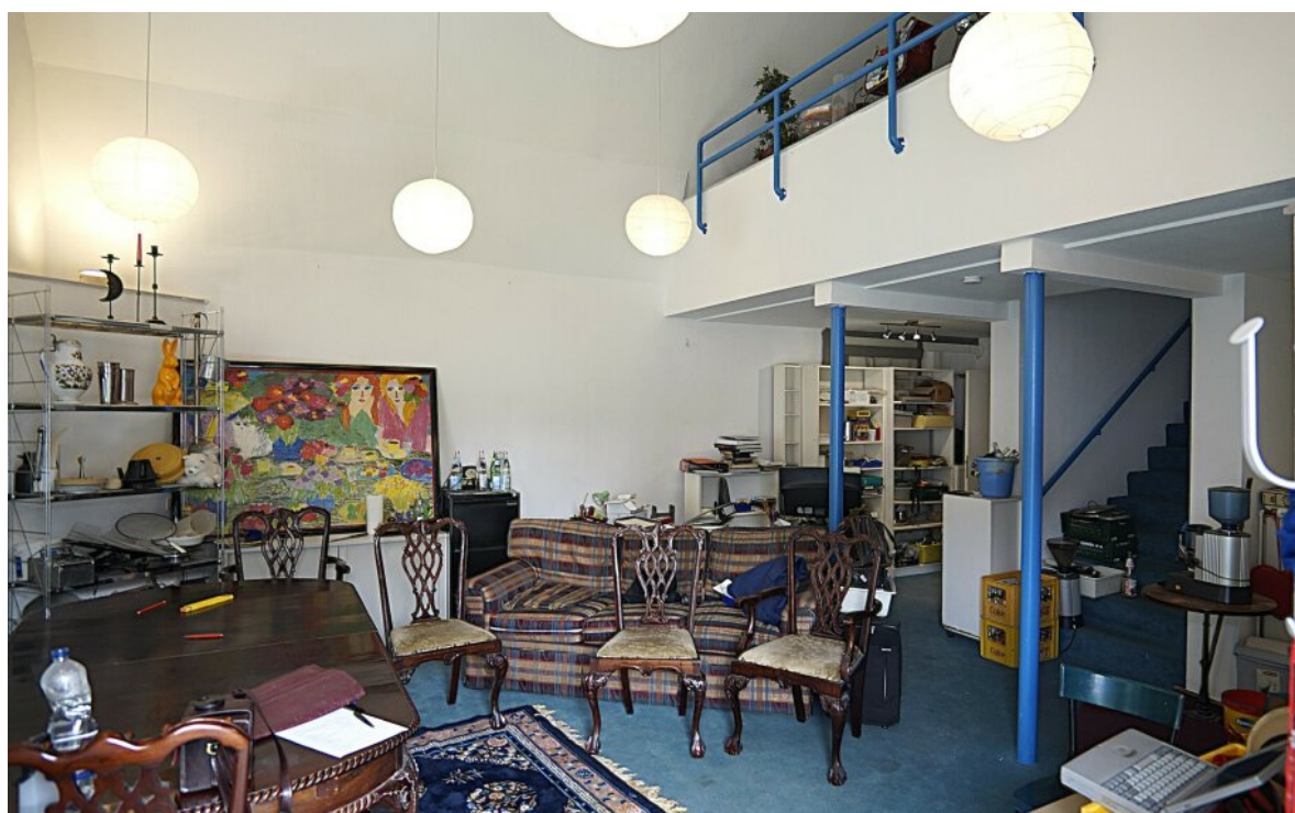
Wohnbereich Whg. links