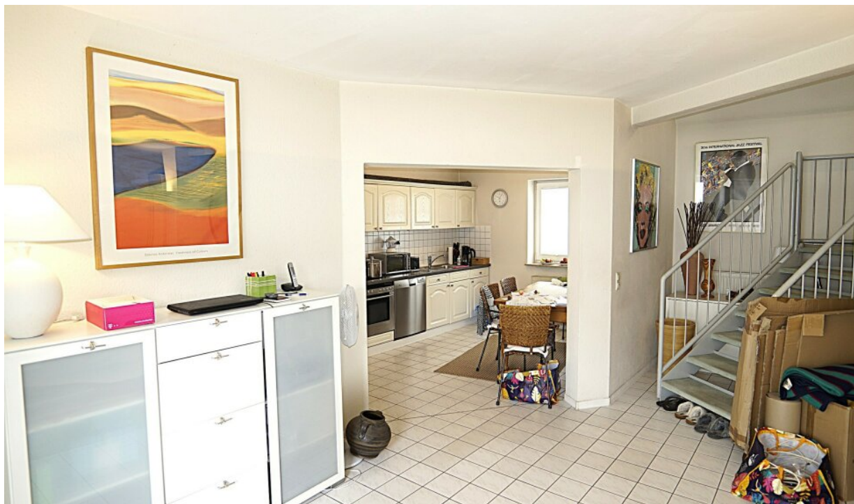
Wohnbereich/Küche Whg. rechts