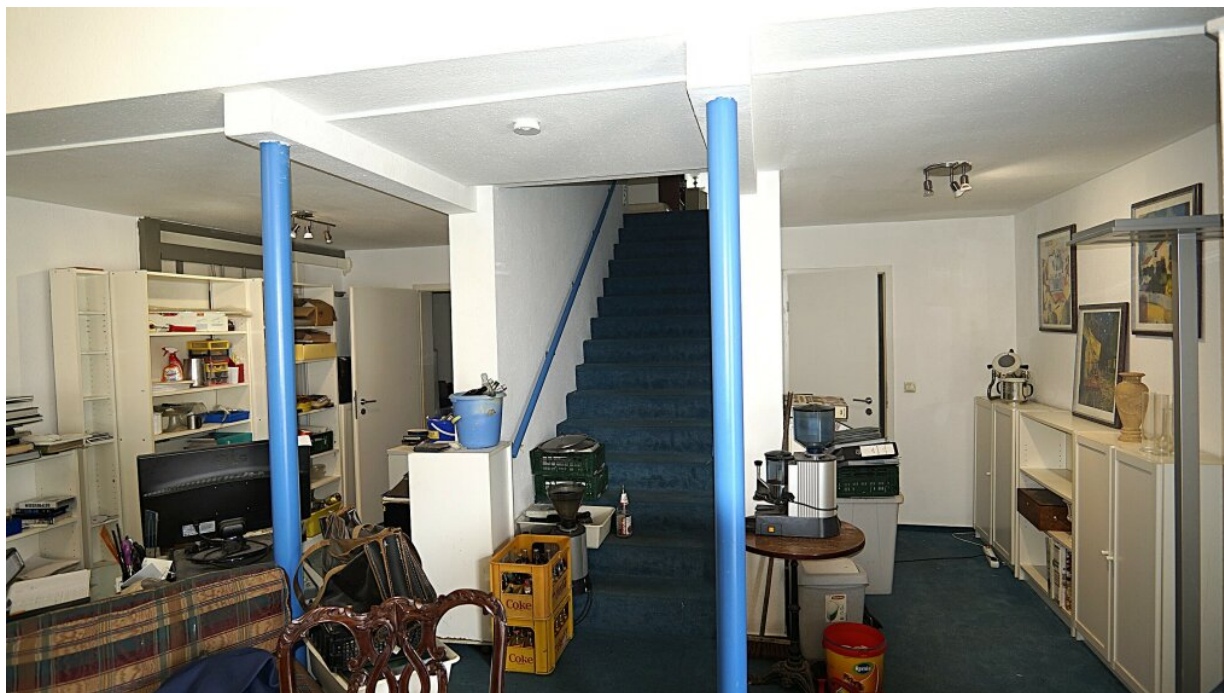
Aufgang obere Ebene Whg. links