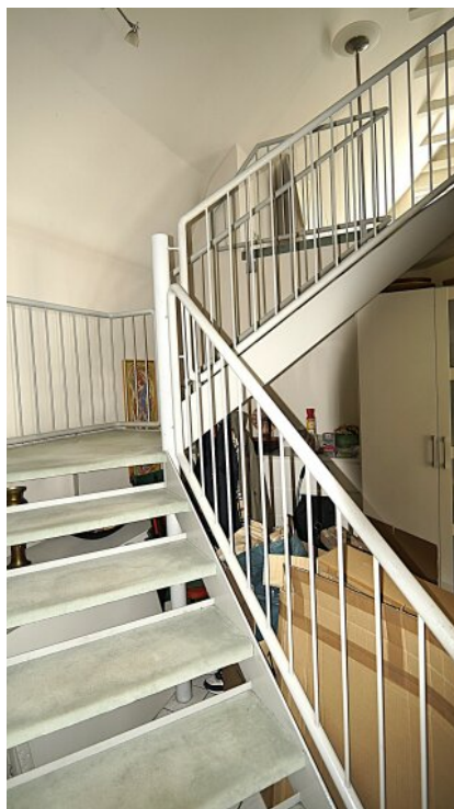
Aufgang Whg. rechts