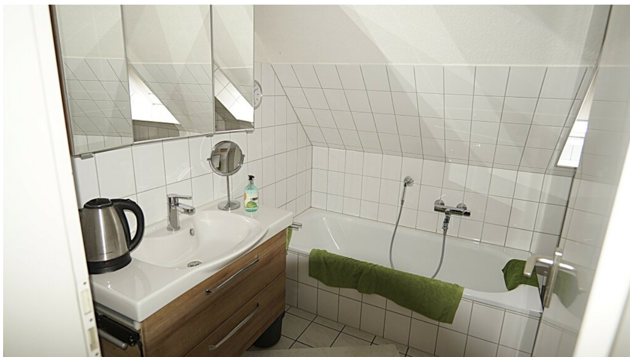
Bad Whg. rechts