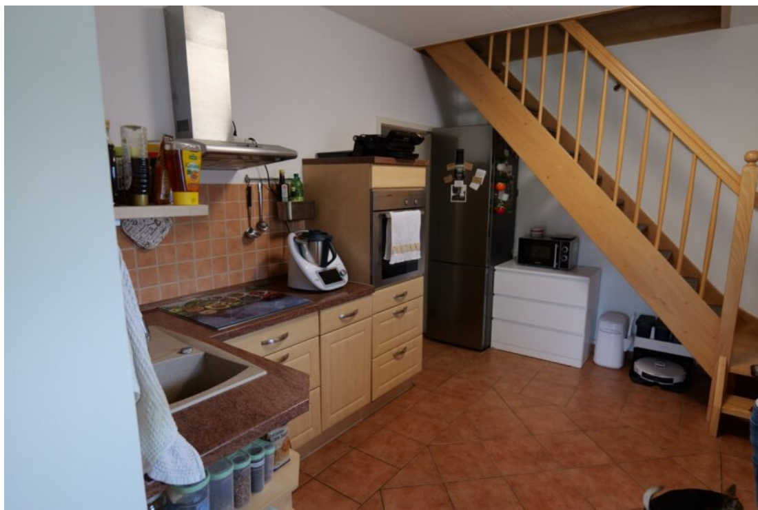
mit Zugang zum OG