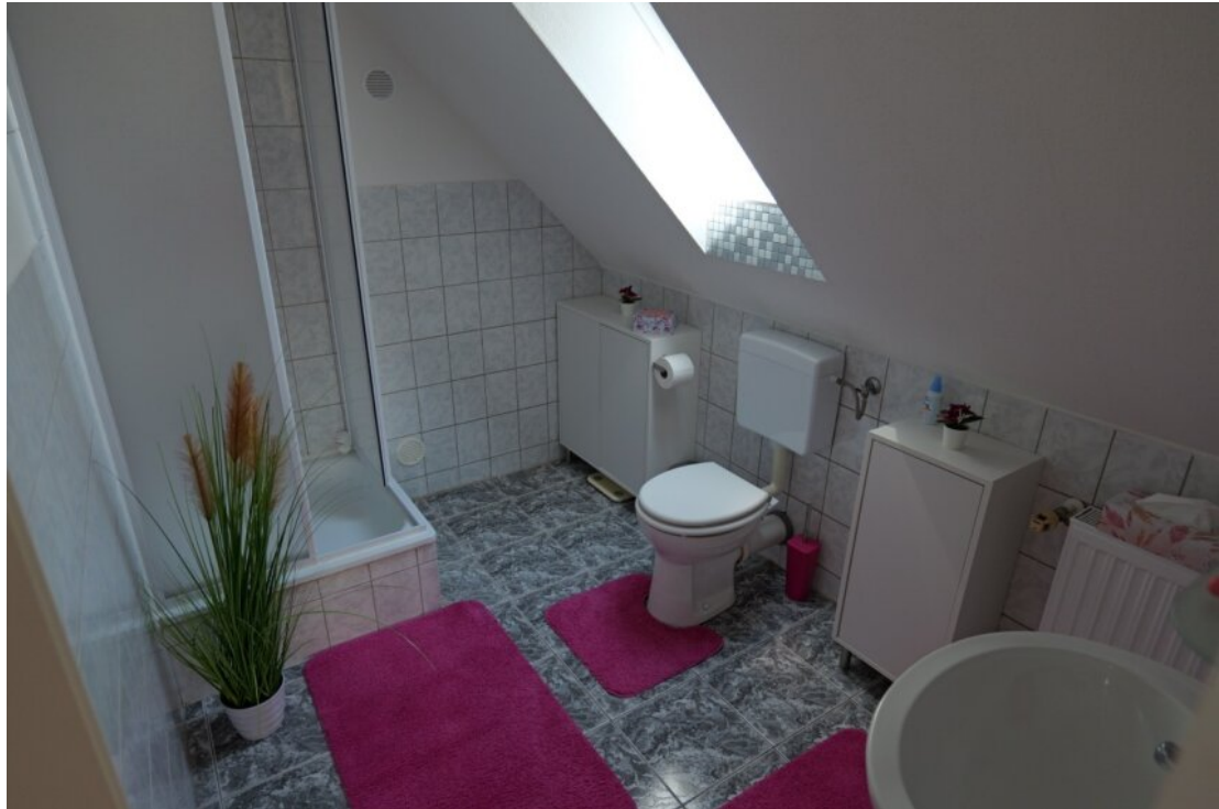
Bad im OG