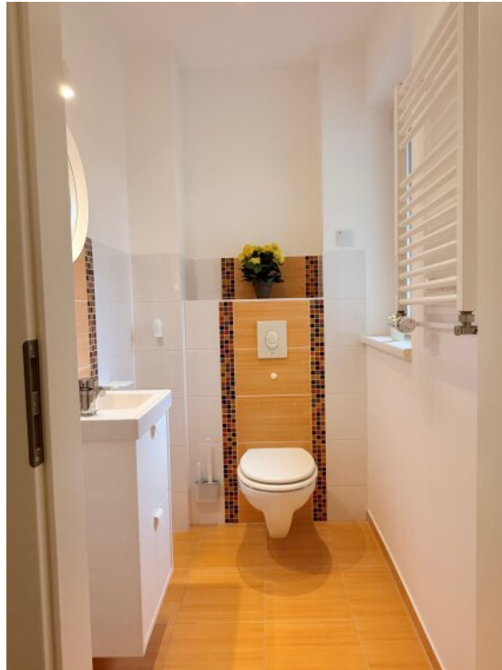
WC im EG