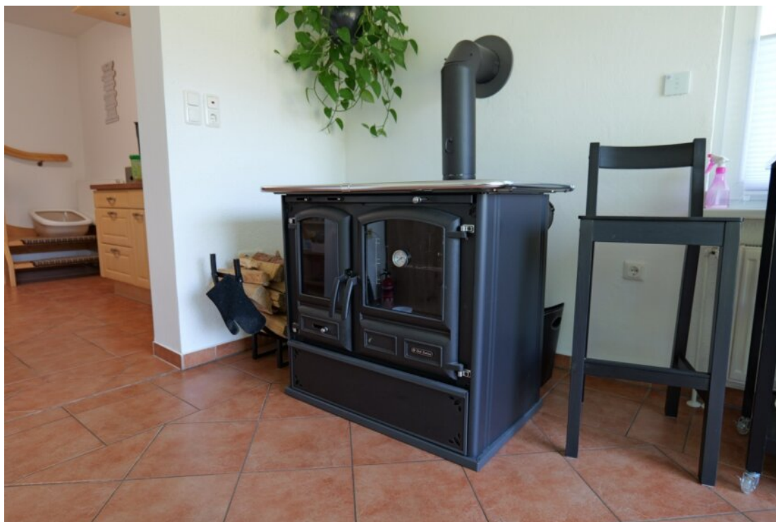
mit besonderem Ofen