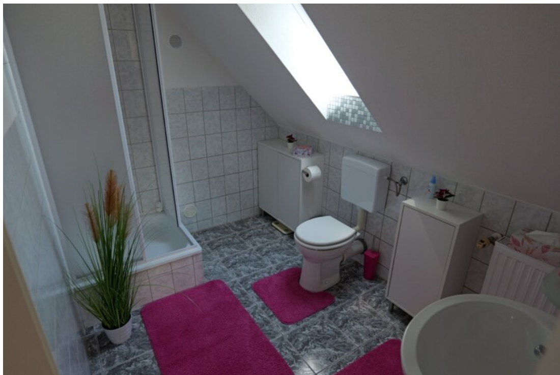
Bad im OG