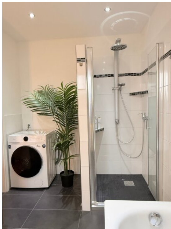
EG Badezimmer (1)