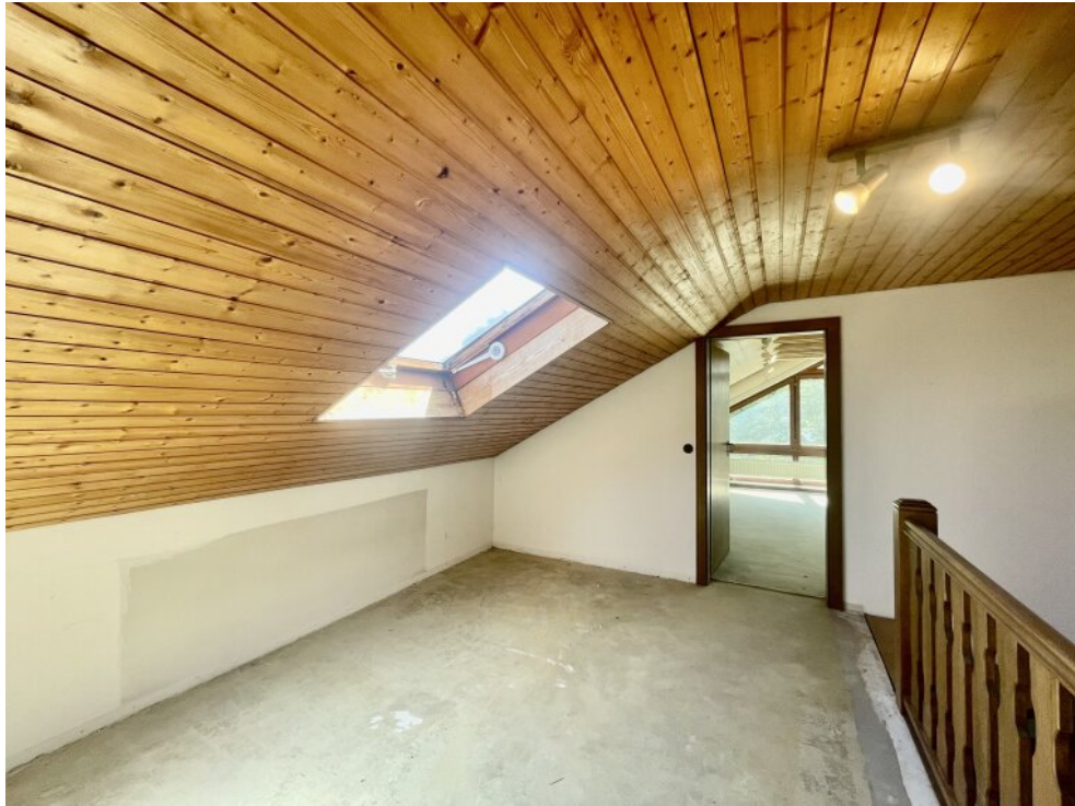
Flur im OG