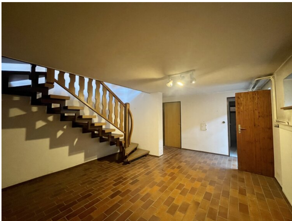
Flur im Keller