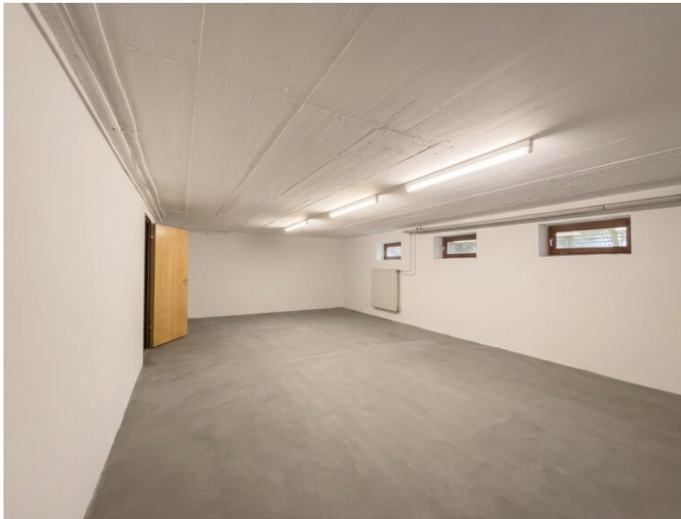
Lagerraum im Keller