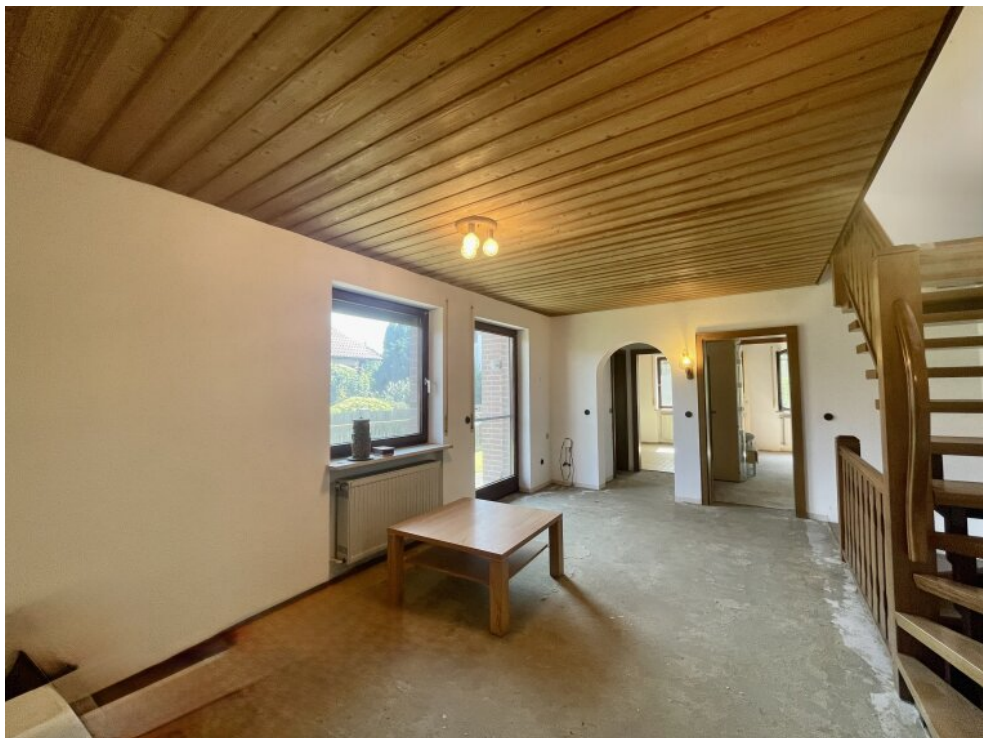
Flur / Eingang EG