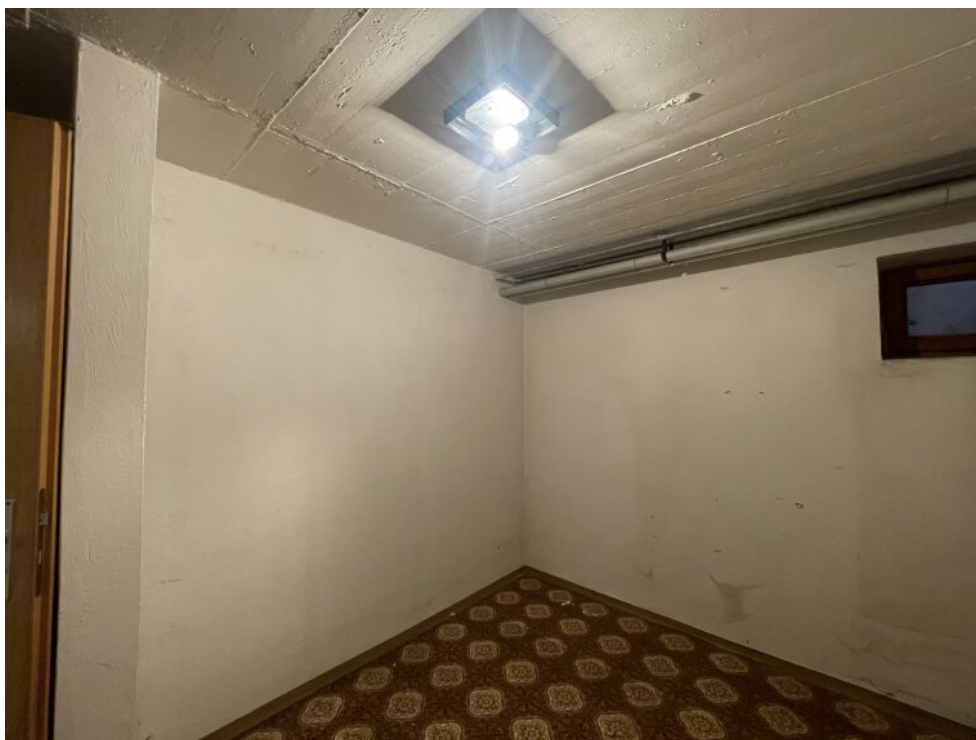
Lagerraum 1 im Keller