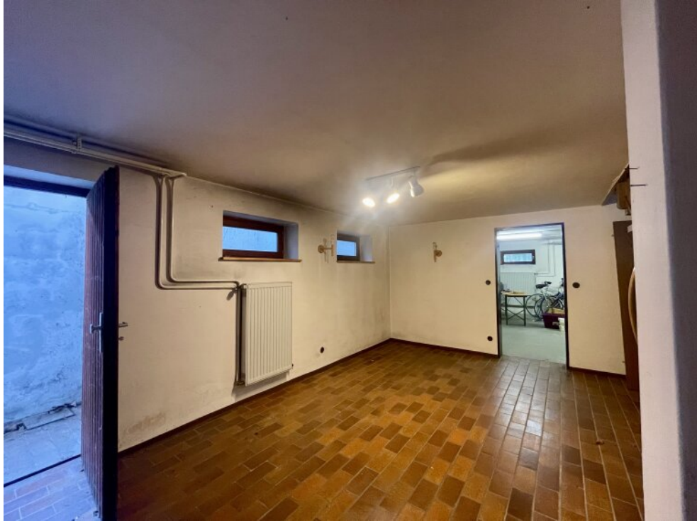
Gartenzugang zum Keller