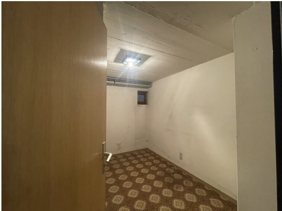
Lagerraum 2 im Keller