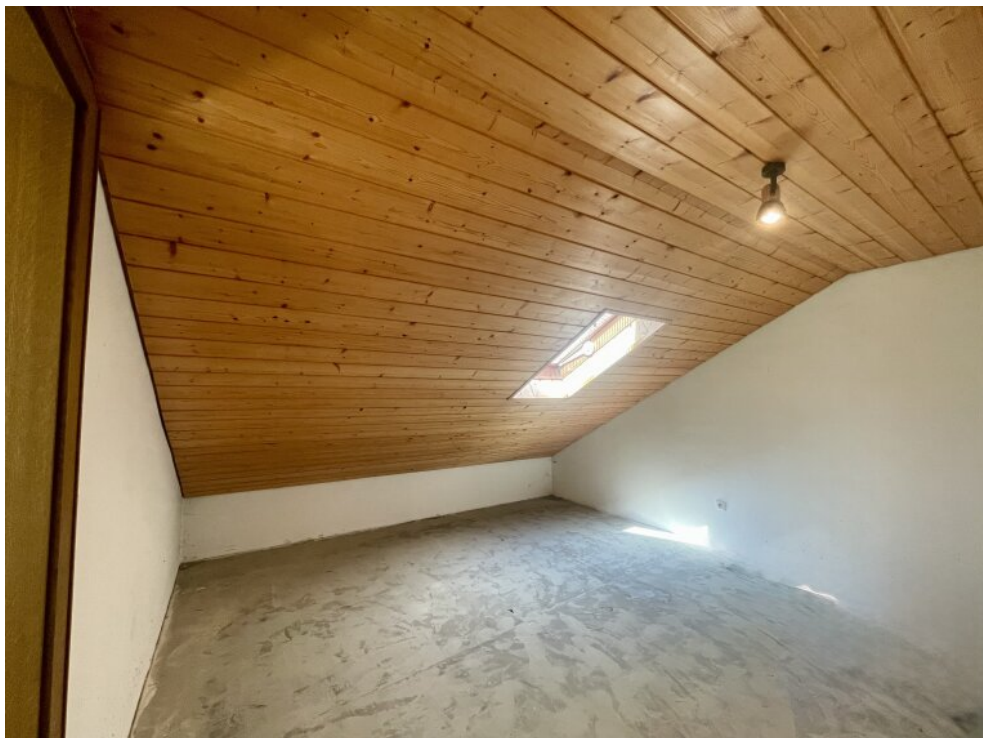
Nebenraum im OG