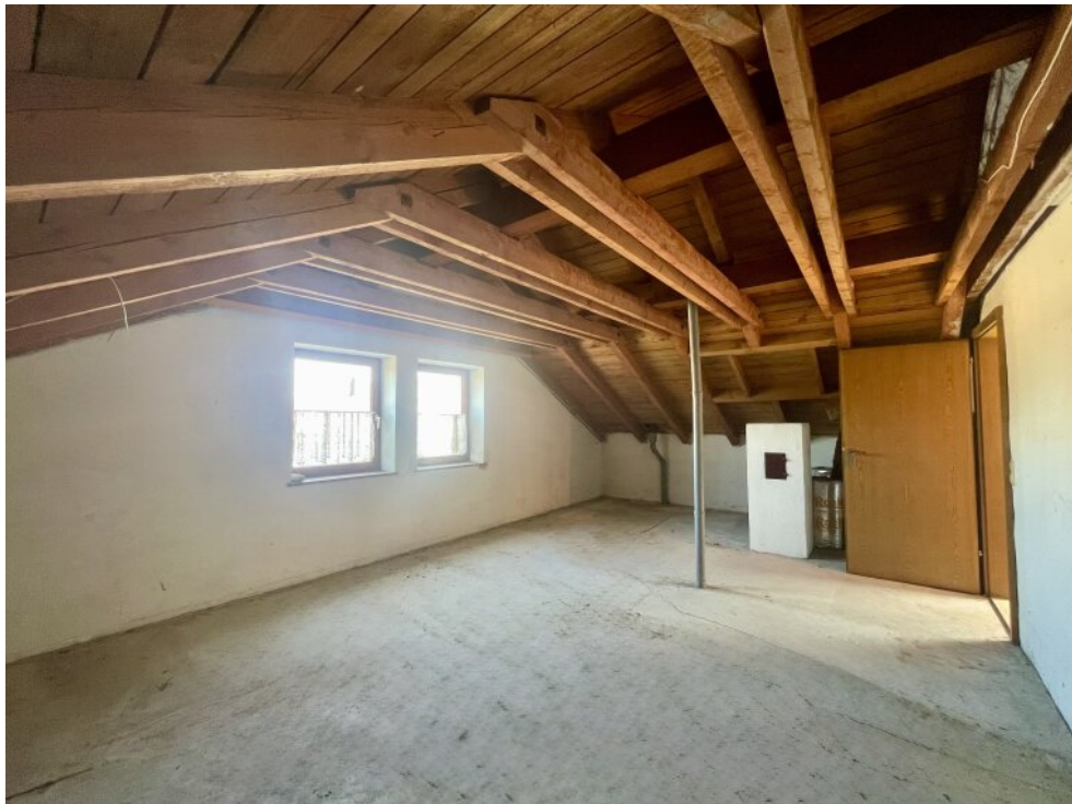
Speicherraum im OG