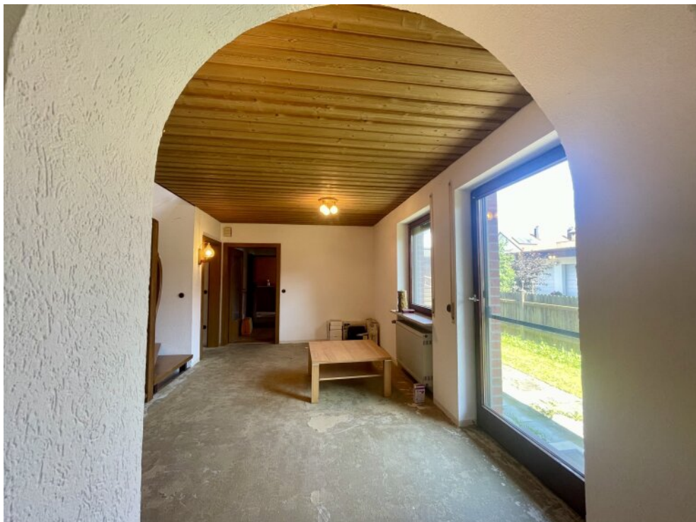
Flur im EG